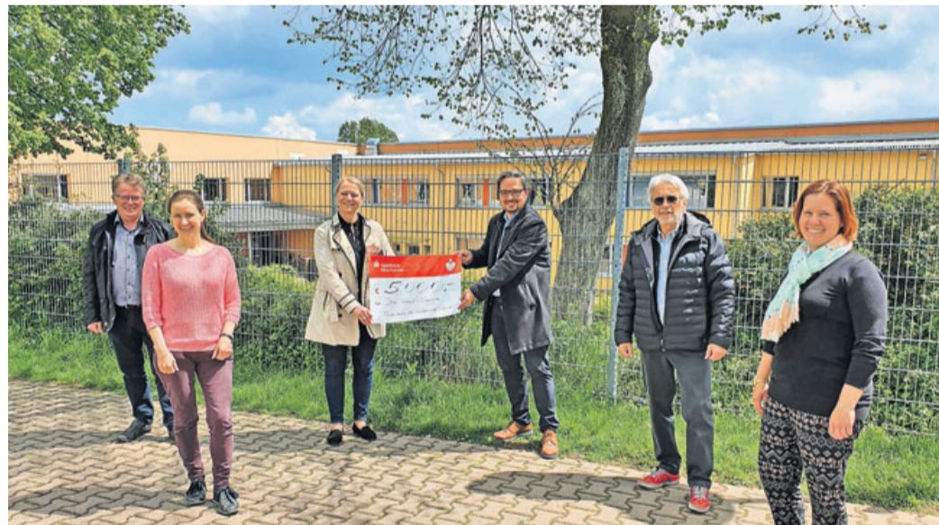
Die Übergabe der Budget-Schecks für 2021.