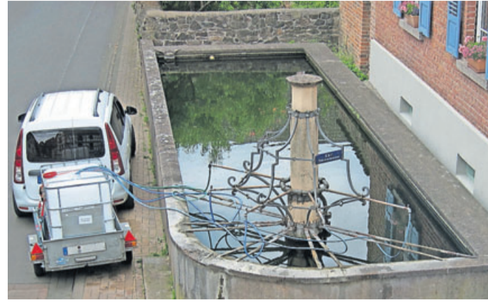
Tankvorgang am Röhrbrunnen im alten Ortskern von Wölfersheim.

Zum Glück gibt es in Wölfersheim den Röhrbrunnen, der im Jahr mehr als 10.000 Kubikmeter Wasser spendet, das schon seit jeher gerne zum Gießen verwendet wird. Der Überlauf des Brunnens fließt derzeit zunächst zu zwei weiteren kleinen Zapfstellen, bevor das Wasser dann über die Kanalisation zur Kläranlage läuft. Gut gebraucht würde das Wasser jenseits der Umgehungsstraße. Dort befindet sich ein ausgedehntes Kleingarten-Areal, das sich zunehmender Beliebtheit erfreut, aber leider keinen fußläufigen Zugang zu Gießwasser hat.