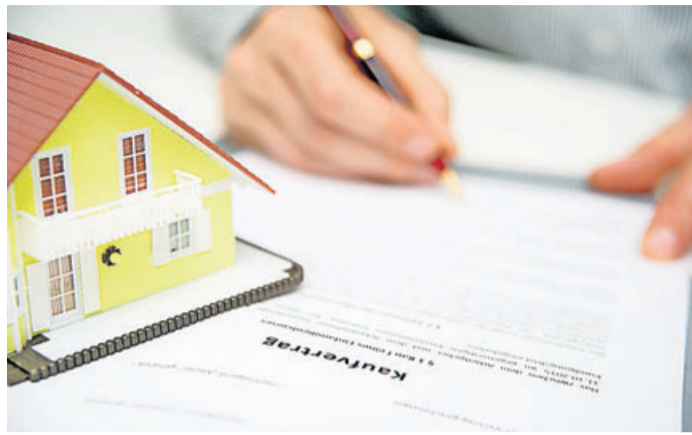
Genau Hinsehen lohnt sich: Wie ein Neubau ausgestattet ist, sollte im Kaufvertrag so detailliert wie möglich festgehalten sein.

Details wie der Waschtisch, der Innenputz oder Fenster und Türen: Die Ausstattung eines Neubaus ist in der Bau- und Leistungsbeschreibung im Bauvertrag festgelegt. Käufer sollten hier auf eine möglichst genaue Beschreibung achten, rät der Bauherren-Schutzbund (BSB). Das heißt: Am besten stehen dort eindeutige Produktbezeichnungen, Herstellermarken oder exakte Angaben zu den verwendeten Materialien. In der Praxis wird allerdings häufig nur vage formuliert, dann steht im Vertrag etwa nur „Heizung“. Abzurufen ist auch von bloßen Zusätzen wie „oder gleichwertig“. Hier sollte der Käufer