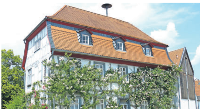
Ab 1. Juni 2021 ist das Rosenmuseum Steinfurth wieder geöffnet.

Bad Nauheim. Nach langen Monaten des Corona-Lockdowns ist das Rosenmuseum Steinfurth ab Dienstag, 1. Juni, täglich von 13 bis 17 Uhr. Café und Shop öffnen ebenso. Im Museum, Alte Schulstraße 1, 61231 Bad Nauheim-Steinfurth, gelten Corona bedingt besondere Vorsichts- und Hygienemaßnahmen. In der Dauerausstellung „Rosige Zeiten“ erfahren Rosenfreunde aus aller Welt fast alles, was sie über die Kunst- und Kulturgeschichte der Rose wissen müssen. Stichworte sind hier Joséphine de Beauharnais und ihr Rosengarten Malmaison, Botanik der europäischen Alten Gartenrosen, die Rose als Sinnbild der Liebe und Blume der Frauen, die Rose und die schönen Künste, Rosenöl