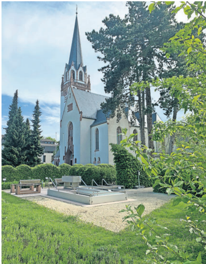
Das Kneippbecken im Gesundheitsgarten.

Die Website und das Magazin wurden in enger Abstimmung mit den drei Heilbädern, den regionalen Kneipp-Vereinen und dem Wetteraukreis entwickelt und auf den Weg gebracht. Durch das große Angebot in der Region und die Vielzahl an Möglichkeiten, Kneipp zu erleben, umfasst die erste Ausgabe des Magazins stattliche 44