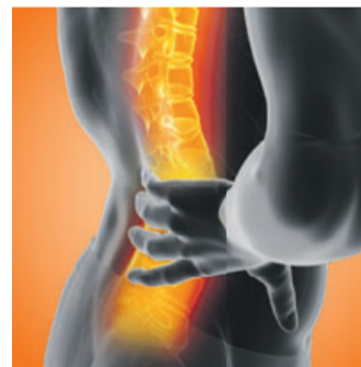
Fazit: Das neue Dorisol kann belastende Nervenschmerzen in Rücken, Nacken und Kopf natürlich wirksam behandeln!