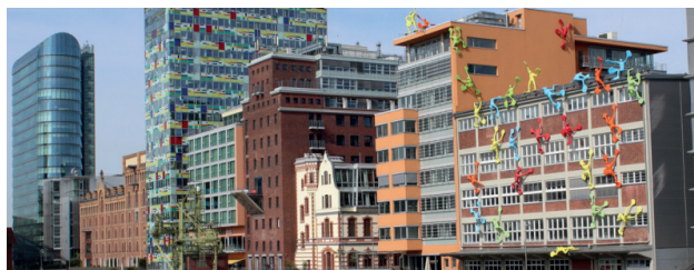
Passende Kulisse: Im Medienhafen (Bild unten) findet sich nicht nur das "Roggendorffhaus" mit seinen bunten Männchen an der Fassade, sondern eben auch der Startplatz, in dem das MÖFORM-QM tagen wird.