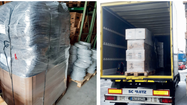
Vor allem Material zum Wiederaufbau benötigten die Einwohner der beiden kroatischen Städte Petrinja und Sisak. Die DMG unterstützte den Logistiker Diebold mit drei Paletten diverser Güter.

AKTION Am 28. Dezember 2020 erschütterte ein Erdbeben Teile von Kroatien. Tausende Menschen verloren ihr Zuhause. Einige Hilfsaktionen sammelten für den Wiederaufbau Spenden. Die DMG unterstützte DMS Diebold mit drei Paletten Material.