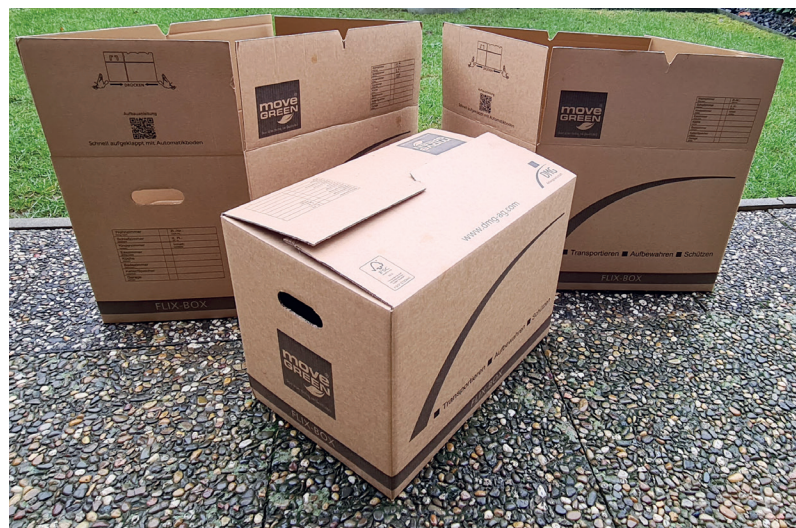
Kommt mit starker BE-Welle: Die 55 Liter Füllvolumen der neuen FlixBox sind in zwei Sekunden aufgebaut.

Vor allem zwei Zielgruppen hat die DMG ausgemacht: Objekt- und Privatumzüge. „Eben alles, wo es schnell gehen