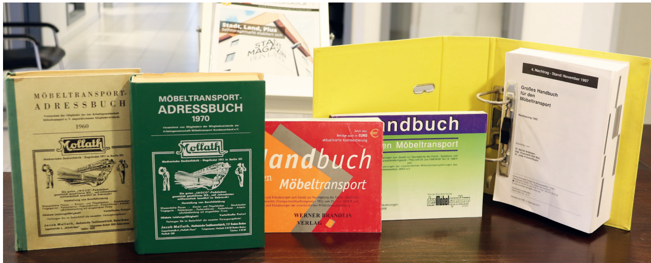
Über die Jahrzehnte gab es viele Printprodukte, die längst verschwunden sind: Auch hier hat die Digitalisierung vieles geändert und leichter gemacht.

damals zu bewältigenden Probleme der Papierbeschaffung, vor allem des Erhalts des erforderlichen Permits der zuständigen Militär-Dienststellen, sind im Vergleich zu den heutigen Verhältnissen kaum noch vorstellbar – was allzu leicht vergessen wird“, schrieb der möbelspediteur 1957 zu seinem zehnjährigen Bestehen.