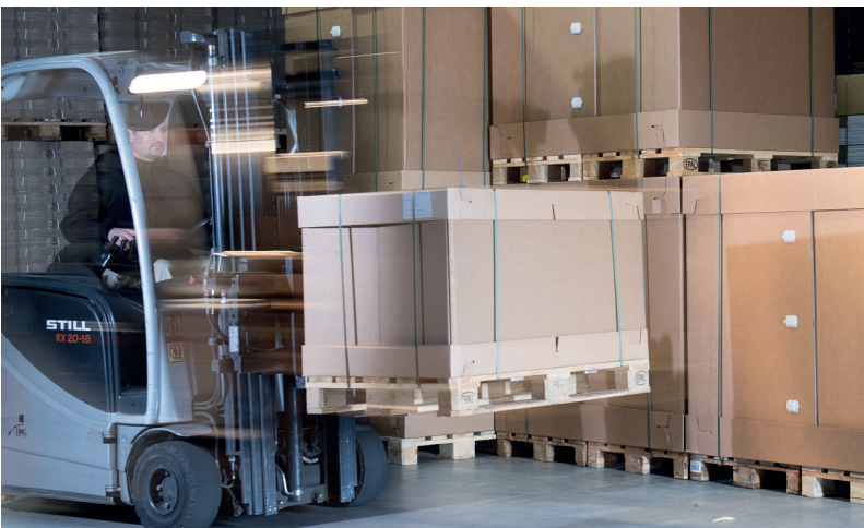
Alles auf Lager: Kundenindividuelle Artikel lassen sich an den zentralen Standorten der DMG einlagern und als bedarfsgerechte Mengen schnell abrufen.

PRODUKTE Kaum ein Umzugsspediteur, der nicht in der Kundendatenbank der DMG steht. Doch die wenigsten Kunden kennen die weitreichenden und umfassenden Serviceleistungen des Zubehörspezialisten.