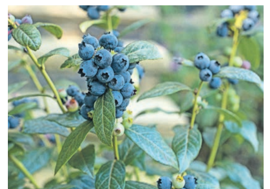
Beerennobst ist nicht nur lecker, sondern auch vitaminreich und gesund.

Viele Fehler passieren etwa beim Einpflanzen: Beerennobst wünscht sich genügend Platz für das Wachstum, am liebsten an einem sonnigen, windgeschützten Standort. Das Pflanzloch ist dabei doppelt so groß wie der Wurzelballen anzulegen. Auch die Wahl der richtigen Erde ist wichtig. Blaubeeren wünschen sich einen sauren Boden mit einem pH-Wert von 4,5 bis 5,5. Beim Einpflanzen im Beet oder im Kübel lässt sich Rhododendronerde verwenden. Himbeeren und Brombeeren hingegen benötigen einen normalen Boden mit einem pH-Wert von 6,5 bis 7,5. Beim Einpflanzen im Gefäß sollte man lieber normale Pflanz Erde nutzen. Die Pflanzen nach dem Einsetzen gründlich angießen und stets ausreichend wässern. Auch zwischen der Blüte und Ernte ist es wichtig, dass die Erde nicht austrocknet. Bei Blaubeeren ist ein jährlicher Schnitt nicht erforderlich, Himbeere und Brombeere hingegen werden direkt nach der Ernte beschnitten – und zwar nur die fruchtbaren Triebe kurz über dem Boden.