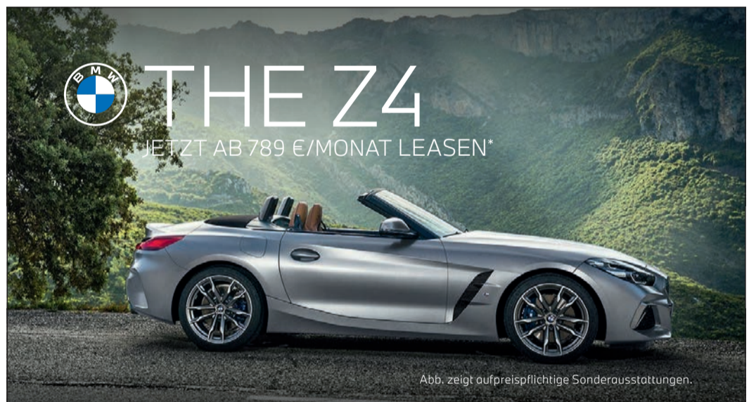
Abb. zeigt aufpreispflichtige Sonderausstattungen.

Übungsstunden finden am 14. und 21. Juni auf dem Platz der Generationen am Hans-Bernhardt-Reichow-Weg statt. Beim Heigl kommt der Aufrichtung der Wirbelsäule und des seelischen, körperlichen und geistigen Befindens zentrale Bedeutung zu.