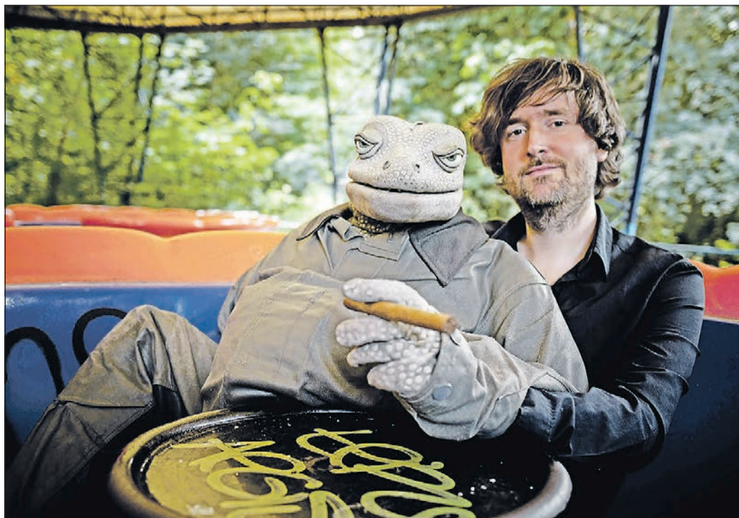
Michael Hatzius präsentiert sich mit seiner Echse beim Sommertheater.