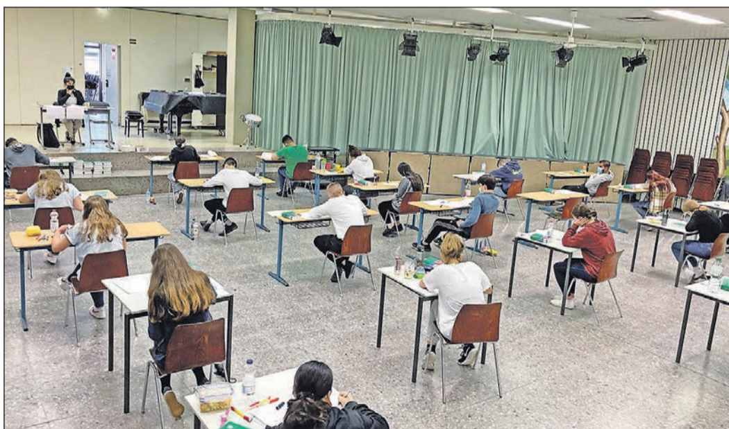
In dieser Woche schreiben 72 Schüler der Haupt- und Realschule in großen Räumen ihre Abschlussarbeiten.