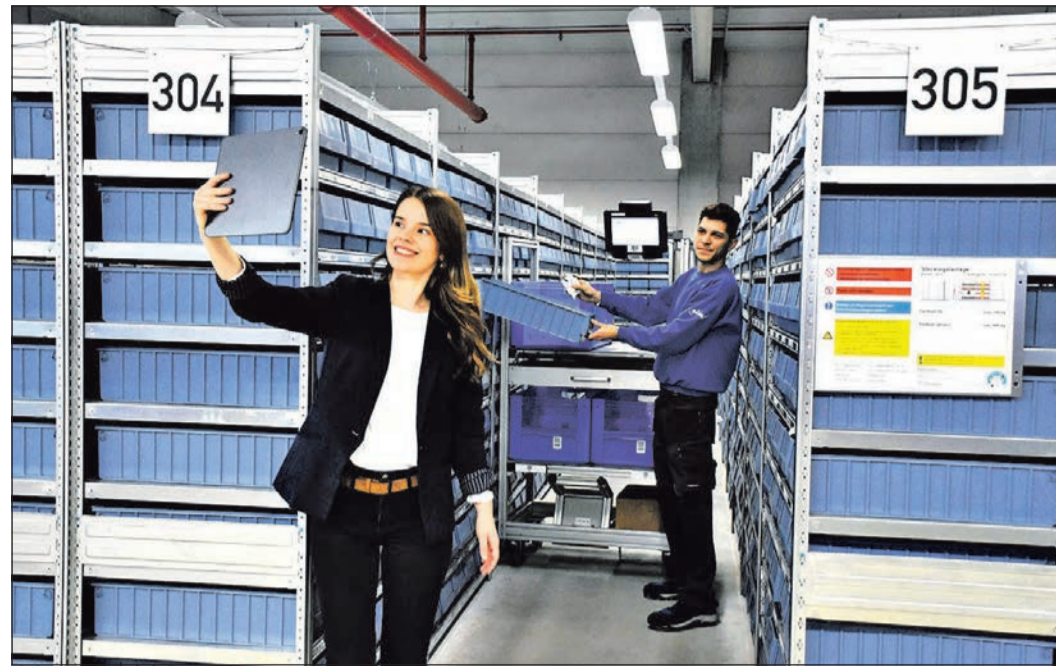
Talent Elements gibt der Berufsorientierung einen Schub in die Digitalisierung und ermöglicht es, Schulen zu unterstützen.