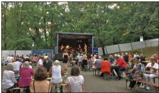
Impression Musiksommer 2020

Neben der interessanten Dauerausstellung über die Bad Sodener Historie im Stadtmuseum ist im Foyer des Kulturzentrums Badehaus auch wieder die Vitrinenausstellung zum Thema „150 Jahre Badehaus“ aufgebaut. Auf Schautafeln und durch historische Exponate in den Vitrinen erfahren Interessierte, wie sich das ehemalige Badehaus zum heutigen Kulturzentrum Bad Sodens entwickelte. Wer sich ein Zeitfenster für den Besuch des Stadtmuseums reservieren möchte, findet unter https://www.bad-soden.de/entdecken-erleben/museum/reservierung-besuchstermin/ weitere Informationen. Anmeldungen sind auch per E-Mail an christiane.schalles@stadt-bad-soden.de möglich. Interessierte können auch spontan vorbeikommen. Sollte die maximale Besucherzahl noch nicht erreicht sein, kann ein Kontaktformular vor Ort ausgefüllt werden. Zur aktuellen Ausstellung ist auch eine informative Publikation erschienen, die für 15 Euro im Stadtmuseum, in der Stadtbücherei und in den Bad Sodener Buchhandlungen käuflich erworben werden kann.