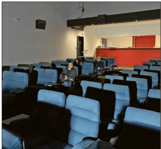
Ohne Mittelreihe – für mehr Platz und Abstand!

Bad Soden (gs) - Dass nach der Pandemie nicht mehr alles so sein wird wie vorher, kann wohl nicht mehr geleugnet werden – dass diese besonderen Zeiten aber durchaus auch Chancen und Möglichkeiten bieten, steht dabei oft auf einem anderen Blatt. Bedingt durch die wirtschaftliche Situation wollte das Betreiberpaar der KultKinobar, Sebastian Nagy und Julia Halbritter, den Kinobetrieb gerne abgeben. Sie hatten das Bad Sodener Kino in den vergangenen Jahren zu einer überregionalen Institution reifen lassen und das gemütliche Filmtheater mit ihrem interessanten Konzept, sowie einem großen cineastischen und kulturellen Veranstaltungskalender, weit über die Bad Sodener Stadtgrenzen hinaus, bekannt gemacht.