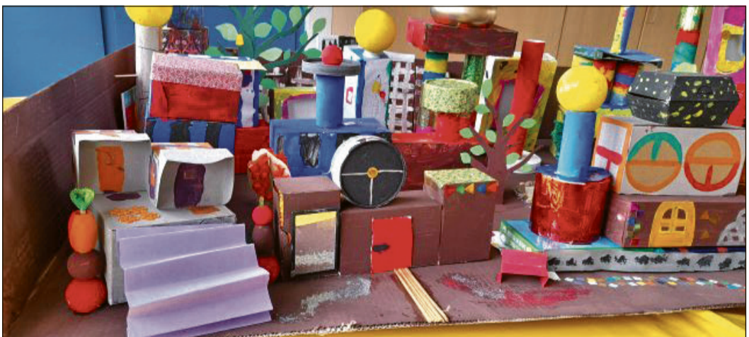
Kunterbunte Fantasiestadt mit einem Hauch „Hundertwasser“

Bad Soden (bs) – Mit einem kreativen Projekt haben sich 13 Kinder der Ferienbetreuung an der Bad Sodener Theodor-Heuss-Schule aus den Jahrgangsstufen 1 bis 4 während der Osterferien beschäftigt.