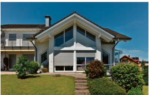
Reflektieren die Sonnenstrahlen, noch bevor diese auf das Fensterglas auftreffen: Aluminium-Rolläden von Schanz.

(epr) Keine Frage: Die Hauptaufgabe von Rolläden besteht darin, das Sonnenlicht daran zu hindern, ins Haus einzudringen und die Räume aufzuheizen. Besonders gut gelingt das mit Aluminium-Rolläden von Schanz. Sie reflektieren bis zu 92 Prozent der Sonnenstrahlen, noch bevor diese auf das Fensterglas auftreffen. Somit wird einem Hitzestau, der sich gerne unter dem Dach oder im Wintergarten entwickelt, zuver-