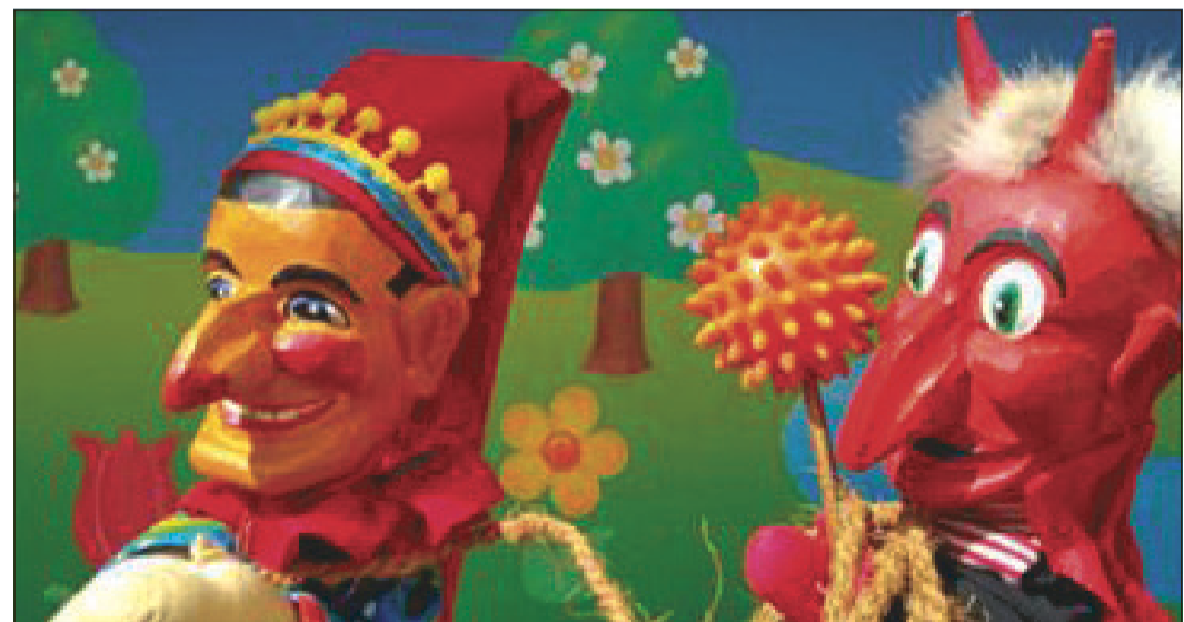
Der Oberteufel führt nichts Gutes im Schilde ...