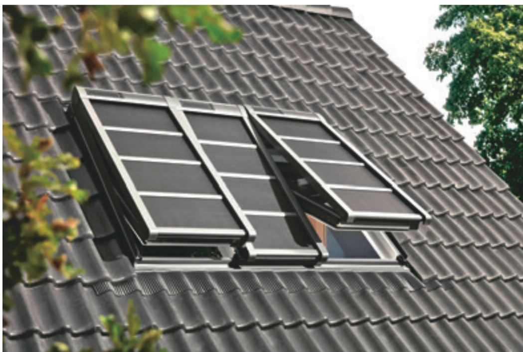
Hitzeschutz-Markisen, hier in der verdunkelnden Ausführung, werden außen auf dem Fensterflügel montiert und verhindern so, dass die energiereichen Sonnenstrahlen auf die Scheibe treffen.

Das Material ist strapazierfähig und ermöglicht einen ungestörten Blick nach Draußen für einen Sommer zum Genießen. Mehr unter www.velux.de .