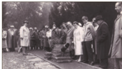
Anno 1958 – Einweihung des „Kleingolfplatzes im Schloßchenpark“

Dass der Minigolfplatz in die Jahre gekommen war, ließ sich nicht mehr verbergen – zu groß waren die Schäden zuletzt. Die nun abgetragenen Bahnen wiesen tiefe Risse auf,