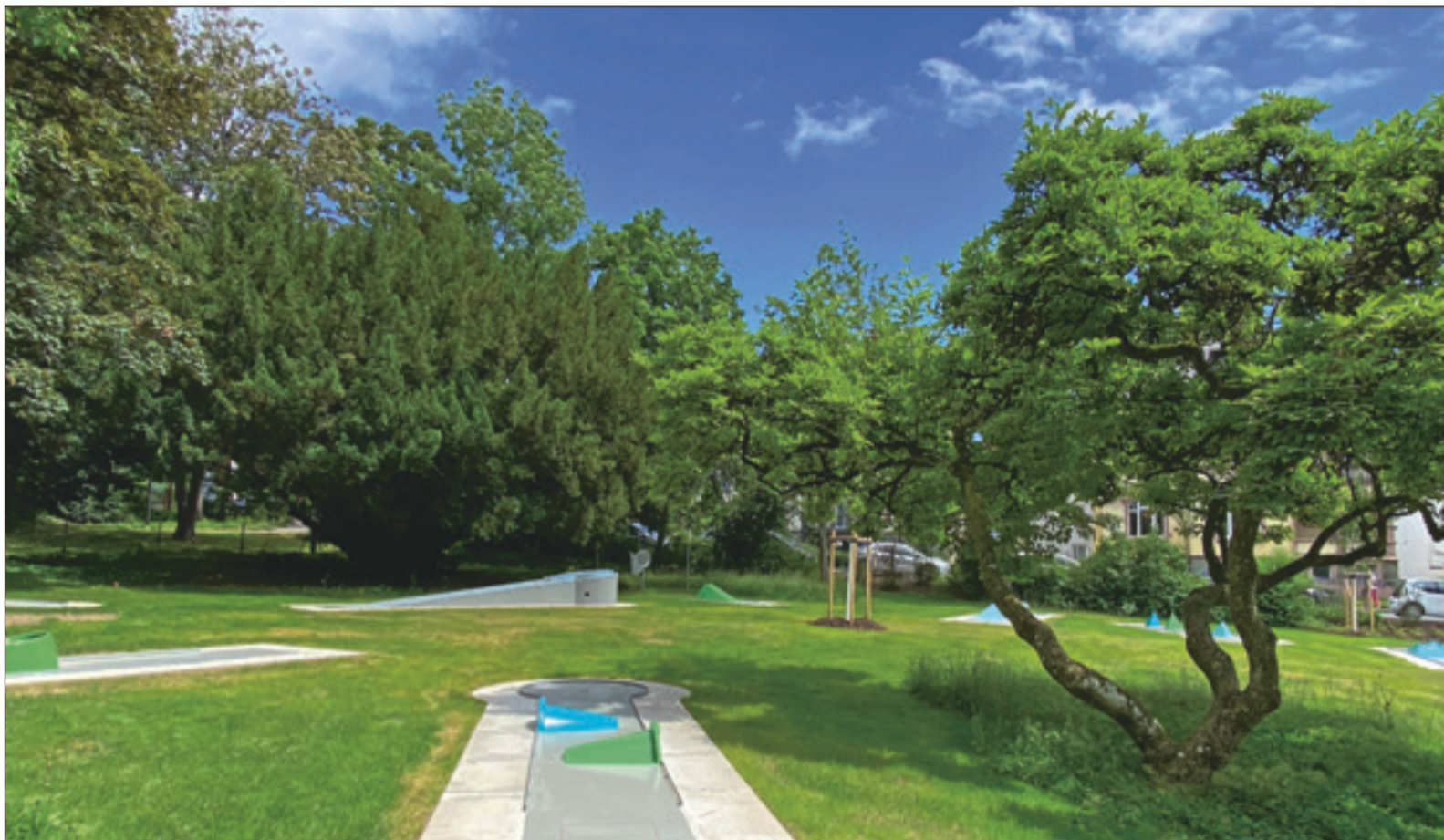
Am ersten Juli-Wochenende ist es soweit: Die neugestaltete Minigolfanlage im alten Kurpark öffnet ihre Pforten

Bad Soden (Sc) - Spaziergängern ist es schon länger aufgefallen: Die 18 Bahnen auf der Minigolfanlage im Alten Kurpark an der Kronberger Straße sind neu verlegt und der frisch eingesäte Rasen sprießt bei dem herrlichen Sommerwetter. Dementsprechend groß ist die Vorfreude bei allen Freizeitsportlern und Hobbyspielern – die Saison kann endlich beginnen. Freigegeben werden die Bahnen am Samstag, 3. Juli 2021, um Punkt 12 Uhr.