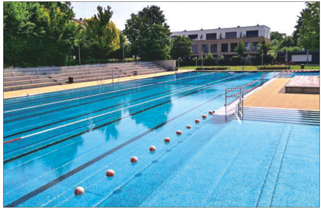
Rein ins kühle Nass!