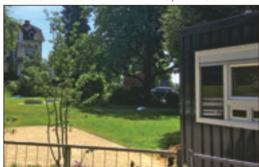
Ein neues Kassenhäuschen gab es auch.

Die neue Anlage kann sich wahrlich sehen lassen: Klare Linien, übersichtliche Anlage, nagelneue Bahnen und schattenspendende Laubbäume laden die Profi- und Hobbyspieler ab dem Wochenende zum Abschlag ein. Die neuen Minigolfbahnen sind in Form eines aufgelockerten Rundwegs in die frisch angelegte Rasenfläche eingebettet, und sollte man einmal warten müssen, laden Bänke zum Rasten und Verweilen ein. Der Eingang, vielen Bad Sodenern noch gut bekannt und ehemals am Übergang von der Straße „Am Bahnhof“ in den Alten Kurpark gelegen, wurde jetzt direkt in den Alten Kurpark verlegt. Die Eintrittspreise sind im Vergleich zur letzten Saison unverändert geblieben, Erwachsene zahlen fünf Euro, Kinder unter