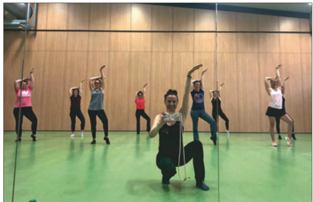
Die Freude über „normales“ Training ist riesengroß, so auch bei den Dancing Pro's.