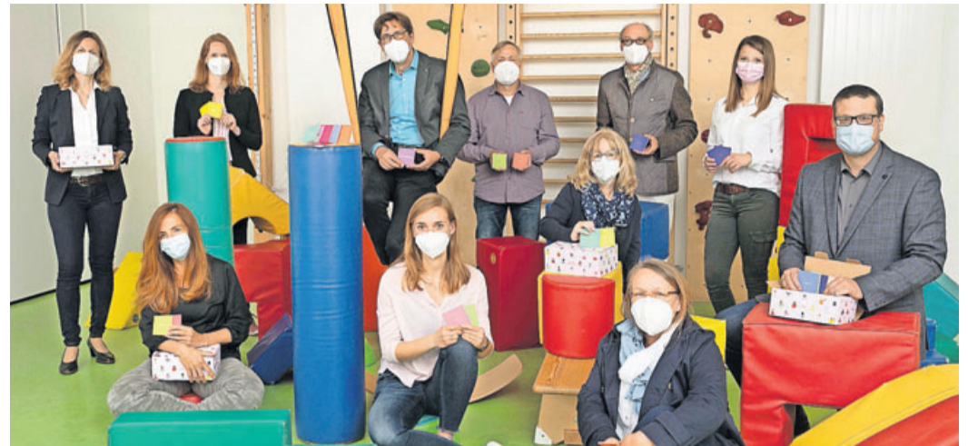
Die Übergabe der „Talking Hands“.

Wirtschaft für Bad Nauheim unterstützt Integrationsarbeit