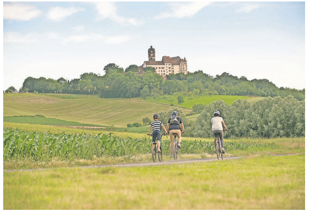
Ausflug mit dem Fahrrad zur Ronneburg, die wieder geöffnet hat.

Diese Tipps richten sich nicht nur an Gäste, die aus dem Rhein-Main-Gebiet oder weiter anreisen, sondern auch und gerade an die einheimische Bevölkerung. „Denn häufig weiß man gar nicht,