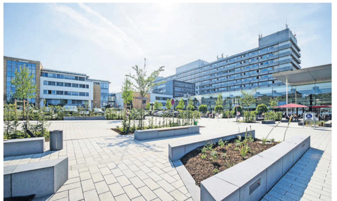
Das Klinikum Fulda.

Das allgemeine Besuchsverbot gilt zunächst weiter