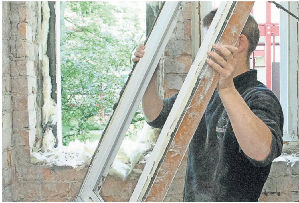
Modernisierungen sollten gut geplant werden. So lassen sich auch die Kosten im Zaum halten.

Bauherren, deren Immobilienkredit für ihr Haus noch läuft, müssen nicht unbedingt einen weiteren Kredit aufnehmen. „Wenn das Haus mit einer Grundschuld belastet ist und der darüber abgesicherte Kredit teilweise bereits getilgt ist, lässt sich vielleicht die Kreditsumme noch einmal aufstocken oder eine günstige Zweit- oder Anschlussfinanzierung vereinbaren“, sagt van Dülmen. Ein weiteres Instrument zur Finanzierung von Renovierungsprojekten ist der Bau-