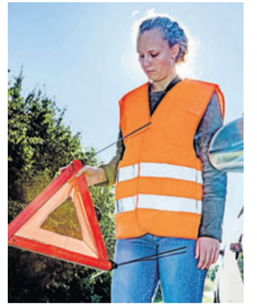
Mehr Sicherheit im Notfall: Wer eine Panne hat, muss das Warndreieck mit ausreichend Abstand zum Fahrzeug aufstellen, um den nachfolgenden Verkehr zu warnen.

Ansonsten ist der Seitenstreifen tabu. Das gilt auch für das immer wieder zu beobachtende Vorfahren im Stau zur nächsten Ausfahrt oder zum nächsten Parkplatz. Auch im Stau sind Aussteigen und das Betreten der Fahrbahn gene-