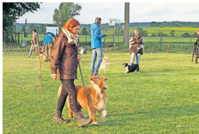
Der Hundeverein TAO hat wieder geöffnet und bietet ein vielfältiges Trainings- und Workshop-Programm für Neulinge und erfahrene Hundebesitzer.