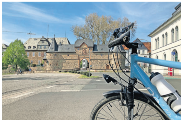
Wird Radfahren in Friedberg bald wieder attraktiver?

Friedberg. Wer häufig in Friedberg mit dem Rad unterwegs ist, kennt das Problem: Gute Fahrradwege sind kaum vorhanden, manche enden abrupt oder sind mit vielen Hindernissen versehen, viele Verkehrsführungen sind unklar. Die Besonderheiten des Radverkehrs in unserer Stadt können Sie jetzt interaktiv erleben: Laden Sie sich die kostenfreie App „Actionbound“ auf Ihr Smartphone herunter und suchen Sie nach „Radfahren in Friedberg“. Viele interessante Fragen zum Radverkehr begleiten Sie auf einer kurzweiligen Rundtour, die Sie mitradeln können, an der Sie aber auch von zu Hause aus teilnehmen können. An zehn Stationen ist Ihr Wissen über Radfahren im Allgemeinen und in Friedberg in Speziellen gefordert – Überraschungen inklusive. Auch ein Einkaufsgutschein wird ver-