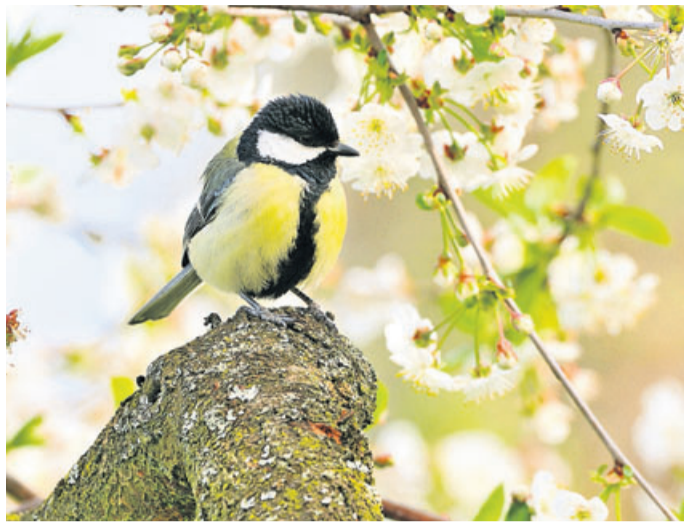
Kohlmeisen sind Höhlenbrüter und bevorzugen Baumhöhlen als Nistplätze.

In Wald und Wiese ist jetzt ordentlich was los. Nester werden gebaut, Setzplätze ausgewählt und Jungtiere auf die Welt gebracht. Gut versteckt liegen Junghasen und Rehkitze dann im hohen Gras und warten auf das Zurückkommen ihrer Muttertiere, während sich die Feldlerche in offenem Gelände besonders wohl fühlt und auch dort ihre Eier ablegt. Doch egal, ob Haarwild, Boden-, Hecken- oder Höhlenbrüter oder andere heimische Wildtiere, eines haben sie alle gemein-