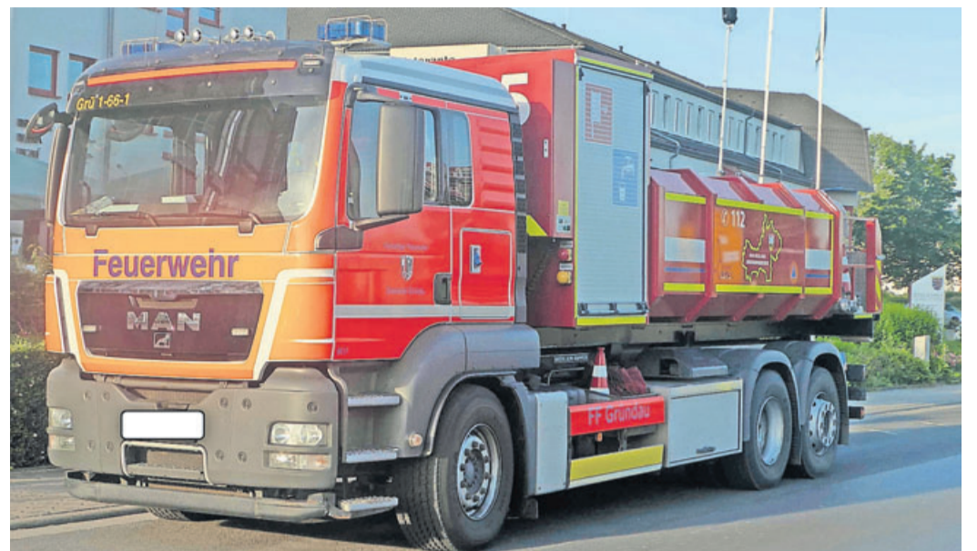
Was passiert bei einem Unfall im Einsatz?

sagt: Dem Einsatzfahrzeug ist Vorfahrt zu gewähren. Denn Blaulicht und Martinshorn in Kombination werden nur im größten Notfall verwendet – oft geht es um Menschenleben oder die öffentliche Sicherheit.