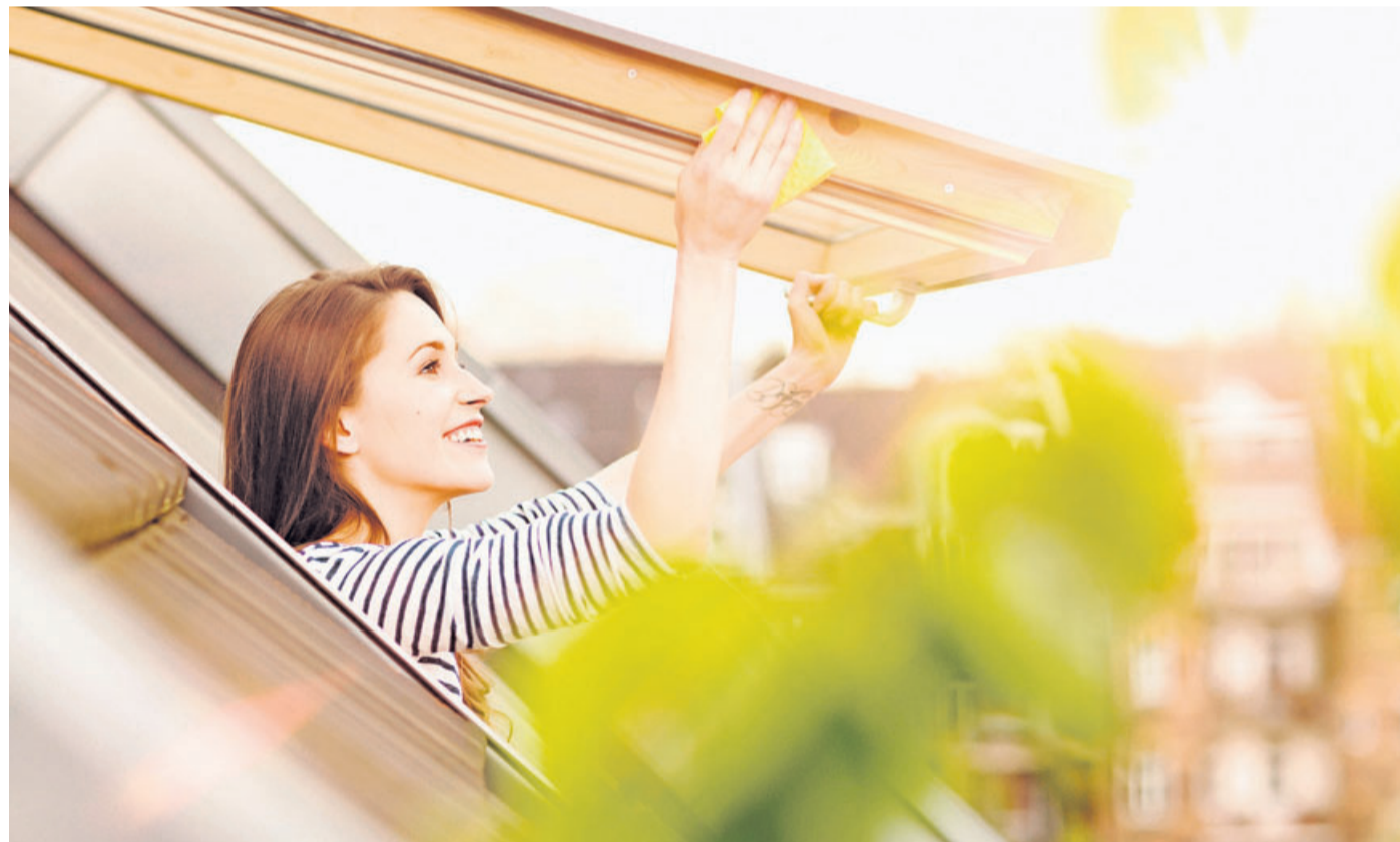
Der Schutz gegen Hitze im Haus spielt wegen der heißer werdenden Sommer eine wichtige Rolle bei der Planung von Modernisierungen.

Wer aus finanziellen Gründen oder Umweltüberlegungen heraus eine Modernisierung seiner Gebäudehülle plant, sollte