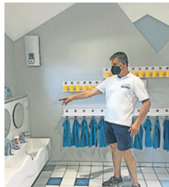
Kindgerechte sanitäre Anlagen im neuen Kindergarten.

Später hatte dann auch erfreulicherweise die SPD