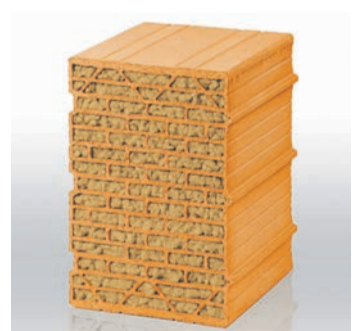
Wandbaustoff als Wertstoff: Mauerziegel sowie deren integrierte Dämmung können problemlos dem Wertstoffkreislauf wieder zugeführt werden.

Bau der eigenen vier Wände mit dämmstoffgefüllten Unipor-Ziegeln Verschnitt an, wird dieser nicht einfach entsorgt. „Unser Ziel ist es, auch die Füllungen unserer ‚Coriso‘ und ‚Silvacor‘-Mauerziegel weiter zu verwenden. Hierfür werden die Dämm-Materialien aus den Ziegeln gelöst und als Granulat der Produktion wieder zugeführt“, so Fehlhaber. „An manchen Standorten nehmen wir hierfür bereits heute Ziegelverschnitt zurück.“