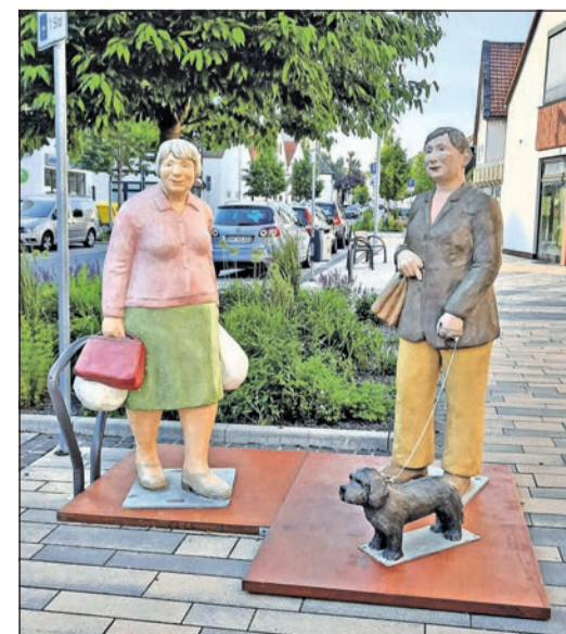
Sie sind hier einfach nur kurz zu einem Schwätzchen stehen geblieben, während Waldi gelassen neben Frauchen wartet: Die beiden „Einkaufsfrauen“.

Die Plätze, an denen die „Alltagsmenschen“ stehen, werden mit den Künstlerinnen gemeinsam ausgesucht. Teilweise werden Figuren speziell für bestimmte Orte angefertigt. Obwohl dies für Eschborn nicht der Fall war, passen sie hervorragend in das Geschehen hinein.