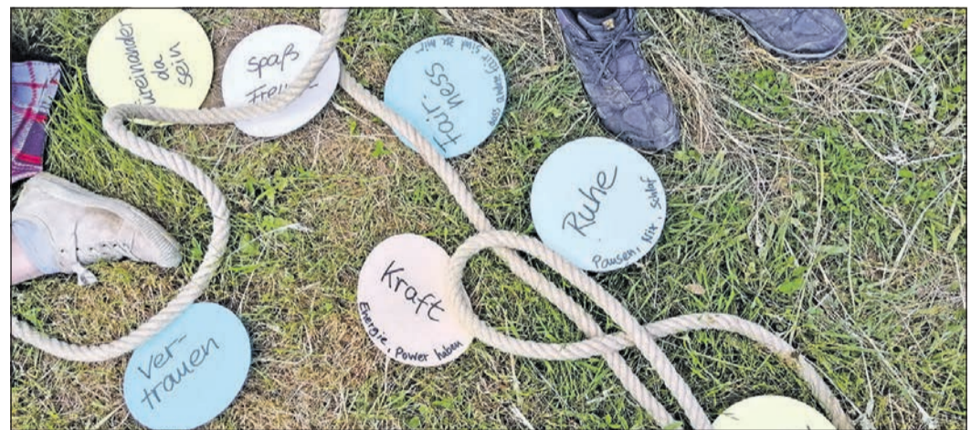
Das Projekt „Sternenzelt“ der Evangelischen Familienbildung Main-Taunus hilft Kindern, ihre Trauer in gemeinsamem Austausch zu verarbeiten.

Wer im Team mitarbeiten möchte oder das Projekt durch eine Spende fördern möchte, wendet sich gerne per E-Mail an claudia.vormann@dekanat-kronberg.de oder meldet sich unter Telefon 0157-34732564.