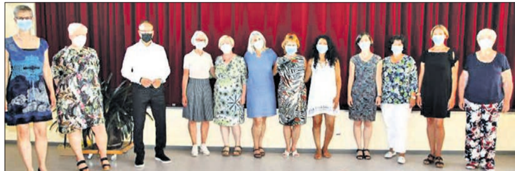
Die neuen Hospizbegleiterinnen erhalten ihre Zertifikate und widmen sich nun dieser wichtigen Aufgabe.

DIRK PYKA HAUPTSTRASSE 21 65812 BAD SODEN-NEUENHAIN TEL.: 0 61 96 / 2 15 49 · Mobil 0176 / 34 49 40 76