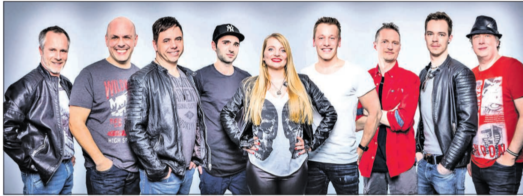
„Eine Band namens Wanda“ sorgt am Mittwoch, 30. Juni, um 19.30 Uhr, am Bürgerzentrum in Niederhöhnstadt für Stimmung.

Eschborn (ew). Am Dienstag, 6. Juli, findet von 14 bis 16 Uhr im Pavillon im Spessartweg 21 das erste Treffen in diesem Jahr des Gesprächskreises für Menschen mit Sehbehinderung statt. „Wir wollen uns austauschen, wie es den Teilnehmern im vergangenen Jahr ergangen ist“, sagt Ute Pohl. „Zudem werden wir gemeinsam entscheiden, welche Themen bei den nächsten Treffen behandelt werden sollen.“ Es können bereits jetzt Termine für eine Einzelberatung im Rathaus bei Fragen rund um Sehbehinderungen und Blindheit vereinbart werden. Die Sprechstunden sind am 9. und 23. Juli von 9 bis 12 Uhr. Ute Pohl bittet, auf den Anrufbeantworter zu sprechen, falls sie die Anrufe nicht persönlich entgegennehmen kann. Sowohl für den Gesprächskreis als auch für die Beratungstermine ist eine Anmeldung unter Telefon 069-87205080 erforderlich. Die Zielhaltestelle für das AST-Taxi ist die Seniorenwohnanlage Eschborn.