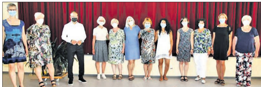
Die neuen Hospizbegleiterinnen erhalten ihre Zertifikate und widmen sich nun dieser wichtigen Aufgabe.

DIRK PYKA HAUPTSTRASSE 21 65812 BAD SODEN-NEUENHAIN TEL.: 0 61 96 / 2 15 49 · Mobil 0176 / 34 49 40 76