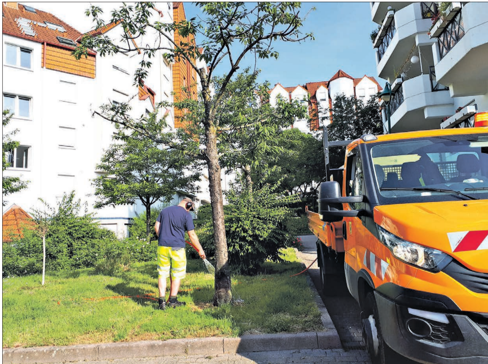
Ein Mitarbeiter des städtischen Bauhofs ist unterwegs, um die jungen Bäume im Stadtgebiet zu gießen.