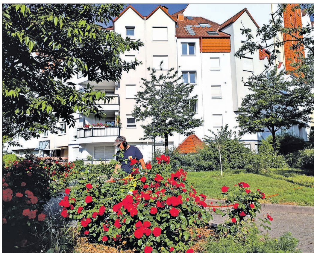
Wasser lässt die Rosen blühen.