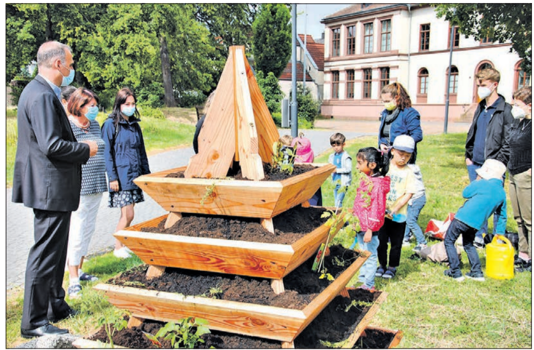
Bürgermeister Alexander Immisch bedankt sich bei den Kindern, Jugendlichen und Erwachsenen für ihr generationsübergreifendes Engagement.

Schwalbach (sbw). Zu Beginn eines „Badezeit-Blocks“ können sich bei schönem Wetter lange Schlangen von Wartenden vor der Kasse des Naturbades bilden. Das Naturbad-Team empfiehlt deshalb den Kauf von Elferkarten. Ist die Reservierung (QR-Code) geprüft, hat man nach Entwertung Zutritt zum Bad, ohne an der Kasse anzustehen. Eine Elferkarte spart aber nicht nur Zeit. Denn da sie 30 Euro kostet, kann man das Bad ein Mal umsonst besuchen. Ein weiterer Vorteil: Wird sie in dieser Saison nicht verbraucht, so kann sie in der nächsten Badesaison noch genutzt werden. Auch in dieser Badesaison müssen Hygiene-Regeln zur Bekämpfung der Pandemie beachtet werden. Eine Reservierung im Internet unter www.schwalbach.de/naturbad ist erforderlich. Um möglichst vielen Gästen den Besuch zu ermöglichen, wurde die tägliche Badezeit in drei Blöcke aufgeteilt, von 10 bis 13 Uhr, von 13.30 bis 16.30 Uhr und von 17 Uhr bis zur Schließung.