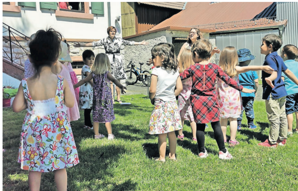
Kinder tanzen zur Musik.

Nach dem Gottesdienst waren Eltern, Großeltern und alle Interessierten eingeladen, die Kita zu besichtigen. Um den geltenden Bedingungen gerecht zu werden, konnten die Besucher über das Außengelände um die Kita herumlaufen und durch die Fenster in die Gruppenräume und Funktionsräume schauen.