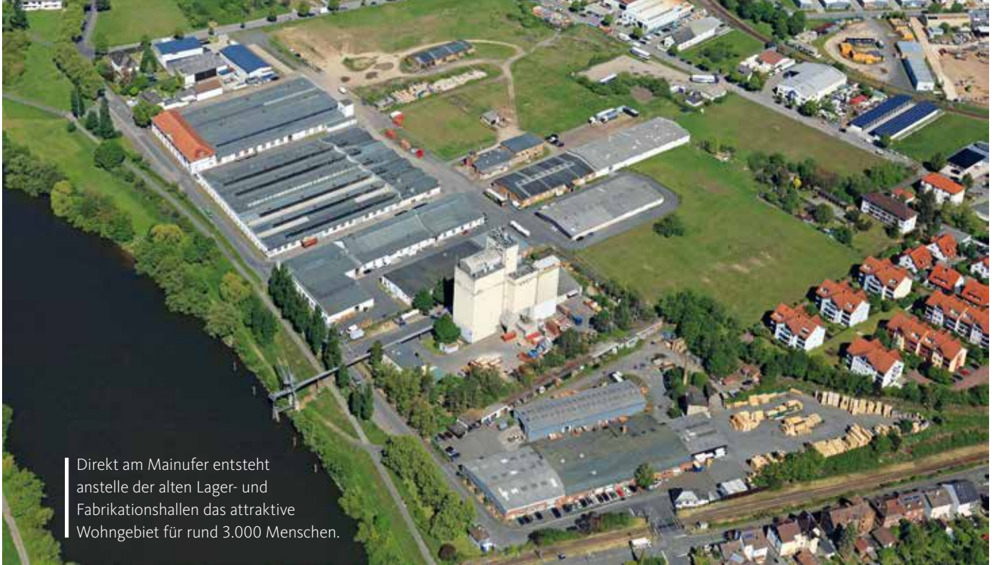
Direkt am Mainufer entsteht anstelle der alten Lager- und Fabrikationshallen das attraktive Wohngebiet für rund 3.000 Menschen.