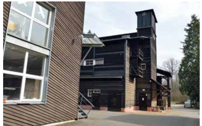
Gebäude der Samendarre.

vorrätig. Hinzu kommen Sträucher wie die Wildbirne oder Eiben, die zwar keinen wirtschaftlichen Wert haben, aber für den Naturschutz wichtig sind. Stolz ist der Darremeister dabei besonders auf den Wildapfel. „Wir sind in ganz Deutschland die einzigen, die Wildapfel-Nachkommen produzieren.“ Die Gesamternte betrug im vergangenen Jahr knapp 100 Tonnen Rohsaatgut. Mit 63 Tonnen werden die verschiedenen Eichenarten am häufigsten geerntet, landen aber