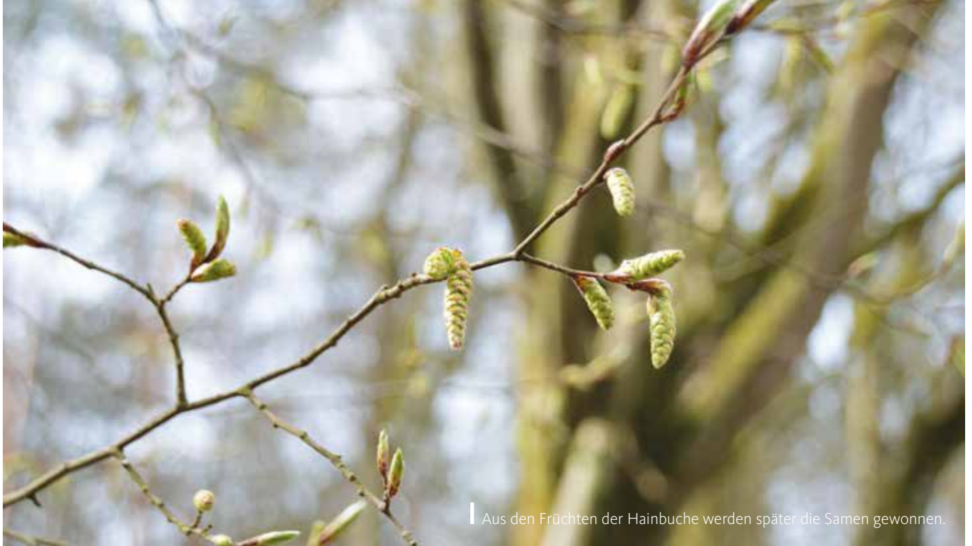
! Aus den Früchten der Hainbuche werden später die Samen gewonnen.