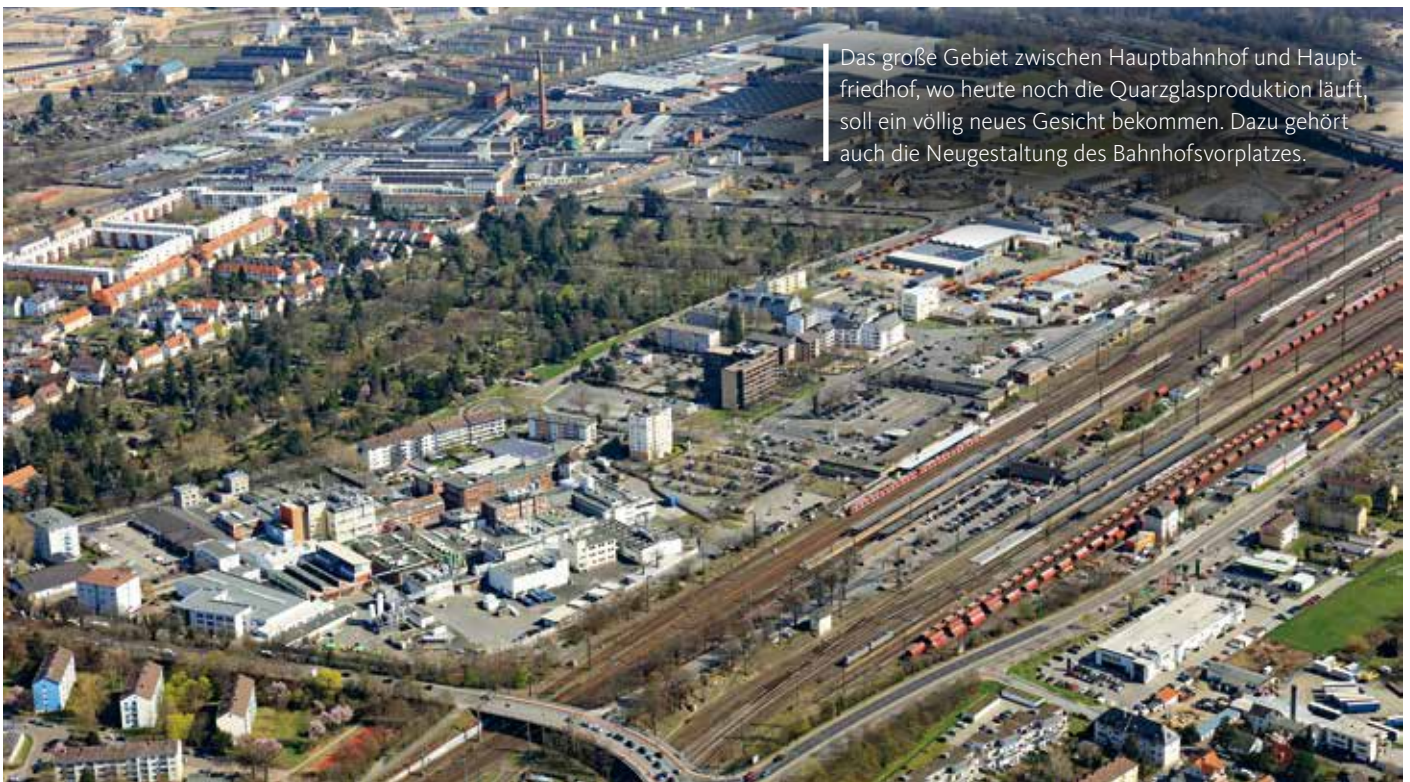
Das große Gebiet zwischen Hauptbahnhof und Hauptfriedhof, wo heute noch die Quarzglasproduktion läuft, soll ein völlig neues Gesicht bekommen. Dazu gehört auch die Neugestaltung des Bahnhofsvorplatzes.

Wohnen und Leben will der Bauträger BUWOG in diesem direkt am Mainufer gelegenen Gebiet – das für eine industrielle Nutzung viel zu schade ist – realisieren. Rund 1.400 Wohneinheiten sollen hier entstehen. Geplant ist dabei ein bunter Mix, der von der Einzimmerwohnung zum Beispiel für Studenten bis zu großen Familienwohnungen mit vier und mehr Zimmern reicht. Eigentumswohnungen sind dabei genauso enthalten wie Mietwohnungen, von denen ein Teil auch im sozialen Wohnungsbau realisiert wird. Terrasse, Balkon oder