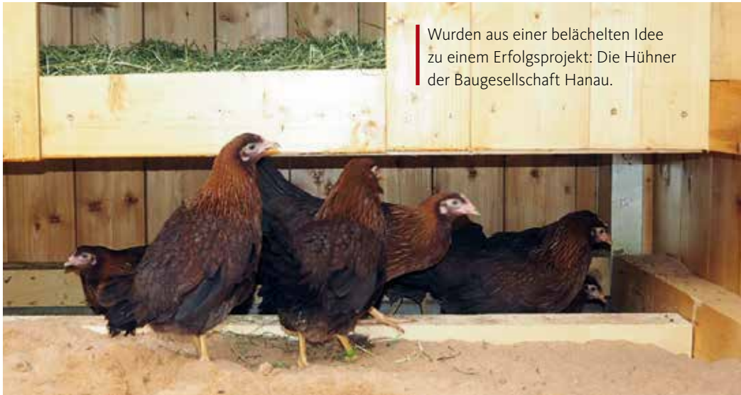
Wurden aus einer belächelten Idee zu einem Erfolgsprojekt: Die Hühner der Baugesellschaft Hanau.

WOHNEN MIT FEDERVIEH | Das „Hühnerprojekt“ der Baugesellschaft ist eine Erfolgsgeschichte