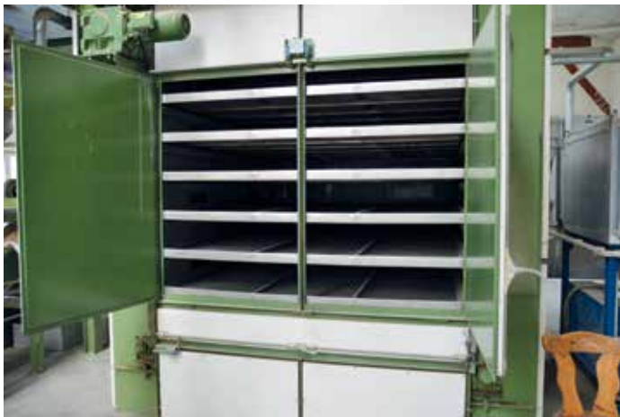
In der sogenannten Trockenkammer werden die unterschiedlichen Arten bei verschiedenen Temperaturen zunächst getrocknet ...