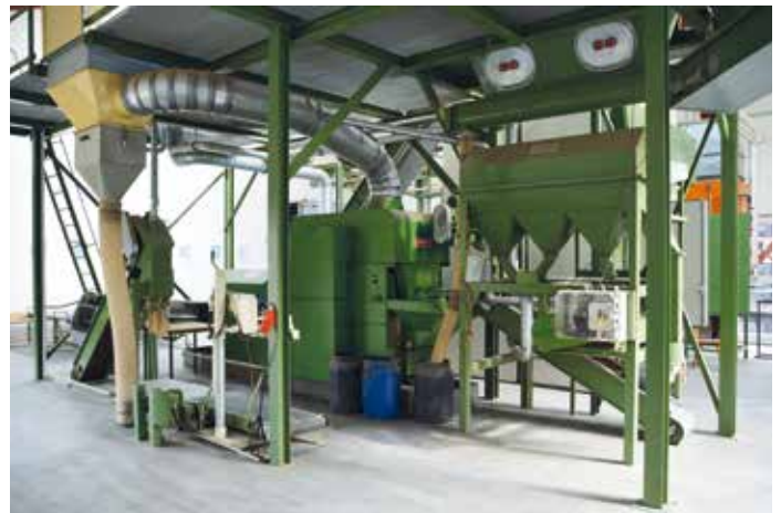
... und anschließend durch ein spezielles System geschleust, wo sie extrahiert und gereinigt werden.

den, die Vegetationszeiten fangen unterschiedlich an. Bäume, die aus diesen Gebieten kommen, haben sich über viele, viele Generationen angepasst.“