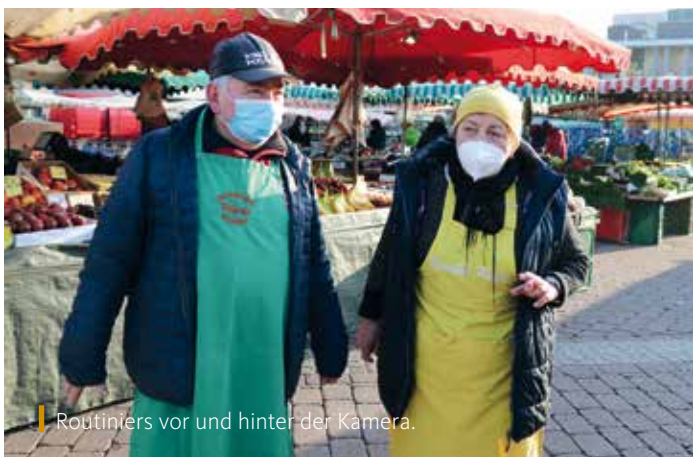
Routiniers vor und hinter der Kamera.