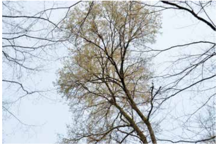
Die Flatterulmen im Hanauer Wald blühen bereits in voller Pracht. Von den knapp 100, die dort stehen, sollen spätestens im Mai 20 beerntet werden.

in diesem Jahr mit dem Bau einer neuen, dann der wohl modernsten Darre weltweit begonnen. 20 auf 30 Meter soll die Samenproduktionsanlage groß werden, gibt Volk einen Einblick. „Die Nachfrage überrennt uns gerade“, macht er deutlich. Wegen der kolossalen Waldschäden sei der Bedarf an Saatgut enorm groß geworden. „Nur kommen wir hier aktuell nicht mehr nach.“