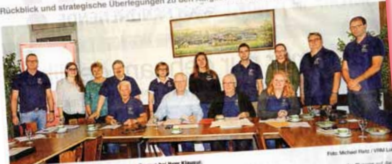
Vorstand und Mitarbeiter des Sportkreises Rheingau-Taunus bei ihrer Klausurtagung.

Rückblick und strategische Überlegungen zu den Aufgaben des kommenden Jahres definiert