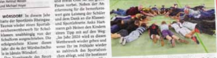
Die Kinder der Klasse 4a haben für ihre Güten den Begriff „Sportkreis“ auf ihre Weise dargestellt. Die Klasse 4a der Würsbachschule in Wörsdorf hat den ersten Platz im Sportabzeichenwettbewerb 2019 errungen. Die Kinder haben sich sehr an der Vorbereitung beteiligt und haben ihre Güten mit viel Fleiß erarbeitet. Die Lehrerinnen und Lehrer gratulieren den Kindern zu diesem Erfolg.

Klasse 4a der Würsbachschule in Wörsdorf wird Sieger des kreisweiten Sportabzeichenwettbewerbs 2019