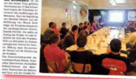
Teilnehmer der Informationsveranstaltung des Sportkreises Rheingau-Taunus zu Gemeinschaftsprojekten.

Informationsveranstaltung des Sportkreises Rheingau-Taunus zu Gemeinschaftsprojekten