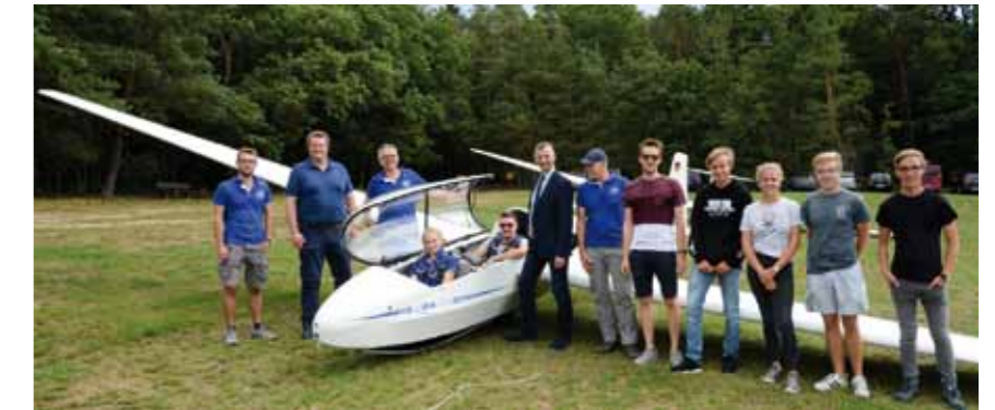
Segelfliegen bei den Flugsportlern in Aarbergen – zu Gast auch Landrat Frank Kilian (7.v.r.).

zeigen, insbesondere auch Sportarten, die nicht immer im Rampenlicht stehen. Viele Vereine hatten sich an den Tagen zu Präsentationen zusammengeschlossen, eine Gemeinschaft erfahren und werden diese im „sportlichen Alltag“ nutzen können. Wichtig war natürlich die Öffnung gegenüber der interessierten Bevölkerung mit vielen Mitmachangeboten. Natürlich auch mit der Hoffnung auf Nebeneffekte, wie z. B. der Gewinnung von Vereinsmitgliedern und Ehrenamtlichen zur Erhaltung der Vereine.