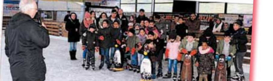
Bad Schwalbach. Wie auch letztes Jahr haben der Sportkreis Rheingau-Taunus mit der Stadt Trebstal und den Maltzer Werken einen Aktionstag für Flüchtlinge organisiert. Nach dem Aktionstag im Januar 2018 ein voller Erfolg war, wollten man sich auch dieses Jahr diesem tollen Start ins neue Jahr nicht nehmen lassen. Ziel war wieder die Eisbahnanlage in Bad Schwalbach, welche für vier Stunden gespart werden konnte und extra zu diesem Anlass reserviert wurde. Insgesamt wurde der Tag zu einem Riesenerfolg – wer sich nicht mit Schlittschuhen auf der Eisfläche befand, konnte sich auf der Eiseckbahn beweisen und