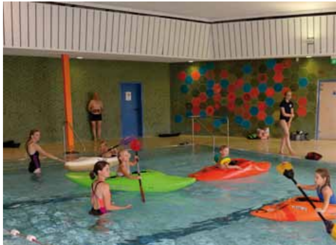
Paddelnachwuchs im Rheingaubad in Geisenheim