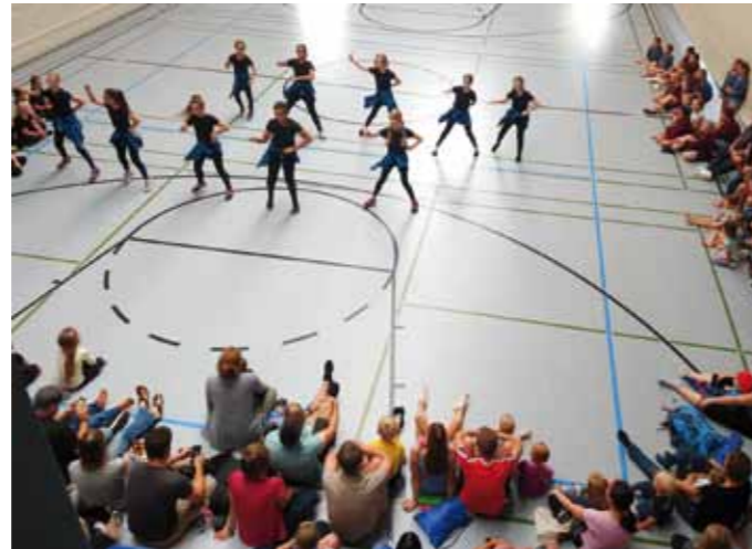
Kooperation Taunussteiner Vereine