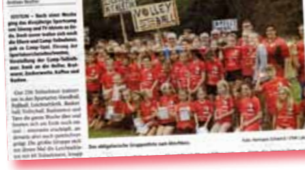
Die Teilnehmer des Sportcamps von TVJ und Söwag haben ein erfolgreiches Abschlussfest gefeiert.

Teilnehmer des Sportcamps von TVJ und Söwag mit großem Abschlussfest