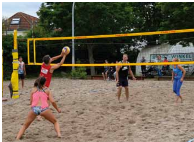
Strandfeeling beim Beachvolleyball in Winkel

stätten mit ganz speziellen und vielfältigen Angeboten. Der Sportkreis arbeitete dabei eng mit Landrat Frank Kilian und dem Rheingau-Taunus-Kreis zusammen. Die Idee wurde im Sportkreisvorstand vor dem Hintergrund geboren, dass täglich Tausende von Menschen ihren Lieblingssport unterstützt von Tausenden Ehrenamtlichen und Trainern betreiben.