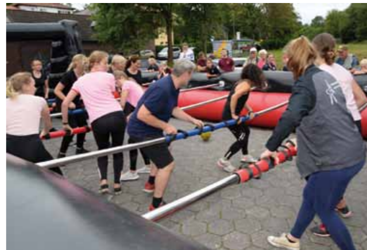
Menschenkicker in Wambach