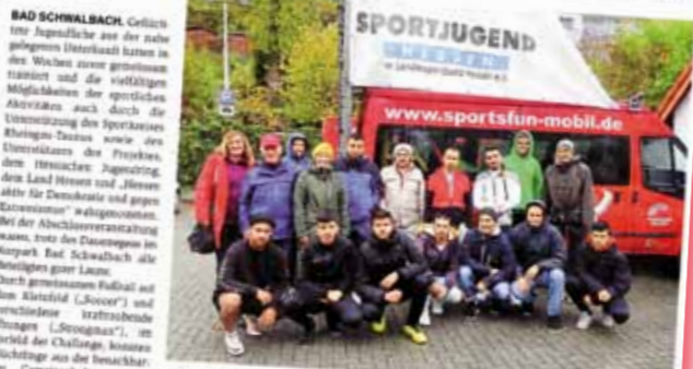
Teilnehmer und Organisatoren der Strongman Challenge im Kurpark Bad Schwalbach.

Sportkreis, Sportjugend und Landkreis mit Strongman-Challenge für Flüchtlinge