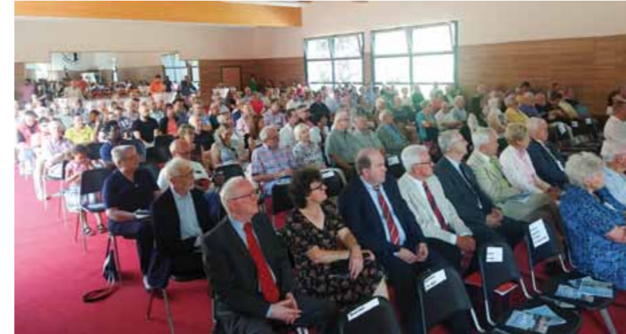
In der voll besetzten, neuen Mike-Schillings-Halle verfolgten zahlreiche Ehrengäste und Vereinsmitglieder mit großer Aufmerksamkeit die Ausführungen der zahlreichen Gratulanten.