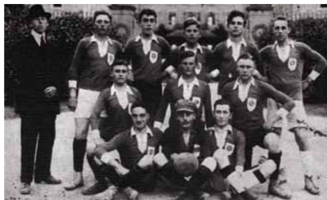
Die Mannschaft des SV Johannisberg im Jahr 1922.

Während im Jahre 1919 die Genehmigung bei der französischen Besatzungsmacht eingeholt werden musste, war diesmal die amerikanische Militärregierung zuständig. Die Genehmigung wurde erteilt und es konnte losgehen. Zu seinem 100. Geburtstag präsentiert sich der SVJ in einer Renaissance und bestens aufgestellt. 256 der aktuell 396 Mitglieder sind