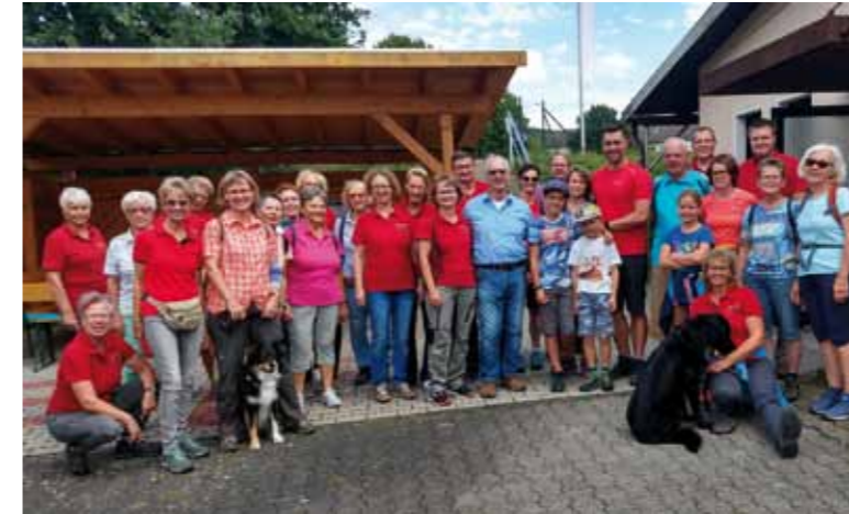
Wandern mit anschließendem Kaffee und Kuchen bei der TG Niedernhausen

zeigen, insbesondere auch Sportarten, die nicht immer im Rampenlicht stehen. Viele Vereine hatten sich an den Tagen zu Präsentationen zusammengeschlossen, eine Gemeinschaft erfahren und werden diese im „sportlichen Alltag“ nutzen können. Wichtig war natürlich die Öffnung gegenüber der interessierten Bevölkerung mit vielen Mitmachangeboten. Natürlich auch mit der Hoffnung auf Nebeneffekte, wie z. B. der Gewinnung von Vereinsmitgliedern und Ehrenamtlichen zur Erhaltung der Vereine.