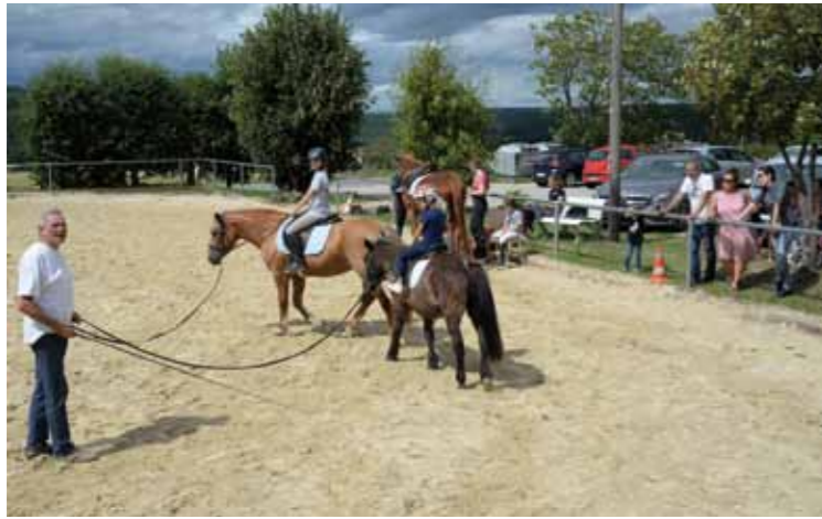
In Panrod liegt das Glück auf dem Rücken der Pferde

Die „Tage des Vereinssports“ mit den zahlreichen rührigen Vereinen und Ehrenamtlichen sollen, wenn es nach den Planungen des Sportkreises geht, eine jährliche feste Größe werden. Dies alles natürlich auch mit Unterstützung aus Politik und Sport. Der „Schirmherr“ der Pilotveranstaltung war der Hessische Minister des Innern und für Sport Peter Beuth. Auch er war an diesen Tagen zu Besuch bei zahlreichen