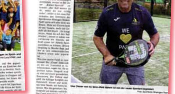
Der TC Idstein hat ein neues Sportgerät, das auf einem Tennisfeld gespielt werden kann. Das Gerät ist ein Taschenformat und kann überall gespielt werden. Die Teilnehmer haben sich sehr an der Einführung beteiligt und haben das Spiel sehr genossen.

Was sich hinter den Namen der Sportart verbirgt, kann TC Idstein kann gerätartig gespielt werden