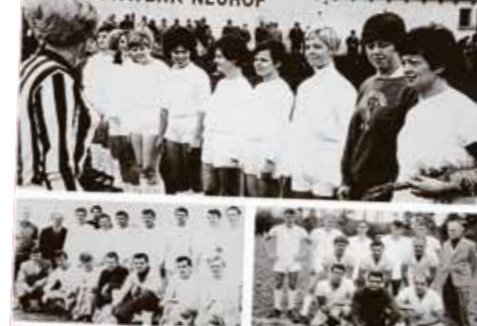
Die Sportvereinigung Neuhof hat einen neuen Platz und eine Fußballabteilung erhalten. Die Mitglieder sind sehr stolz auf diese Errungnisse und hoffen, dass dies ein Anreiz für die Vereine sein wird, um ihre Sportangebote zu erweitern.

Sportvereinigung Neuhof feiert den neuen Platz und ihre Fußballabteilung