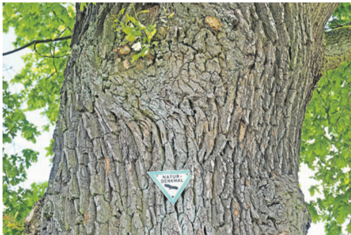
Naturdenkmal von Rosbach.

Rosbach. Bei tollem Radelwetter ging es im Rahmen „Rosbach rollt“ am 30.05.2021 mit dem Bund für Umwelt und Naturschutz Deutschland (BUND), Ortsverband Rosbach auf einen 23 Kilometer langen Rundkurs durch die Stadtteile von Rosbach. Auf der zirka dreistündigen Tour, an der 26 Radler auf drei Corona-konforme Gruppen aufgeteilt teilnahmen, ging es zu den beeindruckenden Naturdenkmälern in Form von Eichen, Speierlingen und Linden in der Gemeinde Rosbach. Auch Geschichtliches konnten die Teilnehmenden erfahren, zum Beispiel, dass Rosbach ein Galgenplatz an der Weinstraße Richtung Löwenhof hatte und wo der Judenfriedhof war. Immer wieder hielt man auch an Biotopen und Streuobstwiesen und konnte sich über die Besonderheiten informie-