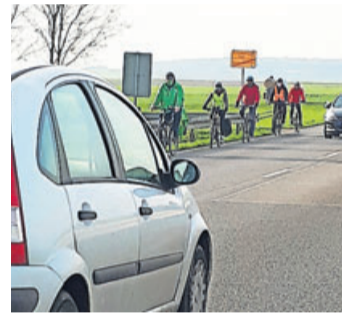
Radlergruppe auf der B 275.

Wetteraukreis. Die Wetterauer GRÜNEN haben beim diesjährigen Stadtradeln des Wetteraukreises den ersten Platz belegt. Sie sind mit insgesamt 104 Teilnehmer*innen stolze 19930 Kilometer gefahren. Das waren die meisten Radler*innen und die meisten Kilometer. Der Grüne Kreistagsabgeordnete Gerhard Salz, der als Team-Captain fungierte dazu: „Ich bin echt überwältigt von diesem Ergebnis. Das waren mehr als das Doppelte der vergangenen Jahr und deutlich mehr als das Dreifache der Kilometer aus 2020. Das ist praktischer Klimaschutz!“ Das Grüne Team hat durch seine Teilnahme insgesamt 2930 Kilogramm weniger CO2 in die Luft geblasen gegenüber Fahrten mit einem Auto mit Verbrennungsmotor. Von den 15 Kreistagsabgeordneten sind 9 mitgefahren. Die erfolgreichsten Radler Grünen Team waren dieses Jahr: Dr. Patrick Kaurisch (1491 km), Regina Kaurisch (1303 km)(beide aus Bad Nauheim), Ulrich Rode (1085 km) aus Friedberg und Ute Hauck (1066 km) aus Florstadt.