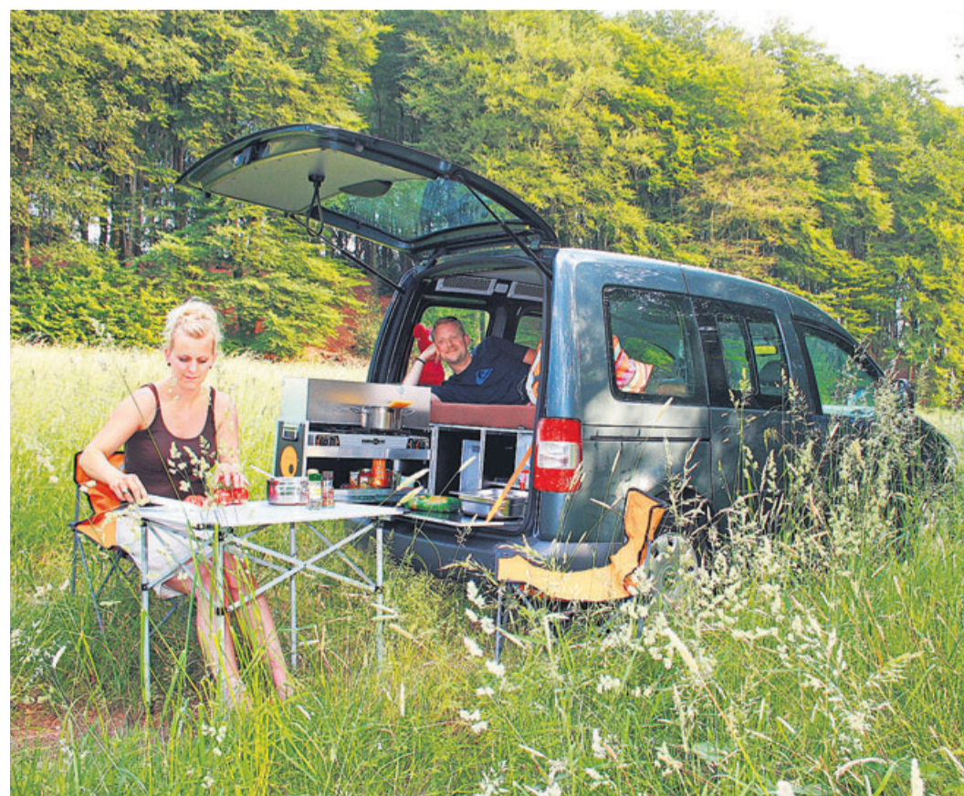
Campingvergnügen muss nicht teuer sein.

dem Urlaub sofort wieder zur alltäglichen Nutzung bereit. Die robuste Box wird einfach aus dem Kofferraum genommen und wartet in Garage oder Keller auf den nächsten Einsatz. Ein Modul passt in rund 35 verschiedene Hochdachkombis, ein anderes in über 60 Busse und Transporter. Unter www.ququq.info finden sich Listen aller passenden Fahrzeugmodelle zum Downloaden, darunter auch Ausführungen für Geländewagen.