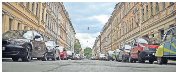
Steht das Auto - auch durch Corona bedingt - lange still, kann sich Flugrost auf den Bremscheiben bilden.

Vorsicht bei Fahrt nach längerer Standzeit