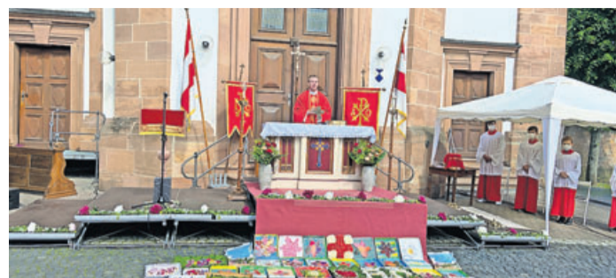
Auf dem Kirchplatz wurde gemeinsam Gottesdienst gefeiert.

Bad Soden-Salmünster. Mitte Juni wurde in St. Peter und Paul der Blutsonntag, der gelobte Tag, gefeiert. Bei herrlichem Sonnenschein wurde sich auf dem Kirchplatz von Salmünster versammelt, um miteinander Gottesdienst zu feiern.