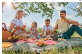
Eine Reise auf der Picknickdecke in die Schweiz.

Alles, was wir brauchen, ist eine Picknickdecke, Familie oder gute Freunde und einen schönen Platz unter freiem Himmel. Auf einer großen Wiese oder in der Nähe eines plätschernden Baches – ein wenig