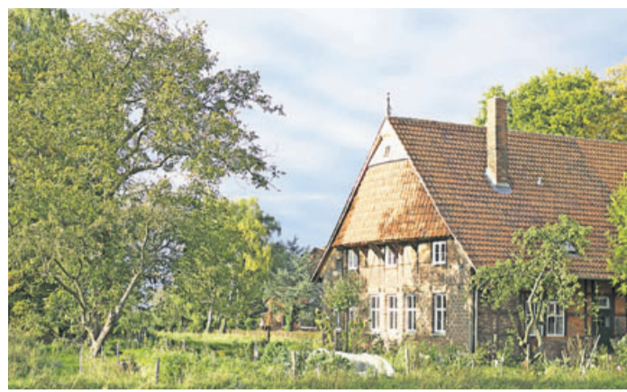
Das Erbbaurecht erlischt nach 100 Jahren: Aus finanziellen Gründen ist es sinnvoll, sich davor über das Auslaufen des Vertrags Gedanken zu machen.