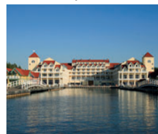
Precise Resort Hafendorf Rheinsberg

landschaft. Einige besitzen einen eigenen Jachthafen und direkten Zugang zum Wasser. Die Precise Resorts liegen an der Mecklenburgischen Seenplatte, im Haveland, auf Rügen und eine Stunde von Sevilla entfernt an der Costa de la Luz. In exklusiven Resorts und den schönsten Feriengemeinden Deutschlands und Andalusiens wird der Sommer also garantiert zur besten Zeit des Jahres.