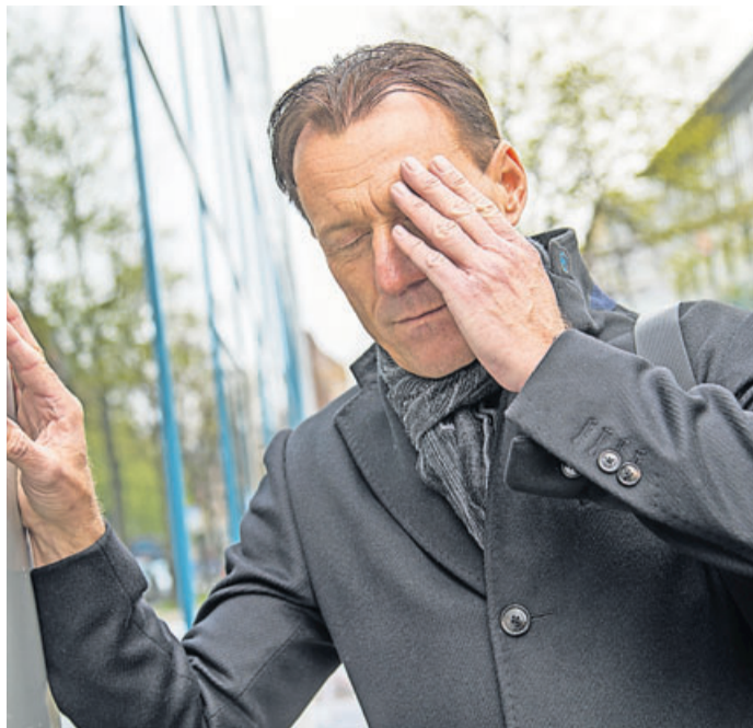
Schwindelanfälle können auch psychische Ursachen haben.

„Die Vermeidungshaltung führt dazu, dass Betroffene immer mehr in sich hineinhorchen und noch unsicherer werden“, sagt Lahmann, der