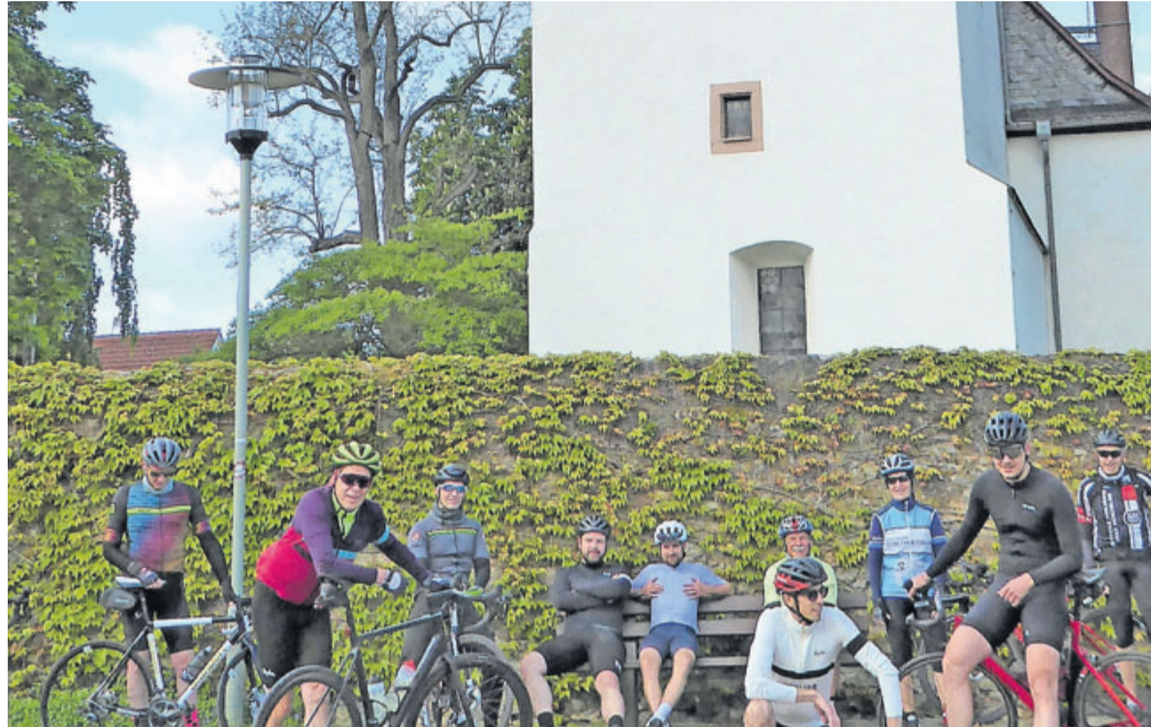
Die gefahrenen Kilometer vom letzten Jahr wurden fast verdoppelt, immer mehr Menschen sorgen sich ums Klima.