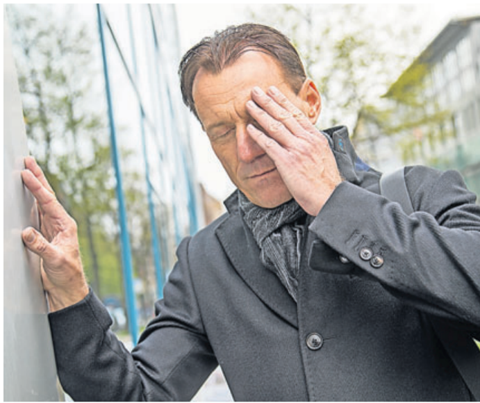
Schwindelanfälle können auch psychische Ursachen haben.