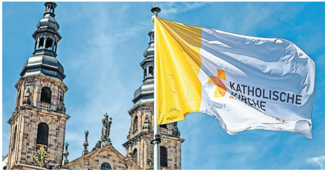
Die Verwaltung des Bistums hat bestehende Strukturen komplett überprüft und effizient weiterentwickelt.

Fulda. Aufbruch in die Zukunft: Das Bischöfliche Generalvikariat in Fulda startet mit einer neuen, zeitgemäßen und zukunftsorientierten Organisationsform. Die Verwaltung des Bistums hat bestehende Strukturen komplett überprüft und effizient weiterentwickelt. Der Kernauftrag bleibt, die Menschen und die Gesellschaft haben sich verändert – und mit ihnen auch die Organisationsstruktur des Bischöflichen Generalvikariates. Das Ziel: Die Menschen von heute neu mit der frohen Botschaft in Verbindung zu bringen, die zahlreichen engagierten Akteure im Bistum Fulda dabei bestmöglich zu unterstützen und die Organisation zukunftsfähig zu machen für die zahlreichen Herausforderungen einer modernen Gesellschaft. Dafür musste die neue Kirchenverwaltung auf der Basis ihrer langjährigen Praxis und vor dem Hintergrund geringer werdender Ressourcen, Haushaltsmitteln und wachsender Aufgaben optimiert und für kommende Zeiten steuerfähiger als bisher gemacht werden. Bischof Dr. Michael Gerber lobte den Prozess und das Ergebnis. Er dankte allen Beteiligten für ihr Engagement und zeigte Respekt vor dem Erreichten. „Der Umbau im be-