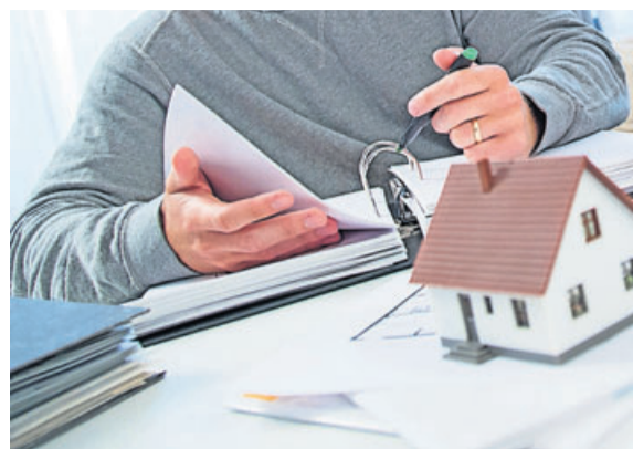
Ordnung ist das halbe Bauherren-Leben: Immobilienbesitzer müssen nachweisen können, dass ihr Haus ordnungsgemäß genehmigt wurde.

Eigentümer muss Baugenehmigung nachweisen können