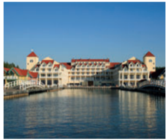
Precise Resort Hafendorf Rhensberg

landschaft. Einige besitzen einen eigenen Jachthafen und direkten Zugang zum Wasser. Die Precise Resorts liegen an der Mecklenburgischen Seenplatte, im Havel-land, auf Rügen und eine Stunde von Sevilla entfernt an der Costa de la Luz. In exklusiven Resorts und den schönsten Feriengebieten Deutschlands und Andalusiens wird der Sommer also garantiert zur besten Zeit des Jahres.