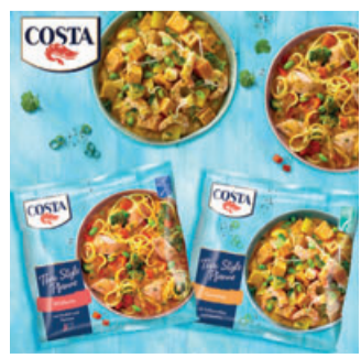
COSTA Meeresspezialitäten GmbH & Co. KG, Stedinger Strasse 25, 26723 Emden

Thai Style Pfanne Garnelen oder Wildlachs – für mehr Abwechslung In Zeiten von Homeoffice, Home-schooling, geschlossenen Restaurants und Kantinen sind Tiefkühlfertig-gerichte in vielen Haushalten wichtiger Bestandteil einer guten Ernährung im Alltag. Und wer oft zu Hause isst, braucht natürlich auch neue Rezeptideen. COSTA Meeresspezialitäten hat sich von den Länderküchen dieser Welt inspirieren lassen und Pfannengerichte für noch mehr Abwechslung entwickelt. Die Thai Style Pfanne Garnelen mit ASC-zertifizierten Garnelen, Süßkartoffeln, gelber Thai-Curry-Sauce und knackigem Gemüse begeistert alle Liebhaber der asiatischen Küche. Bei der Thai Style Pfanne Wildlachs verspricht die Kombination von MSC-zertifiziertem Wildlachs, Mie-Nudeln, roter Curry-Sauce und asiatischem Gemüse ein besonderes, mit Fernweh gewürztes Geschmackserlebnis. Wie bei allen Meeresprodukten von COSTA wird auch hier die QUALITÄT großgeschrieben. Und das spiegelt sich