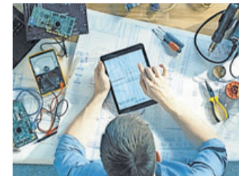
Eindeutige Männerdomäne: MINT-Berufe.

Egal ob Elektrikerin, Maschinenbau-Ingenieurin oder Software-Entwicklerin - Frauen sind in den MINT-Berufen immer noch eine Seltenheit. Dass naturwissenschaftliche und technische Berufe auch heute noch Männerdomänen sind, zeigt eine aktuelle Studie. Die Auswertung ergab, dass 99 Prozent der Bewerbungen für Elektriker-Jobs von Männern kommen, bei Ingenieursstellen sind es mehr als 90 Prozent. Auch der IT-Bereich ist immer noch männlich geprägt: Rund acht von