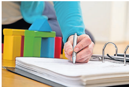
Wer als Bauherr eine Firma beauftragt, hat einen Anspruch auf eine umfassende Baubeschreibung.

Viele Bauherren entscheiden sich bei dem Bau ihrer Immobilie für eine Zusammenarbeit mit einem Schlüsselanbieter oder Bauträger. Seit 2018 gilt: Bauherren haben hier einen Anspruch auf eine umfassende Baubeschreibung. Laut Bauvertragsrecht muss diese unter anderem Angaben über die wesent-