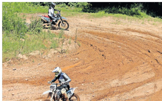
Teile vom Streckenverlauf, die Motocross Fahrer beim Training und im Fahrerlager sowie Luftsprünge auf der Rennstrecke in Mernes im Spessart.

Motocross Fahrer auf der Rennstrecke in Mernes