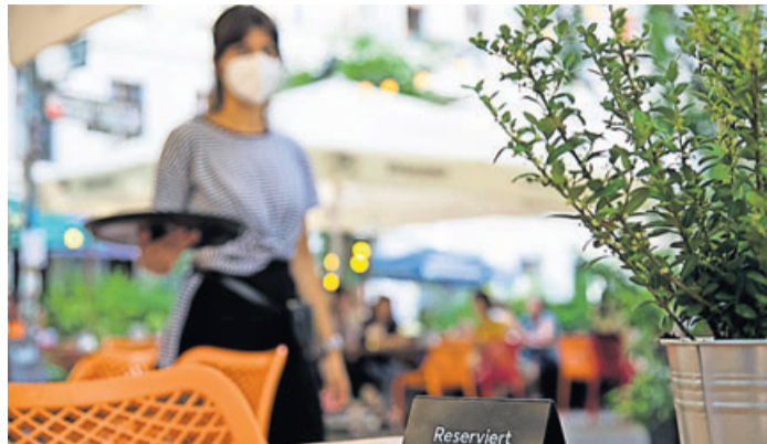
Servicekraft händeringend gesucht: Viele Hotels und Gaststätten finden aktuell kein Personal – weil während der Lockdowns ein großer Teil der Beschäftigten die Branche verlassen hat. Die Gewerkschaft NGG fordert, die Arbeit im Gastgewerbe attraktiver zu machen.