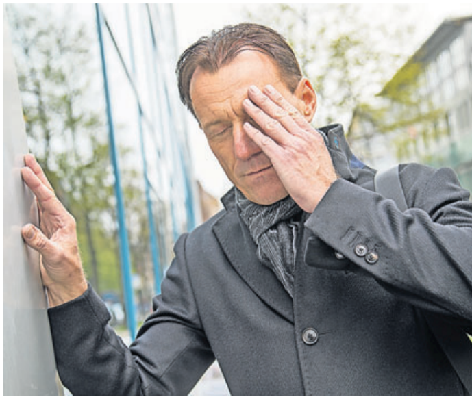
Schwindelanfälle können auch psychische Ursachen haben.