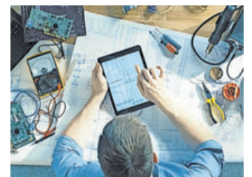
Eindeutige Männerdomäne: MINT-Berufe.

Egal ob Elektrikerin, Maschinenbau-Ingenieurin oder Software-Entwicklerin - Frauen sind in den MINT-Berufen immer noch eine Seltenheit. Dass naturwissenschaftliche und technische Berufe auch heute noch Männerdomänen sind, zeigt eine aktuelle Studie. Die Auswertung ergab, dass 99 Prozent der Bewerbungen für Elektriker-Jobs von Männern kommen, bei Ingenieursstellen sind es mehr als 90 Prozent. Auch der IT-Bereich ist immer noch männlich geprägt: Rund acht von