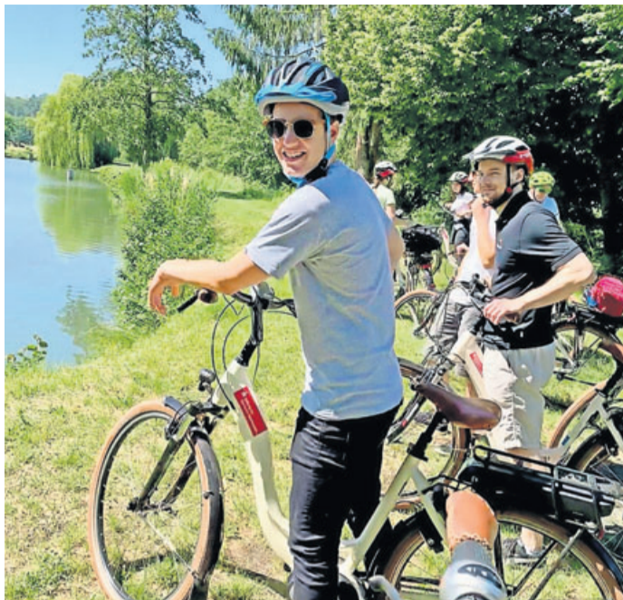
So könnte es bei den Touren aussehen.

Da auch bei Radveranstaltungen die vorgeschriebenen Hy-