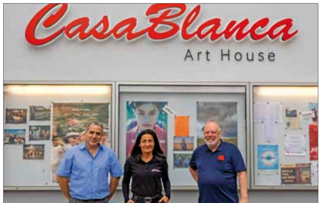
Die KULT Kinobar ist nun das „neue alte“ CasaBlanca Art House Bad Soden.

Dolby Surround Stereo Sound, ausgestattet mit bequemen Zweier-Sesseln, modernisierter Bar mit Theke, Barhockern und Tischen – das gibt es nur im zentralen „CasaBlanca“ in Bad Soden. Besonders erwähnenswert ist die Corona-gemäße Belüftung auf neuestem Stand der Technik. Von dem hervorragenden Bild und der ausgezeichneten Akustik konnten sich die Zuschauer auf ihren Plätzen an dem Abend selbst überzeugen, als das Licht langsam gedimmt wurde und der gleichnamige, weltbekannte Filmklassiker mit Ingrid