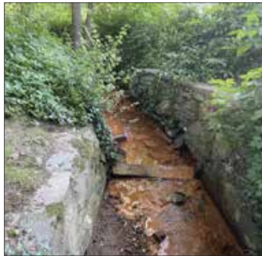
Sieht ungewöhnlich aus – ist aber unbedenklich: rotbraun gefärbtes Wasser im Bach.

Hierbei handelt es sich um Lebensmittelfarbe, womit das städtische Kanalwerk Fehlan schlüsse lokalisieren kann.