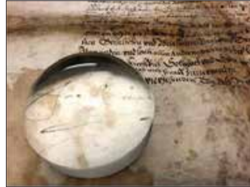
Unter der Lupe ist die Originalunterschrift des Kaisers zu sehen.

Bad Soden (bs) – Ab sofort kann im Stadtmuseum eine Urkunde des deutschen Kaisers Ferdinand II. (1578-1637) bewundert werden. Handschriftlich bestätigte er in Regensburg die besondere Stellung der beiden Taunusorte Sulzbach und Soden als Reichsdörfer, die somit keiner unmittelbaren Landesherrschaft, sondern dem Kaiser direkt unterstellt waren. Die Urkunde konnte von der Stadt Bad Soden