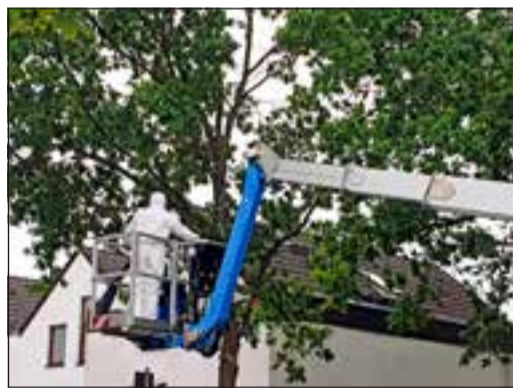
Maßnahme gegen Befall mit Eichenprozessionsspinnern

Insgesamt verfolgt die Gemeinde das Ziel, möglichst schnell und flächendeckend Abhilfe gegen den Befall zu schaffen – auch deshalb, weil die eingeleiteten Maßnahmen allergische Reaktionen, die durch herumfliegenden Brennhaare der Raupe bisweilen ausgelöst werden, entscheidend eindämmen.