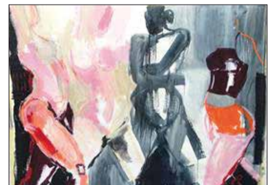
Ohne Titel

Höchstbesucherzahl noch nicht erreicht ist. Ein Formular zur Kontaktnachverfolgung muss vor Ort ausgefüllt werden. Es gilt Masken- sowie Abstandspflicht.