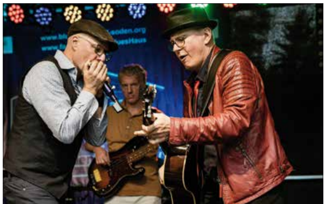
BluesHaus at its best!

Bad Soden (bs) – Das BluesHaus Bad Soden e.V. freut sich, die Bluesmusik wieder zurück auf die Bühnen seiner Heimatstadt zu bringen. Los ging es bereits am Donnerstag, den 24. Juni mit einer akustischen Open Air-Session am neuen festen Domizil des Vereins in der Kahlbachquelle (Kirchstraße 31, 65812 Bad Soden-Altenhain). Die Lokalität ist vielen auch als Gelände der TSG Altenhain 1900 e.V., mit der das BluesHaus zukünftig kooperiert, bekannt. Ab jetzt wird dort jeden Donnerstag zum Jam geladen. Alles unter dem Motto „everybody is welcome“ – sowohl auf als auch vor der vom BluesHaus neu errichteten Bühne und in den von beiden Vereinen neu gestalteten Räumlichkeiten. Es folgen eine Reihe von Konzerten im Rahmen des „Musiksommer am Medico Palais“, deren musikalische Gestaltung das BluesHaus