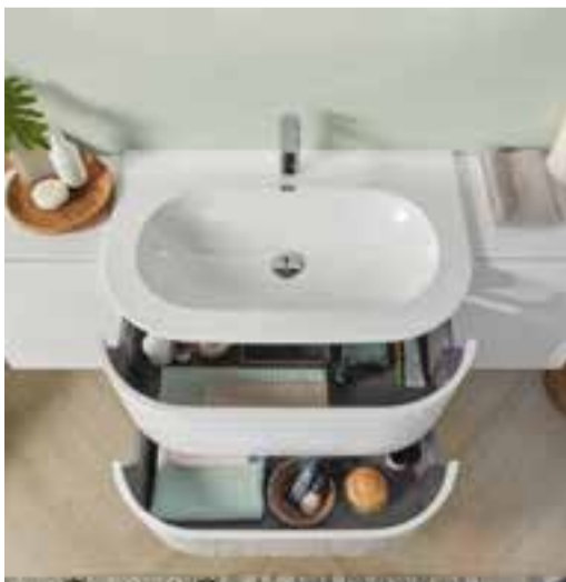
Waschtisch und Unterschrank der 4balance Kollektion bilden das Herzstück des Bades und wirken dank ihrer ovalen Formgebung besonders zeitlos und edel.

(epr) Für ein ausbalanciertes Wohlfühlambiente im Badezimmer hat Sanipa das neue Systemprogramm 4balance entwickelt: Durch die Fokussierung auf geometrische Grundformen wie Oval, Kreis und Quader lassen sich die Möbel und Waschtische der neuen Trendlinie durch individuelle Kombinationsmöglichkeiten zu echten Hinguckern arrangieren. Während der ovale Waschtisch und Unterschrank eine zeitlose, schlichte Eleganz ausstrahlen, bilden die quaderförmigen Anbauschränke der Serie eine optimale Ergänzung für mehr Stauraum. Eine optionale LED-Beleuchtung, die sich in Farbe und Helligkeit flexibel regulieren lässt, setzt die Kollektion stimmungsvoll in Szene. Komplettiert wird das formstarke Wohlfühl-Design durch Lichtspiegel Luna sowie einen der beiden ebenfalls mit LEDs ausgestatteten Spiegelschränke der Serie Reflection. Mehr Infos unter www.sanipa.de sowie www.homeplaza.de .