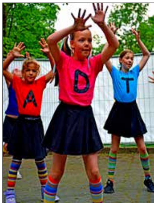
Die „Dancing Cookies“ mit ihrem ersten Auftritt nach langer Zeit.

Die Kulturförderpreis-Jury überzeugte beim Frauen- und Popchor der Ev. Kirchengemeinde Bad Soden die gute und schnelle Entwicklung in so kurzer Zeit und das große Engagement aller Beteiligten. Die beiden Chöre entstanden 2017 aus einem dreimonatigen Projektchor, der sich so großer Resonanz und Begeisterung erfreute, dass sich die zwei Chöre daraus bildeten. Auch hier war man während der Pandemie kreativ, probte per Zoom und fügte Einzelstimmen per Video zu einem Chor zusammen, der die Online-Got-