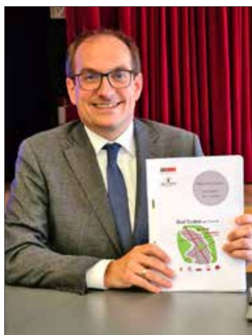
Bürgermeister Dr. Frank Blasch mit dem Mobilitätskonzept.

Die Stadt ist aufgrund ihres vielfältigen Angebots an Einrichtungen und Freiräumen lebendig und lebenswert. Allen Altersklassen ist eine Teilhabe am Verkehrssystem ohne Barrieren möglich, da die Infrastruktur an den Sicherheitsbedürfnissen besonders schutzbedürftiger Verkehrsteilnehmer bemessen wird. Wichtige Ziele innerhalb und außerhalb der Stadt sind für alle Verkehrssysteme direkt, attraktiv und verkehrssicher vernetzt, weswegen auch ein Leben ohne eigenen Pkw ohne Einschränkungen möglich wäre. Die negativen Umweltwirkungen des Verkehrs werden durch neue Technologien und veränderte Verhaltensweisen minimiert. Die Weiterentwicklung des Mobilitätssystems wird als Gemeinschaftsaufgabe aller Bürgerinnen und Bürger mit Politik und Verwaltung verstanden“, so der Bürgermeister abschließend.