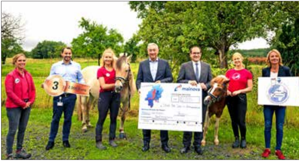
Für alle Beteiligten stand an diesem Tag die gemeinnützige Arbeit im Vordergrund.