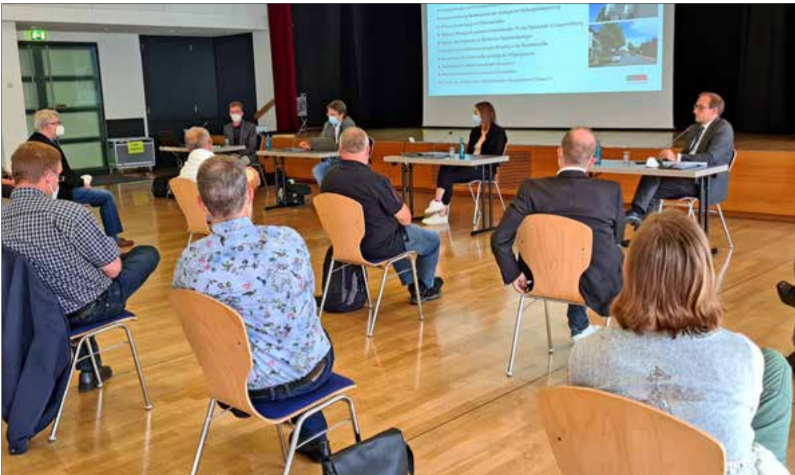
Bürgermeister Dr. Frank Blasch und die Verantwortlichen der Planungsgesellschaft PTV GmbH bei der öffentlichen Vorstellung des neuen Mobilitätskonzepts im Bürgersaal Neuenhain.

Bad Soden (bs) – Bürgermeister Dr. Frank Blasch stellte dieser Tage gemeinsam mit den Projektverantwortlichen der PTV Transport Consult GmbH interessierten Bürgerinnen und Bürgern das 169 Seiten starke Mobilitätskonzept der Stadt im Bürgerhaus Neuenhain vor. Die Präsentation des Rahmenplans für die künftige Verkehrs- und Mobilitätsplanung bildete den Abschluss der zweijährigen Erarbeitungsphase. Der Auftaktveranstaltung im Februar 2019 waren zwei weitere Veranstaltungen unter aktiver Mitarbeit der Bürger gefolgt. „Das Mobilitätskonzept Bad Soden am Taunus ist als Leitfaden zu verstehen, das der Stadt den Rahmen für die strategische Mobilitätsplanung bis 2035 vorgibt. Das Konzept wird nunmehr dem Magistrat und dann der Stadtverordnetenversammlung vorgestellt. Danach können es alle Bürgerinnen und Bürgern auf unserer Webseite einse-