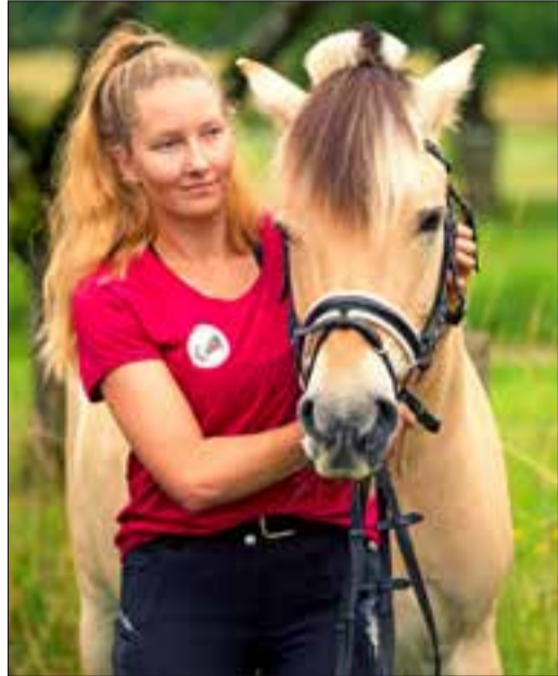
Therapeutin und Pferd: Ein eingespieltes Team.

Nach Reinigung, Desinfektion und drei Tage freiem Auslauf der Quelle, wird eine Nachprobe veranlasst. Sollte die Quelle dann wieder keimfrei sein – kann sie wieder freigegeben werden.