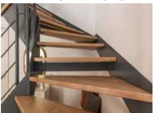
Schön, schöner, Longlife: Das innovative Stufenmaterial ist in der 39-mm-Variante ideal für den Stufentausch geeignet.

ein Stufentausch, um die alte Treppe optisch aufzufrischen und wieder sicher begehbar zu machen. Als Stufenmaterial bietet sich Longlife von Treppenprofi Kenngott an: Es ist in zwei unterschiedlichen Stärken verfügbar, wobei die schlanke 39-mm-Variante ideal für den Stufentausch geeignet ist. Denn viele alte Massivholzstufen sind 40 mm stark und können dank 1:1-Nachfertigung schnell und einfach ersetzt werden. Gerade im Vergleich zu Holz kann Longlife richtig punkten. Es dunkelt nicht nach, bleicht nicht aus und ist außerdem so stabil und wertbeständig, dass viel weniger Gebrauchsspuren auftreten. Das innovative Stufenmaterial, das in der 39-mm-Version auch gerne als Belag für Betonläufe zum Einsatz kommt, wird in attraktiven Dekoren angeboten, darunter auch – ganz neu im Sortiment – Wildeiche mit honigfarbenem Touch. Weiteres Longlife-Plus: Die strukturierte, haptisch angenehme Oberfläche wurde nach der Rutschsicherheitsklasse R9 zertifiziert und beugt gefährlichen Stürzen vor, selbst wenn man barfuß oder „strümpfig“ unterwegs ist. Mehr Infos gibt es unter www.kenngott-epr.de und www.home-plaza.de .