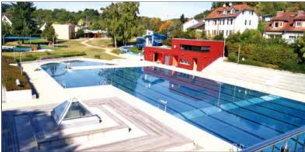
Rote Absperrbänder sorgen für einen coronagefähigen Besucherfluss. Unabhängig davon ist Badespaß ohne Einschränkung möglich.

Bad Soden (bs) – Die hessischen Sommerferien sind angebrochen und nach den Corona-Beschränkungen und einer anstrengenden Homeschooling-Phase freuen sich Schülerinnen und Schüler, aber auch Eltern, auf sechs wohlverdiente Ferienwochen. Das FreiBadSoden bietet im wunderschönen Ambiente des Altenhainer Tals jede Menge Spaß und Abwechslung – perfekt für den Urlaub zu Hause. Mit einer stabilen Wassertemperatur von 25 Grad Celsius kann man sich hier bei Hitze abkühlen, aber auch noch bei etwas kühleren Außentemperaturen angenehm schwimmen.