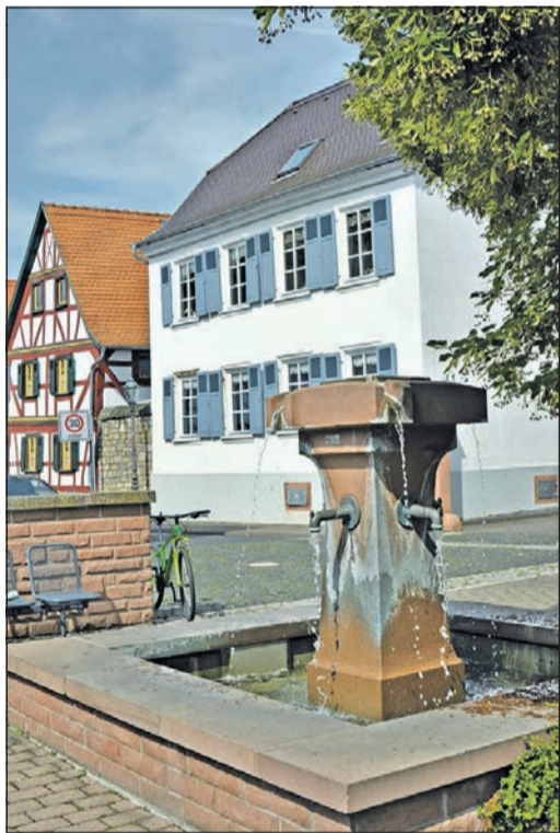
Ein Brunnen plätschert im Ortskern von Alt-Dortelweil direkt neben der Dorflinde.

sack: ein bisschen Proviant, eine große Flasche Wasser, Kamera oder Handy, um Fotos zu machen, Sonnencreme und unbedingt ein Fernglas. Wer möchte, nimmt noch die Niddaroute-Karte des Regionalparks Rhein-Main mit. Verfahren aber ist auch ohne Plan fast unmöglich. Der Weg ist bestens ausgeschildert. Einige hundert Meter radeln wir zunächst gen Süden entlang der renaturierten Nidda und be-