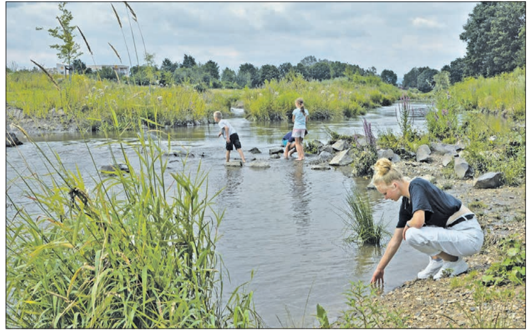
Erfrischung verspricht an heißen Tagen ein Bad in der Nidda, die im Bereich der Stadt Karben an vielen Stellen leicht zu erreichen ist. Hier können Füße gekühlt, Staudämme gebaut und vielerlei Tiere entdeckt werden.

Außerdem können die Boule-Kugeln ausgepackt werden. Eine neue Boule-Bahn lädt zum Spiel ein. Nach dieser kurzen Erfrischung geht es weiter Richtung Bad Vilbel, vorbei an grasenden Kühen, einer mächtigen Schafherde, einem Schwanenpaar mit Jungtieren bis zum nächsten Punkt, der in der Nähe des Gronauer Hofes zum Verschnaufen einlädt: ein begehrtes Vogelnest aus Robinien-Rundhölzern mit einem Durchmesser von drei Metern. Von diesem überdimensionalen Nest oder den ebenfalls zum Entspannen einladenden Holzliegen aus bietet sich ein toller Blick auf die Flussau. Am Himmel kreisen eine Handvoll Störche, an der Wasserstelle stehen steif und majestätisch einige Graureiher. Zeit, einen Blick durch das Fernglas zu werfen. Wieder rauf aus Rad und weiter in die Pedale getreten. Vorbei an goldgelben Sonnenblumen und stolzen Pferden, die einen Blick auf vorbeiziehende Radfahrer, Skater und Spaziergänger riskieren, führt die Niddaroute bei Gronau nun über eine kleine Brücke, unter der Nidda und Nidder zusammenfließen. Der Weg knickt scharf nach rechts ab, und unter schattigen Bäumen lassen wir uns gemütlich am Ufer der Nidda weiterrollen, beobachten Angler und hier und da mal einen Kormoran, der