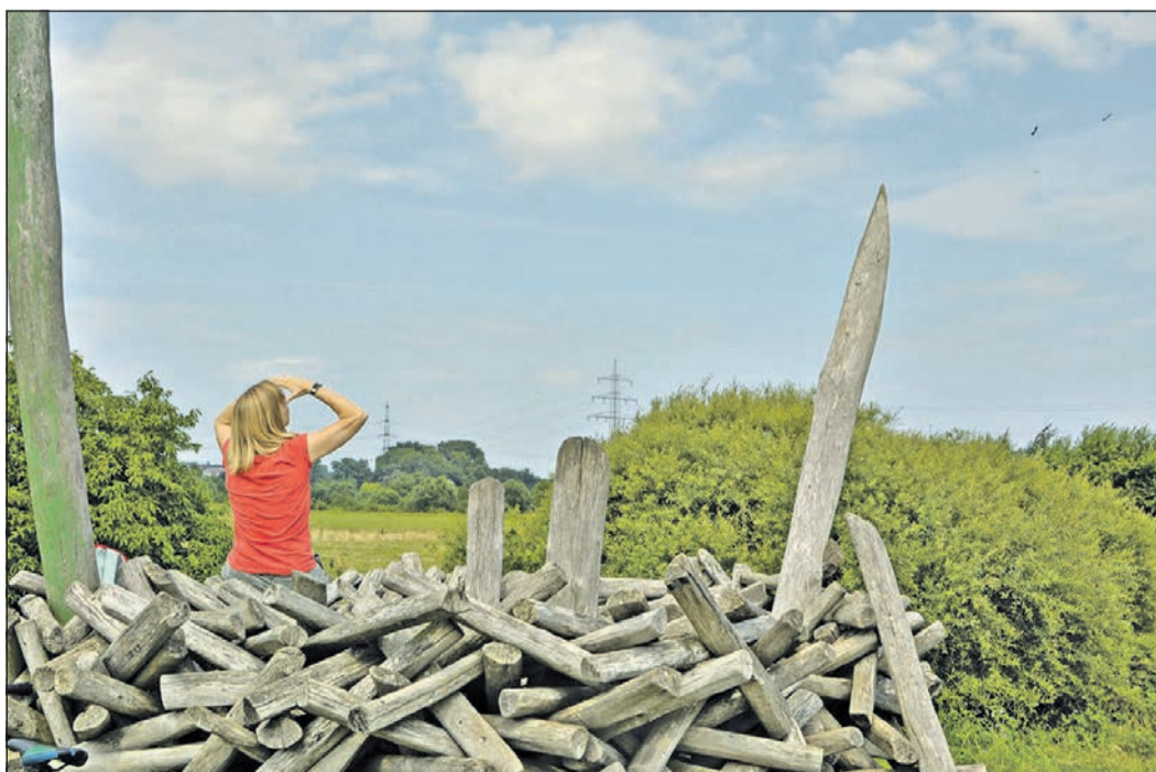
Kurze Pause am Erlebnispunkt in der Nähe von Gronau: Ein begehrtes Vogelnest aus Robinien-Rundhölzern mit einem Durchmesser von drei Metern prägt die Anlage am Niddaradweg. Von hier aus lassen sich wunderbar Vögel beobachten.

Der Sport- und Spielplatz in Dortelweil liegt direkt im Niddabogen, Untergasse. Der Dottenfelderhof, nördlich von Bad Vilbel gelegen, ist montags bis samstags von 8 bis 19 Uhr, samstags nur bis 18 Uhr, geöffnet. Sonntag und feiertags bleibt der Hof für Besucher ge-