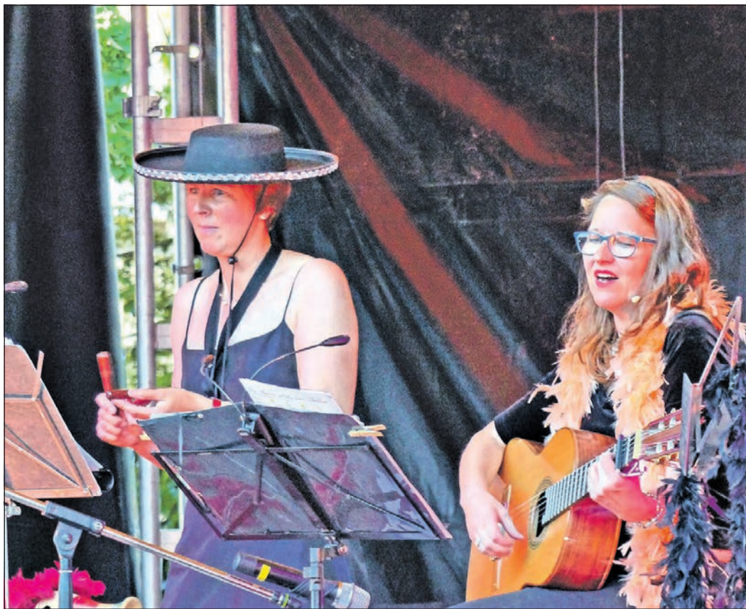
Die „Stolzesten Frau'n“ begeistern beim Chansonabend in Schwalbach im Rahmen der Kulturreihe „Summer in the City“.