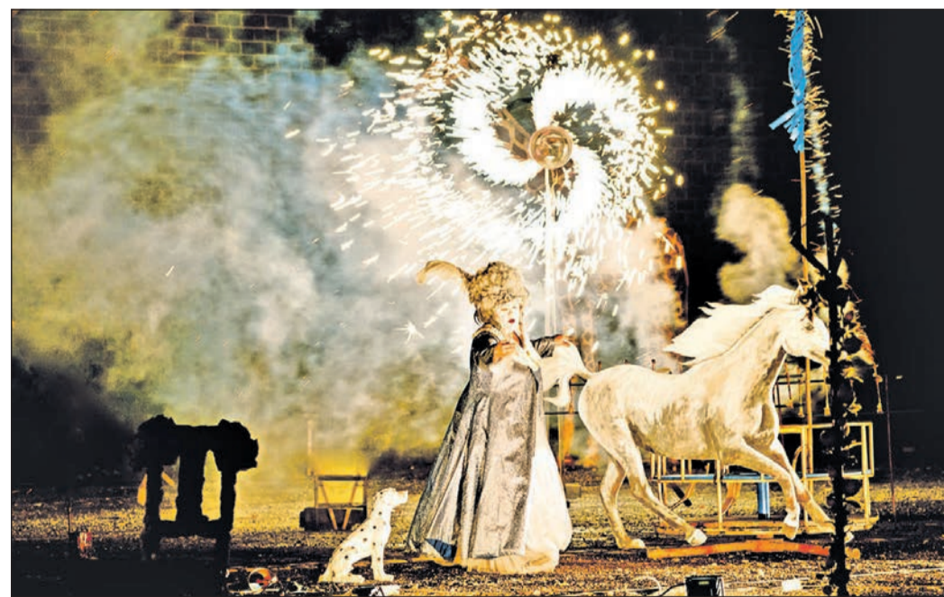
Die Pyromantiker Berlin zaubern mit ihrem Open-Air-Spektakel „Versailles reloaded“ einzigartige Feuerbilder.

Schwalbach (sbw). Auch in der Ferienzeit bietet Bürgermeister Alexander Immisch eine Präsenz-Bürgersprechstunde im Rathaus an. Am Mittwoch, 11. August, sind alle Schwalbacher, die ein Anliegen haben, sehr herzlich eingeladen, diese Sprechstunde zu besuchen. Sie findet von 16 bis 18 Uhr im Rathaus, Raum 100, statt. Um längere Wartezeiten zu vermeiden, wird um eine Anmeldung unter Telefon 06196-804102 gebeten. Dabei ist es weiterhin nötig, beim Betreten des Rathauses eine Mund-Nasen-Bedeckung anzulegen und das Abstandsgebot einzuhalten.