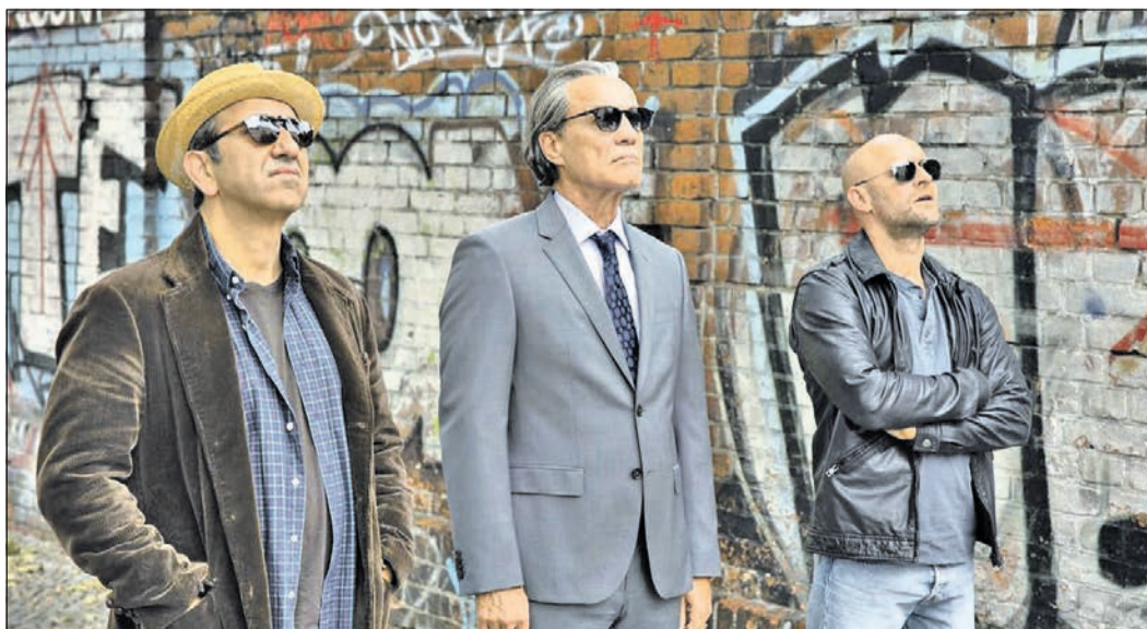
Beim Montagskino wird der Film „Es ist zu deinem Besten“ gezeigt.

Der Jubiläumssommer findet in der achten Woche auf dem Schulhof der Grundschule Süd-West in der Berliner Straße 27 – 29 statt. Am Mittwoch, 11. August, um 19.30 Uhr, nimmt sich Zydeco Annie & Swamp Cats kreativ dem Klang Louisianas an. Mit Cajun, Zydeco und Mardi Gras reist das Publikum in den tiefen Süden der USA. Die Spielfreude der Sängerin und der Musiker ist hochgradig ansteckend. Zu Recht gilt die Gruppe hierzulande als eine der besten Zydeco-Bands.