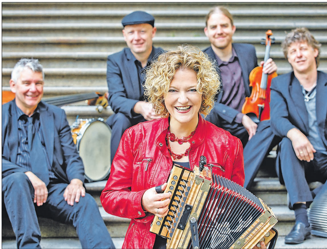
„Zydeco Annie & Swamp Cats“ nimmt sich bei ihrem Auftritt dem Klang Louisianas an. Die Spielfreude der Sängerin und der Musiker ist überaus ansteckend.