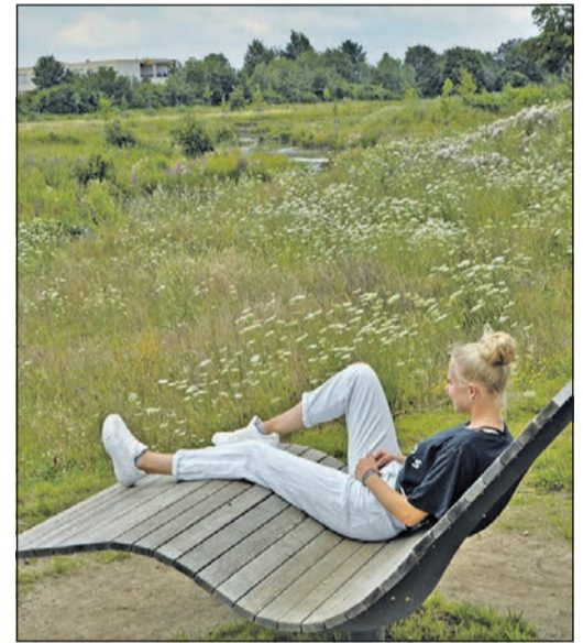
Auf den hölzernen Liegen der Wiesenterrassen am KSV-Sportplatz in Klein-Karben, die sich in die gewünschte Richtung drehen lassen, lässt sich wunderbar entspannen.