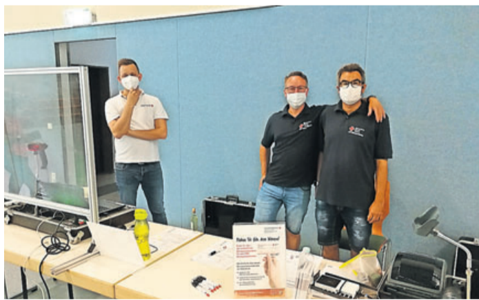
Der DRK Blutspendedienst bedankte sich bei den ehrenamtlichen Unterstützern des DRK Münzenberg für die organisatorische Abwicklung des Spendetermins.