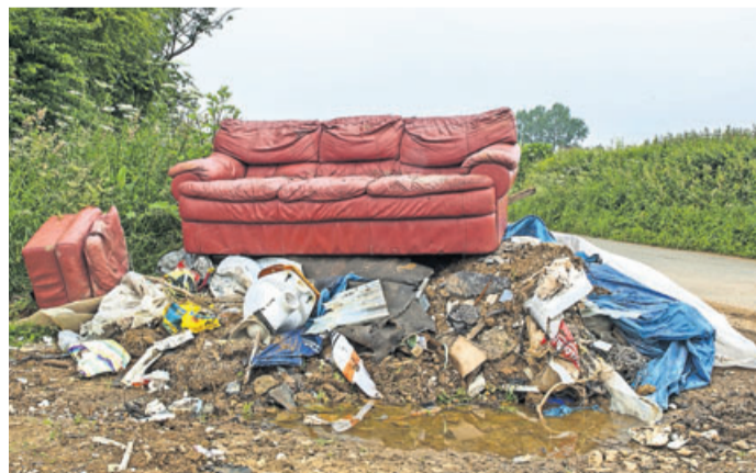
In der Natur entsorgter Müll ist der perfekte Nährboden für Ratten, Waschbären und Ungeziefer.

Illegale Müllentsorgung in Rosbach nimmt zu