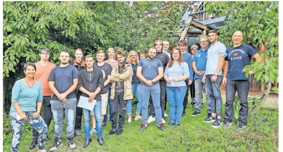
Ausgebildete Umwelttechnische und Solartechnische Assistenten mit Lehrerinnen und Lehrern der Berufsschule Butzbach.

Im Schwerpunkt Umwelttechnik spezialisierte sich die Ausbildung in standardisierten und umweltrelevanten Analyseverfahren (Boden, Luft, Wasser) im Labor wie auch in der Natur. Weiterhin wurden die Themen Ökologie, Abfallwirtschaft und Ressourcenmanagement bearbeitet.