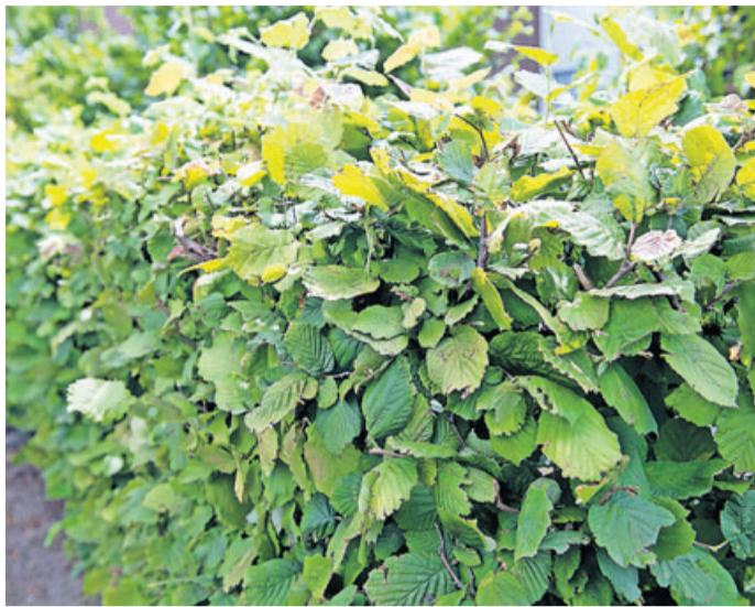
Ragt die Hecke des Nachbarn zu sehr auf das eigene Grundstück, darf man durchaus zur Heckenschere greifen.

merverbandes Haus & Grund Berlin. Allerdings verjährt dieser Anspruch in drei Jahren, beginnend mit der erstmaligen Störung. Danach haben Betroffene laut Gesetz aber immer noch die Möglichkeit, herübertagende Äste abzuschneiden, wenn der Nachbar dies trotz Aufforderung nicht in angemessener Frist tut. Dieses Recht zur Selbsthilfe unterliegt nicht der Verjährung. Das gilt auch bei Hecken, die zwar auf dem Grundstück des Nachbarn stehen, aber in den eigenen Garten hinüberwachsen.