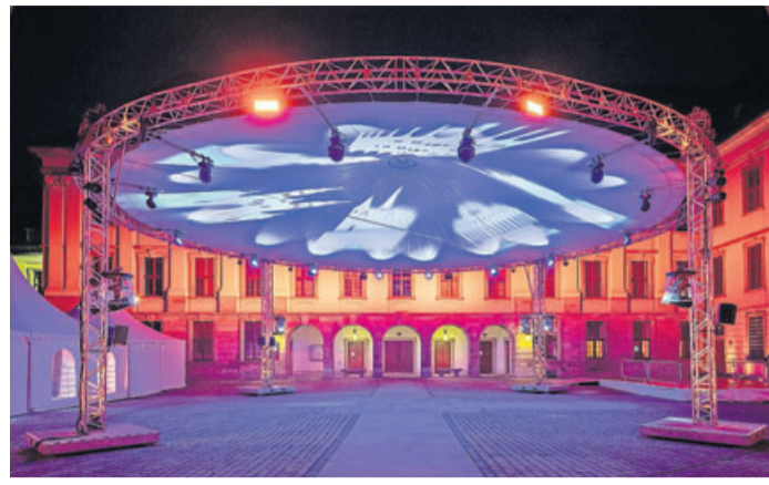
„Magic Sky“ im Schlosshof.

Fulda. Nach dem fulminanten Start der Kultur- und Konzertreihe „Kultur.findet.Stadt“ im überdachten Museumshof Fulda geht das Programm von „Dein Sommer in Fulda“ mit den „genuss'wochen“ in die nächste Runde. Sie sind eingebettet in das Konzept „Dein Sommer in Fulda“, zu dem unter anderem auch die Veranstaltungsreihe „Kultur.findet.Stadt“, das Spätlesefest „Wein im Schlosshof“, der Stadtstrand und die Reihe „Pausen, Höfe und Genüsse“ gehören. Erstmals erstrecken sich die „genuss'wochen“ über einen Zeitraum von sechs Wochen: vom 21. Juli bis 29. August. Fröhliches Feiern, Musik und gutes Essen – das gehört in Fulda seit jeher zusammen. Bei den „genuss'wochen“ bieten Spitzenköche aus der Region die Möglichkeit, mit Freunden eine schöne Zeit zu verbringen, bei kühlen Getränken und köstlichen regionalen Leckereien eine Auszeit vom Alltag zu nehmen und Fuldas Vielfalt zu genießen. Erfrischend und empfehlenswert wird in diesem Jahr der „Föllsche Spritzer“ sein. Das neue Fuldaer Sommergetränk – bestehend aus ei-