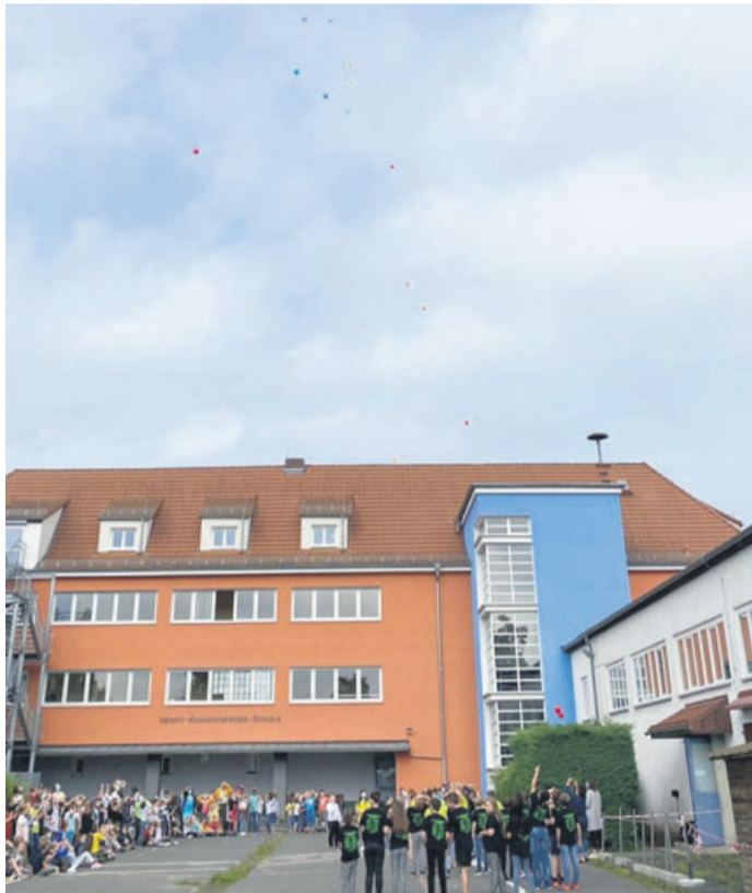
Ballons steigen vom Grundschul-Hof der Henry-Harnischfeger-Schule in den Salmünsterer Himmel.