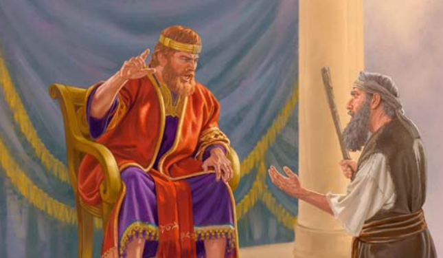
König David reagierte im Gespräch mit Nathan hartherzig (Siehe Absatz 19, 20)

Paulus hatte Mitleid mit ihm. Er wollte nicht, dass ihn die Last seiner Schuld so sehr niederdrückt, dass er nicht mehr Jehovas Vergebung sucht. ( Lies 2. Korinther 2:5-8, 11. )