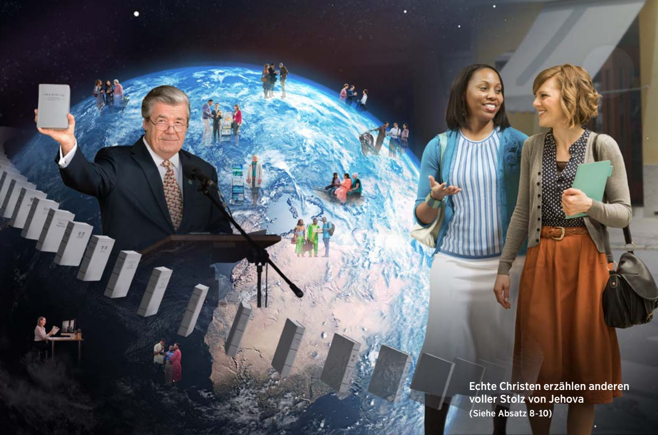
Echte Christen erzählen anderen voller Stolz von Jehova (Siehe Absatz 8-10)

Jehovas Namen? Was sagen die Fakten? Heute setzen viele Geistliche alles daran zu verschleiern, dass Gott einen Eigennamen hat. Sie haben ihn aus ihren Bibelübersetzungen entfernt und mitunter sogar verboten, ihn in Gottesdiensten zu gebrauchen.* Besteht irgendein Zweifel, dass Jehovas Zeugen als Einzige dem Namen Gottes die Achtung und Ehre erweisen, die er verdient? Keine andere Glaubensgemeinschaft macht den Namen Gottes in vergleichbarem Ausmaß bekannt. Jehovas Zeugen tun ihr Bestes, ihrem Namen gerecht zu werden