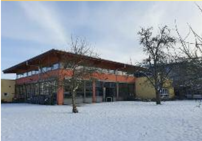
Auf dem Foto: Winterliche Impressionen aus dem Schulgarten der Henry-Harnischfeger-Schule. Blick auf die Schulmensa mit Terrasse.

Virtuelle Live-Vorstellung der Henry-Harnischfeger-Schule am Samstag, 13. Februar. „Wir freuen uns sehr über die positiven Rückmeldungen vieler Besucherinnen und Besucher unserer Henry Tours. Grundschülerinnen und -schüler aus den vierten Klassen der umliegenden Grundschulen konnten gemeinsam mit ihren Eltern die Henry-Harnischfeger-Schule bereits online kennenlernen. Nun steht der vierte und letzte Termin unserer kommentierten Henry-Tour an, zu der wir herzlich einladen. Diese findet statt am Samstag, 13. Februar von 10 Uhr bis 12 Uhr. Anmelden kann man sich unter henrytour@hhs-live.de “, erklärt die Schulleitung der Henry-Harnischfeger-Schule Bad Soden-Salmünster und freut sich auf die jungen Besucherinnen und Besucher.