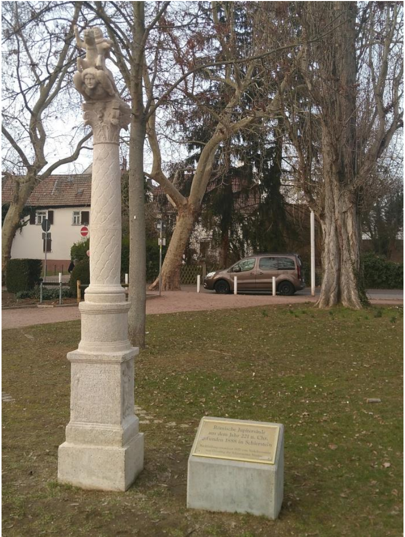
2018 umgefallen und zerbrochen, steht die Nachbildung der Jupiter-Gigantensäule inzwischen frisch renoviert wieder in der Wilhelm-Loos-Anlage am Schiersteiner Hafen