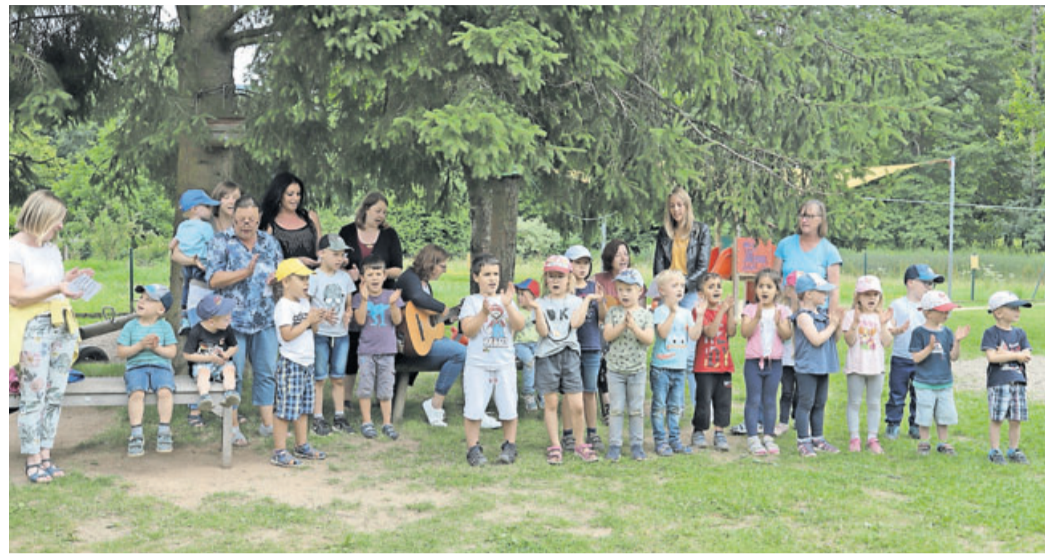
Begrüßung mit Musik: Die Ehrenberger Spatzen sangen gemeinsam mit ihren Erzieherinnen und sorgten zusätzlich für gute Laune.

Ehrenberg, Ebersburg, Hilders und Hofbieber erhalten insgesamt fast 1,1 Millionen Euro, um ihre Kita-Projekte zu realisieren. Die Vier haben viel vor. „In der Summe investieren diese Kommunen aktuell sechs Millionen Euro in den Ausbau ihrer Kindertagesbetreuung“, sagte Frederik Schmitt und ergänzte: „Kinderbetreuung in hoher Qualität – sowohl in pädagogischer als auch in räumlicher Hinsicht – ist eine unserer wichtigsten Aufgaben und kostet entsprechend Geld. 1,2 Millionen Euro haben die vier Kommunen bereits aus dem Kreisausgleichsstock des Landkreises erhalten. Nun fließen auch Mittel aus Programmen von Bund und Land.“ Dennoch liege die größte Investitionsaufgabe auf Seiten der Städte und Gemeinde. „Dafür bedanke ich