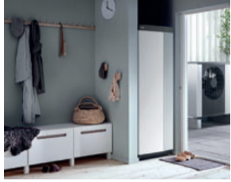
Mit einer NIBE Wärmepumpe erfüllt ein Haus die Anforderungen an den Standard EH 55 EE.

Überlegen Sie, Ihr Eigenheim auf einen modernen Energiestandard zu bringen oder ein neues, energiesparendes Haus zu bauen? Dann dürfen Sie sich seit dem 1. Juli 2021 über attraktive, staatliche Förderungsmöglichkeiten freuen. Mit der Neuregelung für den Bau sogenannter Effizienzhäuser übernimmt die Bundesförderung für effiziente Gebäude (BEG) einen wesentlichen Anteil der Investitionen, die für den besseren Baustandard erforderlich sind.