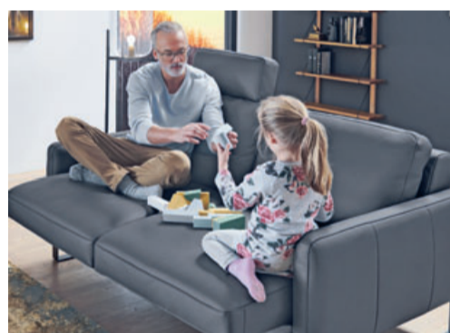
Die Extras der Orthopädika-Serie machen den Unterschied: Der automatische Sitzvorschub zum lässigen Sitzen oder Liegen – die entspannende Herz-Waage-Funktion gibt es nun auch im Sofa – die Kopfteilverstellung für das bequeme Lesen. Vielseitiger geht es kaum.