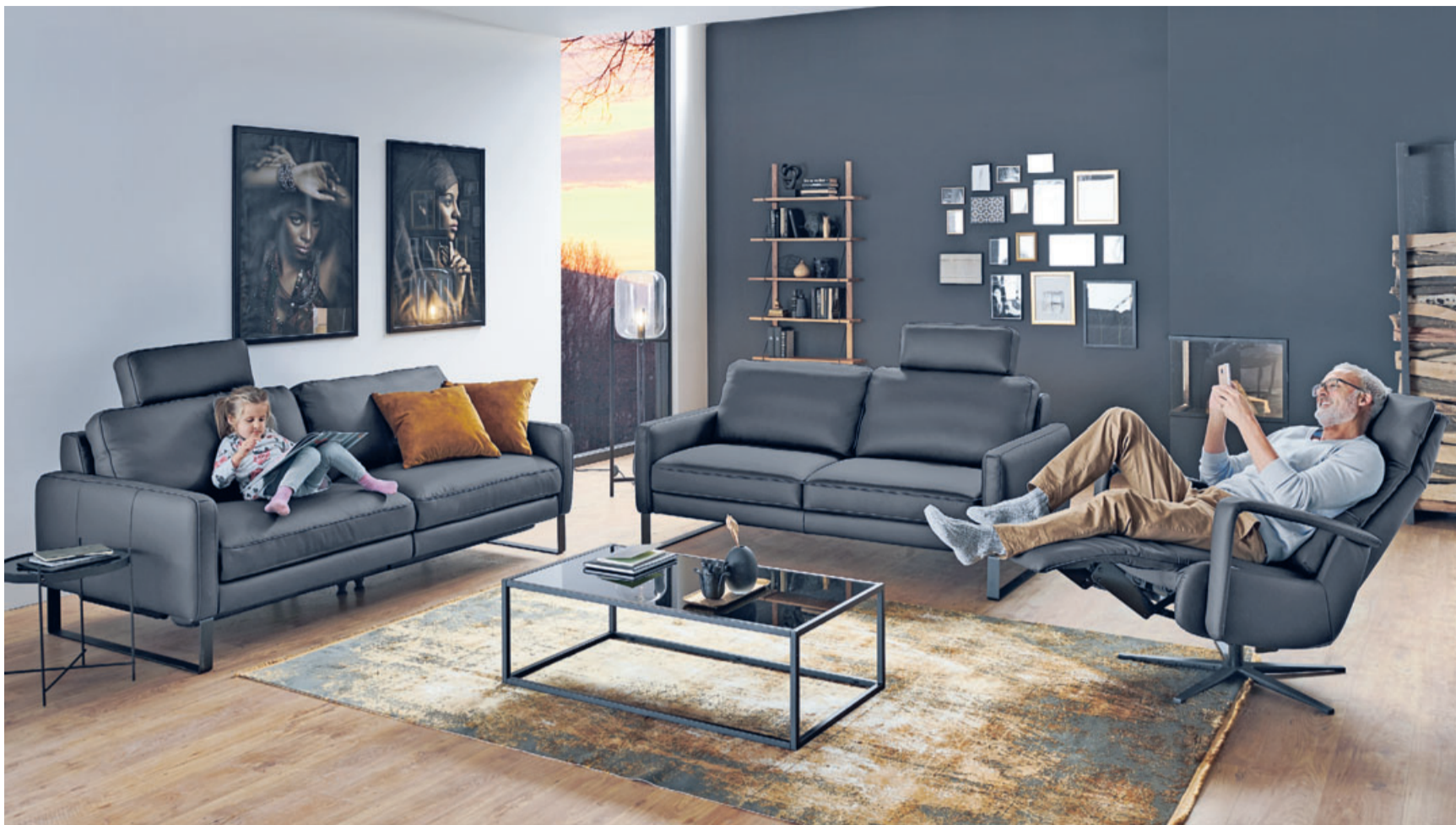
Orthopädika Design – die Kombination aus stilischem Design und gesundem Sitzen. Die neue Kollektion begeistert die Kunden ebenso wie die Fleckschutz-Garantie, die Null-Prozentfinanzierung** oder der 500 Euro-Wert-Gutschein*.

500-Euro-Gutschein*, Fleckschutz und Null- Prozent- Finanzierung**