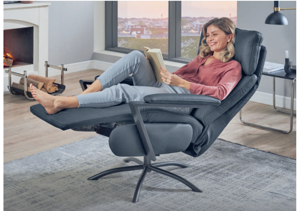
So wird Sitzen zum Vergnügen: Optimalen Komfort und jede Menge Bequemlichkeit garantieren auch die Orthopädika-Relaxsessel.