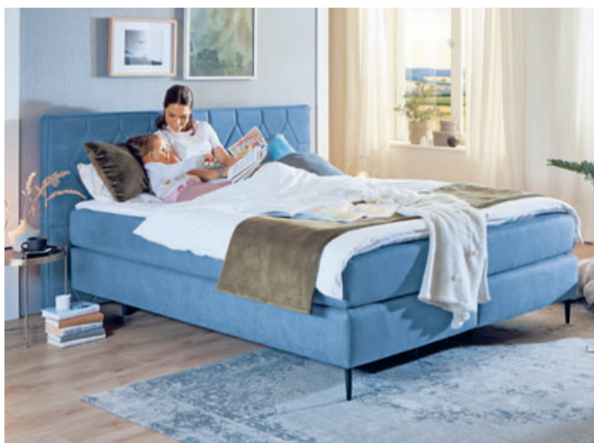
Die Original Orthopädika Boxspringbetten gibt es nur bei Polster Aktuell. Bitte aus Sicherheitsgründen einen Beratungstermin vereinbaren.