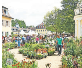
Vom 12. bis 15. August ist wieder Gartenfest in Hanau.

Zwischen der Teufelsbrücke und den großen, schattenspendenden Bäumen des Staatsparks reiht sich ein Stand an den anderen, hier mit Stauden und Gehölzen, dort mit Kräutern, Gewürz- und Duftpflanzen, dazwischen Rosen, Pflanzgefäße oder praktische Gartenhelfer – eine wahre Fundgrube für Hobbygärtner. Dekorative Gartenkunst und wahre Schätze aus Stahl, Glas und Holz regen die Fantasie an. Stilvolle Gartenmöbel verheißten lauschig-entspannte Stunden, und die Stände mit Hüten, Landhausmode und Schmuck laden zum Anprobieren ein. Auch kulinarisch bleiben keine Wünsche offen, denn passend zum sommerlichen August sind leckeres Soft-Eis, erfrischende Cocktails, fruchtige Erdbeerbowl und viele andere Köstlichkeiten im Angebot. Entdecken Sie neben den weißen Pagodenzelten mit ihren