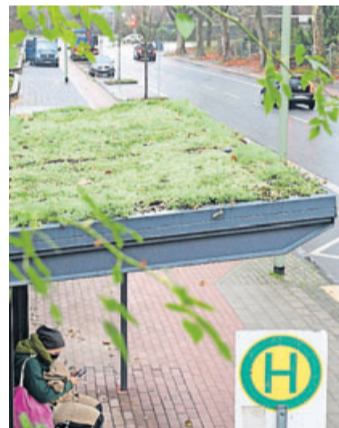
Ein begrünter Fahrgastunterstand bietet Insekten schon auf wenigen Quadratmetern Nahrung.

Main-Kinzig-Kreis. „Jeder Quadratmeter zählt für die Artenvielfalt“ – nach diesem Motto sollen auch die Dächer von Fahrgastunterständen in den Blick genommen und begrünt werden, damit dort auf nur wenigen Quadratmetern Pflanzen wachsen können, die Insekten Nahrung bieten. „Auf diese Weise können Kommunen ganz pragmatisch einen Beitrag gegen das Insektensterben leisten“, erklärt Erste Kreisbeigeordnete und Umweltdezernentin des Main-Kinzig-Kreises. Sie ergänzt: „Im Rahmen von Main.Kinzig.Blüht.Netz haben wir es uns zum Ziel gesetzt, innerhalb von fünf Jahren ein Netz von 500 Blühflächen zu schaffen. Auch Dachbegrünungen können einen Beitrag leisten, damit Insekten mehr Nahrung finden.“ Rüdiger Krenkel, Geschäftsführer der Kreisverkehrsgesellschaft Main-Kinzig mbH (KVG) betont: „Für alle neu zu planenden Fahrgastunterstände oder auch bei bestehenden, sanierungsbedürftigen Unterständen an Haltestellen im Kreisgebiet empfehlen wir im nächsten Nahverkehrsplan die Prüfung zur Einrichtung von Dachbegrünungen. Damit unterstützen wir die Kommunen bei der Umsetzung der klimapolitischen Zielvorgaben in konkrete Maßnahmen. Denn jeder einzelne Baustein zählt.“ Jörg Schmitz, der im Auftrag des Kreises als erster Ansprechpartner im Förderprogramm „Unternehmen blühen auf“ unterwegs ist, hat es sich zum Ziel gesetzt, Planungsbeiträge im Nahverkehr zu vernetzen und zu motivieren. „Nachdem ich ein Dachbegrünungsprojekt der Duisburger Verkehrsbetriebe gesehen hatte, bin ich überzeugt: genau