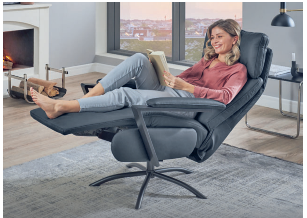
So wird Sitzen zum Vergnügen: Optimalen Komfort und jede Menge Bequemlichkeit garantieren auch die Orthopädika-Relaxsessel.