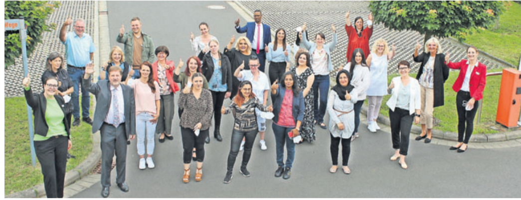
Freude über das Erreichte: 22 Frauen und 2 Männer haben das Seminar „Karrierestart mit Kind“ erfolgreich an den beiden AQA-Standorten in Hanau und Gelnhausen abgeschlossen – hier bei der Abschlussfeier am Standort in Gründau.