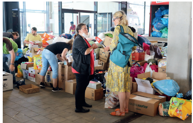
Leider nur mit Mikrofön und ohne Kameramann: Vom SWR-Studio Mainz tauchte unvermittelt eine Reporterin bei der Hilfsaktion am Fußballstadion auf und sammelte mehrere O-Töne für einen Radiobeitrag.