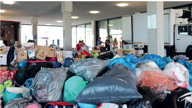
Wer den Fanshop vor dem Fußballstadion des Erstligisten Mainz 05 kennt, hat diesen am 19. Juli kaum wiedererkannt: Tausende Kartons und Säcke türmten sich am Tag der Sammelaktion dort auf.

CHARITY Viele Hilfsaktionen für die Opfer der Überschwemmungen im Juli wurden binnen Stunden aus dem Boden gestampft. Dank einer immensen Spendenbereitschaft fehlten allerorts Logistiker. Auch die DMG wurde um Hilfe gebeten. Und sie half.