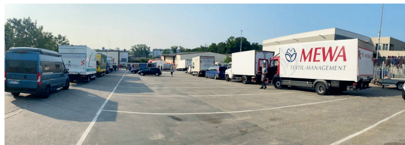
Dutzende Lkw warteten am Folgetag auf die Abfahrt: Vom Betriebshof der Mainzer Umzugsspedition Stark startete der Konvoi Richtung Ahrtal. Der 7,5-Tonner der DMG ist der Zweite von links.