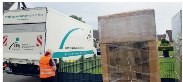
Umzugskartons werden von den Helfern gebraucht, um die zahlreichen Spenden, die zumeist in viel zu dünnen Kartons oder gar Müllsäcken angeliefert werden, transportfähig zu machen. Zudem benötigen auch die Opfer überspülter Wohnungen und Häuser nach der Schlammabeseitigung stabile Kartons, um das zu retten, was von den Fluten verschont worden ist. Die DMG spendete an vielen Orten in Deutschland mehrere tausend Kartons.