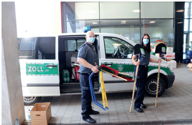
Hilfe mit Köpfchen: Telefonisch erfragten die Mitarbeiter des Zolls bei den Helfern, was konkret fehlen würden, kauften dann im Baumarkt Schaufeln, Besen und Sägen und spendeten diese Güter persönlich.