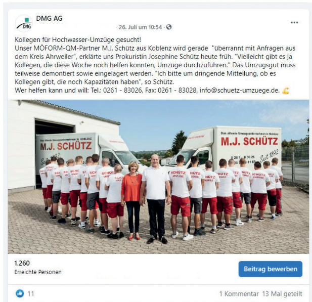
Nach dem Hochwasser Mitte Juli konnte die DMG zeitnah mit ihrem großen Verteiler Schütz aus Koblenz (Bild o.) unterstützen. Abseits solcher Katastrophen kommt aber auch der Spaß (Bild r.) nicht zu kurz.