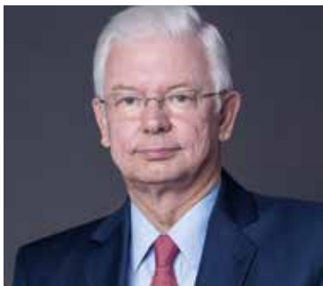
Seit November 2020 das Gesicht der renommierten Stiftung: Hessens früherer Ministerpräsident Roland Koch.

Der Vorsitzende der Ludwig-Erhard-Stiftung, Roland Koch, über die Zukunft und die Herausforderungen der deutschen Wirtschaft