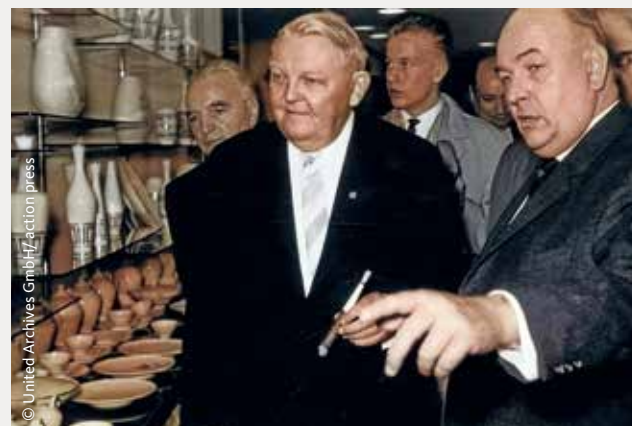
Der Namensgeber der Stiftung, Ludwig Erhard, gilt als Vater des deutschen Wirtschaftswunders und Begründer der Sozialen Marktwirtschaft. Sein Motto lautete: Wohlstand für Alle.