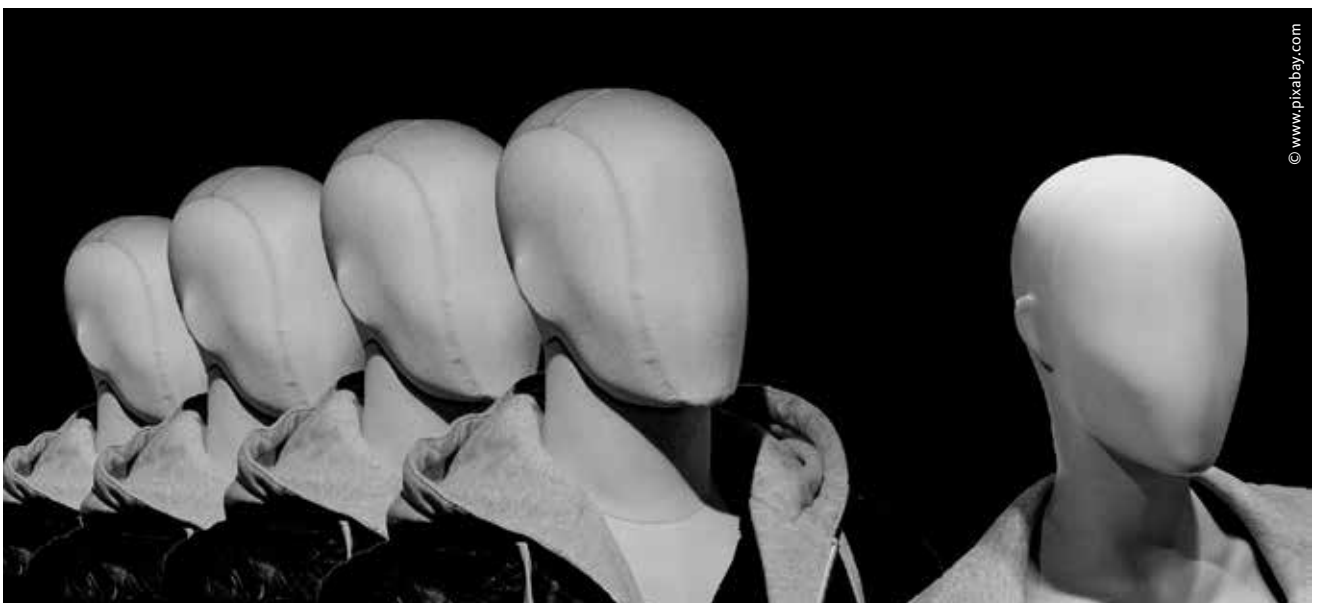
Im Schutz der Anonymität des Internets werden Falsch- und Hassmeldungen verbreitet. Die CDU Hessen will dies nicht hinnehmen.

Der Rechtsstaat bewährt sich gerade auch in der Krise. Die Justiz und der Strafvollzug sind und bleiben handlungsfähig. Die CDU-Fraktion im hessischen Landtag schafft die Voraussetzungen dafür, dass der Rechtsstaat auch im digitalen Zeitalter handlungsfähig, stark und verlässlich bleibt. ■