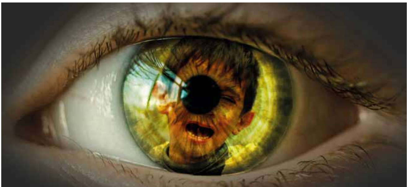
Die Erfolge der ZIT sind wichtige Signale an Kriminelle im Darknet, dass auch hier eine effektive Strafverfolgung möglich ist.

Menschen am Leid der Kinder dann im Internet ergötzen. Der Schlag gegen die Kinderpornoplattform „Boystown“ im Darknet ist daher eine erfreuliche Nachricht mit einem starken Signal nach außen, das ohne die Mithilfe der hessischen Zentralstelle zur Bekämpfung der Internetkriminalität (ZIT) nicht möglich gewesen wäre. Unser herzlicher Dank gilt der ZIT und allen anderen beteiligten Sicherheitsbehörden. ■