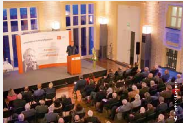
WELT-Chefredakteur Ulf Poschardt bei seiner Dankesrede anlässlich der Verleihung des Ludwig-Erhard-Preises für Wirtschaftspublizistik 2019.