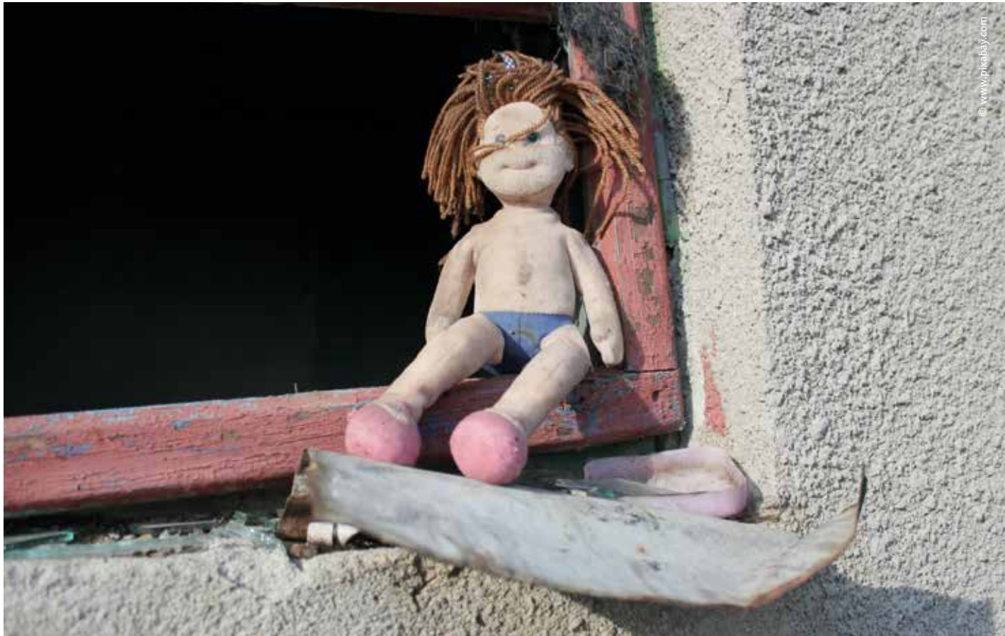
Der Schutz des Kindeswohls hat für die hessische CDU oberste Priorität.

Mit dem Begriff Cybergrooming wird das planmäßige Einwirken auf Personen im Internet mit dem Ziel der Anbahnung sexueller Kontakte bezeichnet. Handelt es sich bei dem Opfer um ein Kind, war dies auch nach der alten Gesetzeslage strafbar. Mit der Änderung des Gesetzes macht sich nun auch derjenige strafbar, der ein vermeintliches Kind kontaktiert, obwohl sich in Wirklichkeit ein Erwachsener, beispielsweise ein Ermittler, dahinter versteckt. Die Änderung ging maßgeblich auf die Initiative Hessens zurück.