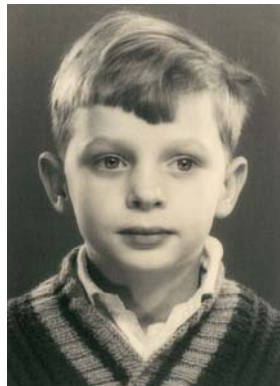
Als ich sieben war, lebten wir in Brasilien

Während meiner Schulzeit dachte ich oft darüber nach, was ich später mal werden will. Einige von meinen Freunden gingen auf die Universität, andere zum Militär. Das Militär kam für mich nicht infrage. Mir widerstrebte es schon zu streiten, geschweige denn zu kämpfen. Um nicht Soldat werden zu müssen, entschied ich mich für die Uni. Tief im Innern hatte ich jedoch den Wunsch, anderen zu helfen. Davon versprach ich mir einen Sinn im Leben.