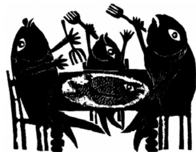
Holzschnitt des 2018 verstorbenen Taunussteiner Grafikers und Illustrators Günther Stiller.

Der kostenlose Download überkünstreden ist auf der Homepage der Stadt Taunusstein abrufbar: www.taunusstein.de/geschichten Eine Papierversion (184 Seiten, 15 Euro) ist im Stadtmuseum Taunusstein, Museum im Wehener Schloss, erhältlich.