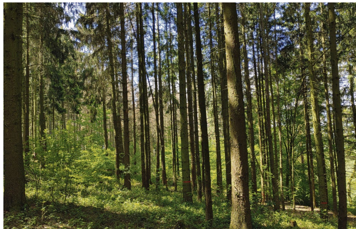
Weitgehende Fichtenmonokultur im Taunussteiner Stadtwald. Laut Gutachten wird der Fichtenbestand wegen der massiven Borkenkäferschäden in den nächsten Jahren in Taunusstein gegen Null gehen.

Bereits in der Forsteinrichtung 2017 wurde die naturgemäße Waldbewirtschaftung zusammen mit weiteren Zielen wie dem Arten- und Biotopschutz festgelegt. Laut Gutachten ein alternativer Weg, den es jetzt konsequent mit der Neujustierung zu beschreiten gilt. Die auch in Taunusstein praktizierten flächigen Wie-