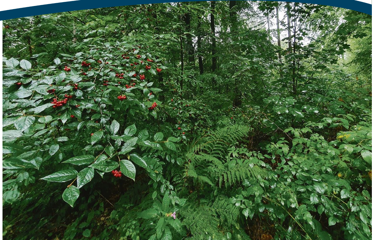
Artenreicher Forst in Schönwald, der seit rund 40 Jahren im Sinne des Konzepts der naturnahen Waldbewirtschaftung entwickelt wird.