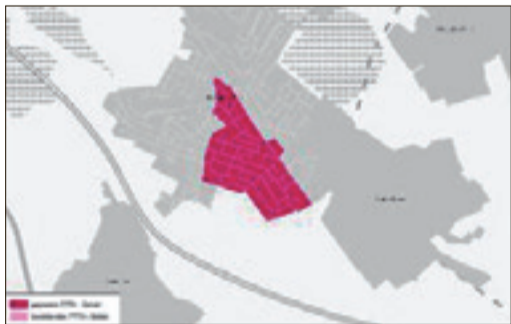
Das betreffende Gebiet.

Da das neue Netz fast direkt in die Wohnung oder das Haus führt, benötigen Anbieter wie die Deutsche Telekom das Einverständnis der Eigentümer, da „privater Grund“ betreten werden muss. Ein Interessent, der einen Telekomtarif haben möchte, beauftragt die Deutsche Telekom, die sich dann mit dem Hauseigentümer / Vermieter in Verbindung setzt und alles Weitere bespricht.