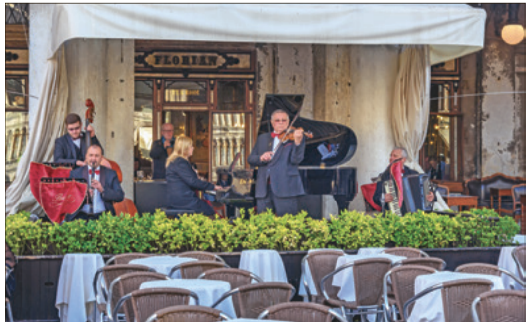
Mit dem einzigartigen Konzerterlebnis „Piazza San Marco“ holt die Musikstiftung italienisches Flair nach Bad Soden.

Die Mindereinnahmen werden durch die Stiftung aufgefangen, weshalb es möglich ist, den an den Mendelssohn Tagen der Musik beteiligten Künstlerinnen und Künstlern ein angemessenes Honorar zu zahlen, auf das viele von ihnen aktuell finanziell angewiesen sind. Darüber hinaus hat die Bad Sodener Musikstiftung insgesamt mehr als 40.000 Euro Corona-Hilfen an Künstler ausgeschüttet – auch, um auf diesem Weg die kulturelle und musikalische Vielfalt in Bad Soden zu erhalten.