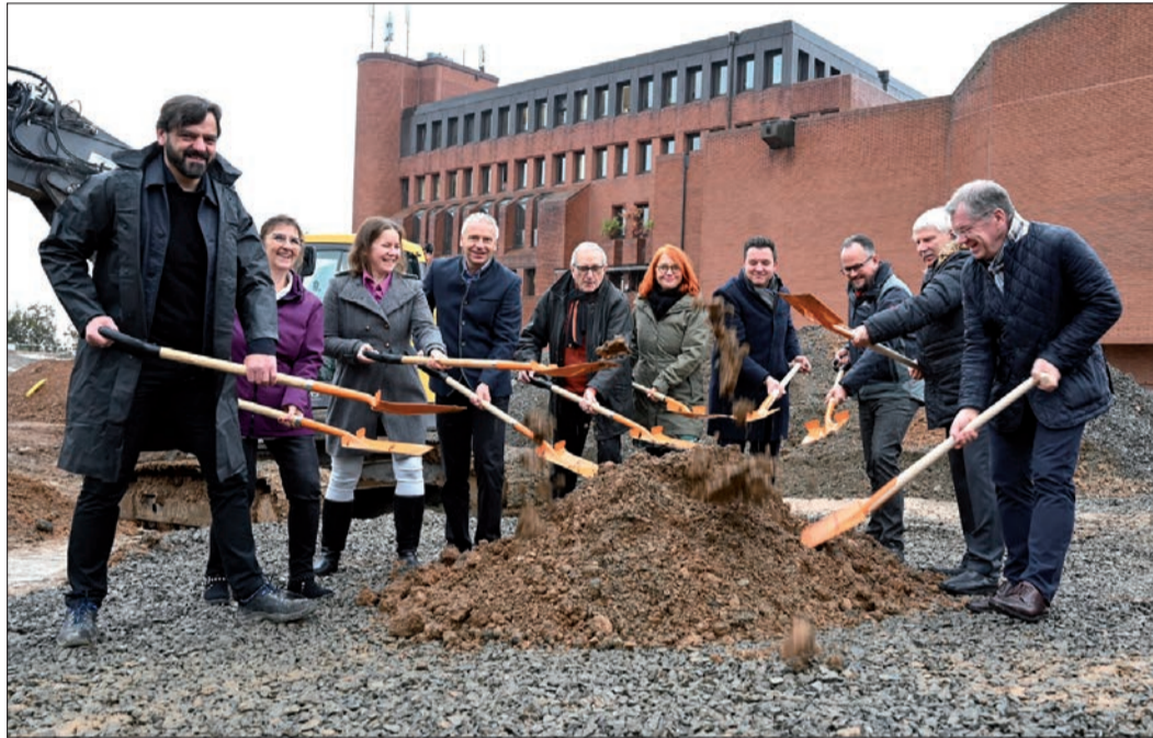
Der symbolische Spatenstich zur Erweiterung des Landratsamtes

Internetseite www.mtk.org . Der Kreis informiere laufend über den Fortgang des Projekts, so der Landrat mit Hinweis auf zahlreiche Präsentationen in politischen Gremien, bei Veranstaltungen und Gesprächen mit den Anwohnern und auf laufende Berichterstattung in der Öffentlichkeit. „Dass wir eine solche Erweiterung brauchen, ist klar“, macht Cyriax deutlich. „Aber wir haben im Laufe dieses Großprojekts verschiedene Aspekte immer wieder weiterentwickelt. Das zeigt: Wir wollen in Zusammenarbeit mit Bau-, Planungs- und Umweltfachleuten die bestmögliche Lösung, und wir nehmen auch Anregungen aus der Öffentlichkeit und von den Nachbarn auf.“ Beispielsweise würden in der Bauphase die Maschinen über eine Route auf der von der Nachbarschaft abgewandten Seite des Verwaltungssitzes an- und abfahren: Das halte die Belastungen möglichst gering. Mit dem Vorhaben werde das Gelände auf dem Hofheimer Hochfeld insgesamt aufgewertet, so der Landrat weiter. Die Grünan-