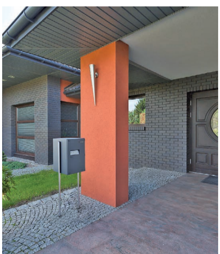
Designstark und praktisch: Die Paketbox nimmt jederzeit Lieferungen entgegen und bewahrt sie sicher auf. Ärgerliche Zustellungsverzögerungen und unnötige Gänge zum Paketshop gehören somit der Vergangenheit an.