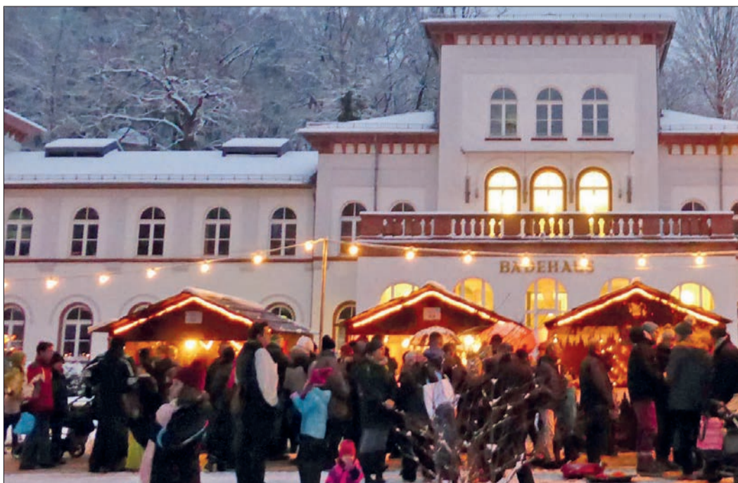
So schön war's 2019: Impression vom Weihnachtsmarkt, hier vor dem Badehaus