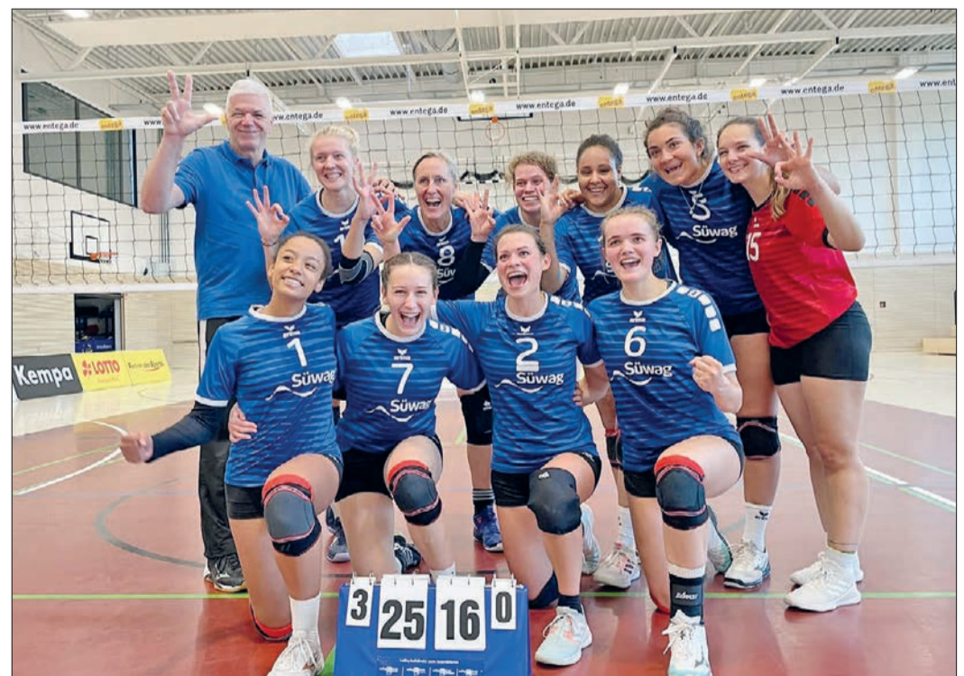
Die TG Bad Soden-Damen gewannen gegen den TGM Mainz-Gonsenheim 3:0.

Ob Ausgleichssport, allgemeine Fitness oder Selbstverteidigung: Karate eröffnet allen Altersgruppen und Interessenslagen ein breites sportliches Betätigungsfeld. Es gilt die 2G-Regel im eigenen Interesse. Schnupperteilnahmen sind kostenfrei. Weitere Infos unter www.tsg-altenhain.de oder direkt beim erfahrenen Kursleiter Alexander Kuppler (Träger des schwarzen Gürtels) unter der Telefonnummer 0173-9454319 oder per E-Mail an alexander.kuppler@icloud.com .