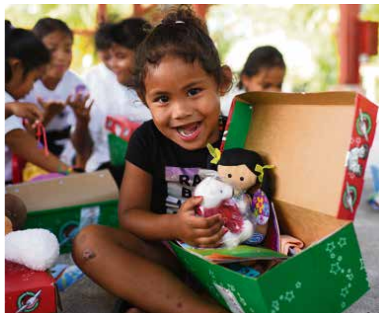
Jährlich freuen sich mehr als zehn Millionen Kinder über ein Geschenk von „Weihnachten im Schuhkarton“.