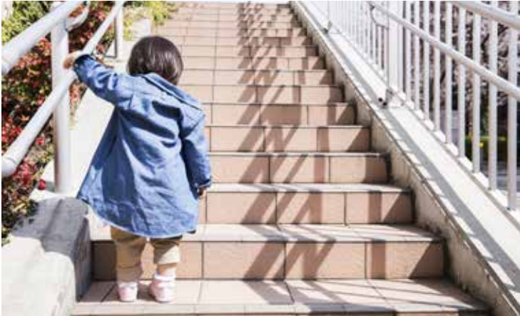
Glatte Platten und Fliesen im oder vor dem Haus stellen ein latentes Unfallrisiko dar. Eigentümer sind in der Pflicht, sichere Verhältnisse zu schaffen.