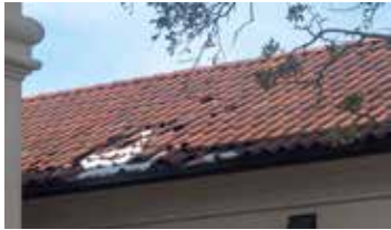
Durch Schäden im Dach gelangt schnell Feuchtigkeit ins Innere des Hauses.

Mit 10 Handgriffen unbeschadet durch die kalte Jahreszeit