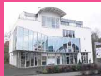
Geschäftshaus, Tsst.-Hahn KP: € 2.100.000,00