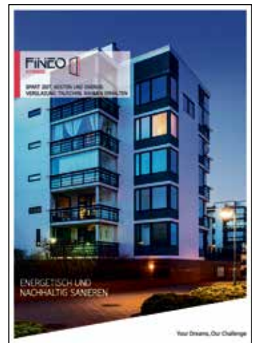
Die neue Broschüre zu „Fineo Hybrid“ zeigt anschaulich die verschiedenen Standard-Aufbauten des innovativen Mix aus Isolierglas und Vakuumglas. Zudem veranschaulicht sie das einfache Vorgehen beim Glastausch.

Tagelange Bauarbeiten an der Fassade mit viel Schmutz wären unvermeidbar. Die elegantere Lösung bietet der europäische Hersteller „Fineo“ mit seinen zertifizierten Montagepartnern: Als Erstes werden die alten Fenster begutachtet und ausgemessen ( www.fineoglass.eu ). Im zweiten Termin wird dann sauber und zeitsparend das alte Isolierglas ausgeglast und durch die neuen Vakuum-Isoliergläser ersetzt. Die gut erhaltenen Rahmen bleiben erhalten – denn warum wegwerfen, was noch gut funktioniert? Fineo Hybrid ist deutlich schlanker als Dreifach-Isolierglas und erzielt eine bessere Wärme- und Schalldämmung. Letzteres ist ein weiterer Pluspunkt für den Einsatz auch in Mehrfamilienhäusern in der Stadt.