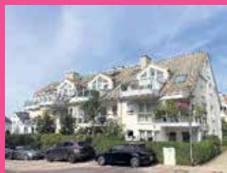
3-Zi-ETW, Tsst.-Hahn, KP: € 320.000,00