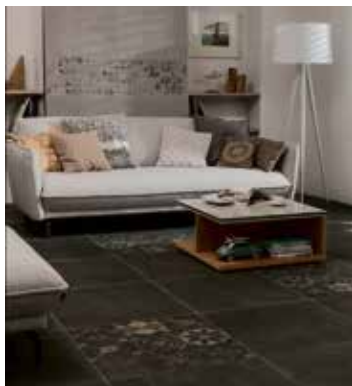
txn. Schneller Baufortschritt: Ob Fliesen, Laminat, Naturstein oder Parkett – auf Trockenestrich-Elementen kann jeder gewünschte Oberbelag nach 24 Stunden realisiert werden.

Vor allem die Elemente von fermacell auf Basis von Gipsfasern erfüllen alle Kriterien für moderne Baustoffe. Die vorgefertigten Elemente lassen sich durch einen Stufenfalz, der einfach für die kraftübertragende Verbindung sorgt, schnell verlegen. Da sie außerdem keine