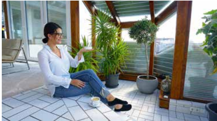
Die Steuerungsbox vernetzt Aluminium-Rollläden, Beleuchtung & Co. Sie kann u. a. per Sprachsteuerung bedient werden.

Smarte Steuerung vernetzt Aluminium-Rollläden, Beleuchtung & Co.