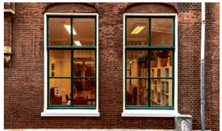
Moderne Vakuum-Isoliergläser sind so schlank wie ein Zweifach-Isolierglas, dämmen aber mehr als doppelt so viel Wärme und schützen gleichzeitig effektiv vor dem Straßenlärm. Durch die Erhaltung der Rahmen und Profile ist der Isolierglas-Tausch zudem besonders umweltfreundlich und nachhaltig.