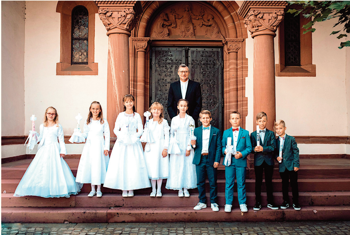
Die Kommunionkinder St. Matthias in Langendernbach

Wir werden diesen wunderschönen Tag in besonderer Erinnerung behalten!