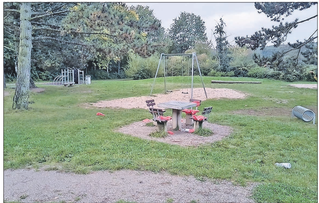
Dass die Hundekotbeutel in Schwalbach als Unterlage für öffentliche Sitzgelegenheiten missbraucht werden, das zeigt der jüngste Vorfall auf dem Waldspielplatz.

höhere Verbrauch resultiere auch nicht aus einer stärkeren Akzeptanz der Nutzer, wie das Ordnungsamt nun feststellte. Vielmehr sei der Mehrverbrauch auf die Zweckentfremdung der Tüten zurückzuführen. So seien ganze Pakete mit 1000 Tüten aus den Spendern gerissen worden, um sie dann als wärmende Sitzkissen auf Parkbänken zu missbrauchen. Die Folien landen darüber hinaus auch in Bächen und Büschen und bieten ein unschönes Bild in der Stadt, sie schaden vor allem der Umwelt. Das Ordnungsamt und auch die Mitarbeiter des städtischen Bauhofs appellieren daher an die Bürger, mit den Beuteln sorgsam und umsichtig umzugehen, damit auch immer welche zur Verfügung stehen, wenn sie für den eigentlichen Zweck gebraucht werden. Wer hingegen einen Missbrauch beobachtet, den bittet das Ordnungsamt, den Vorfall zu melden. Denn am Ende müssen alle Bürger für den Missbrauch der Beutel über ihre Steuergelder aufkommen.