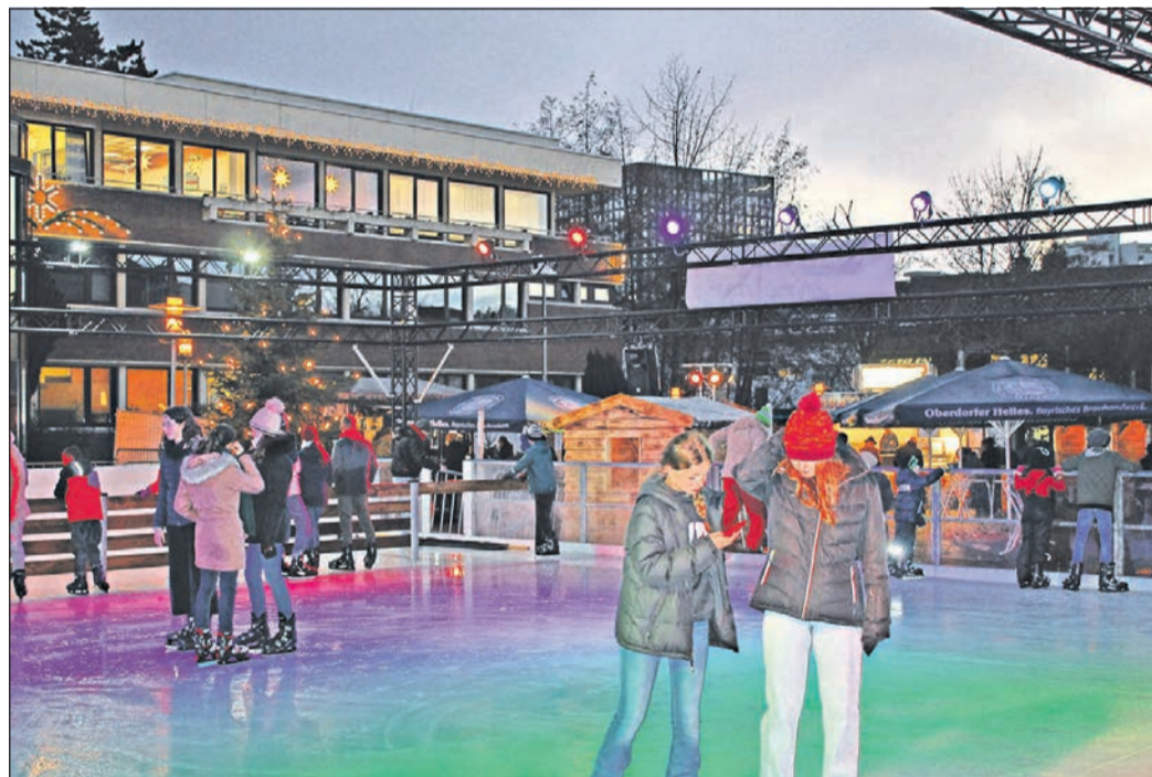
Viel Spaß haben die Besucher des „Eschborner Winters“ – noch bis zum 9. Januar ist gute Laune auf dem Eis angesagt.

Der „Eschborner Winter“ kann noch bis zum 9. Januar besucht werden. Besucher parken kostenlos in der Tiefgarage unter dem Rathaus. Nähere Informationen, auch zu den Corona-Regeln, stehen im Internet unter www.eschborner-winter.de .