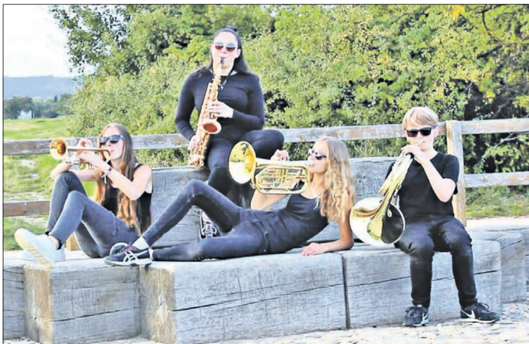
Die Gruppe „Young Feelings“ des Vereins Brass- und Marchingband gehört zu dem kreativen Nachwuchs innerhalb des Vereins.

Wer Lust hat mitzumachen, der erhält weitere Informationen per E-Mail an bmb@eschborn.de .