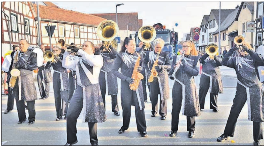
Die Gruppe „Impuls“ des Brass- und Marching-Band-Vereins ist eine überaus aktive Musikband.