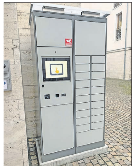
Das Terminal ist nun in Betrieb.

kann es zu einem beliebigen Zeitpunkt binnen einer Woche abgeholt werden.