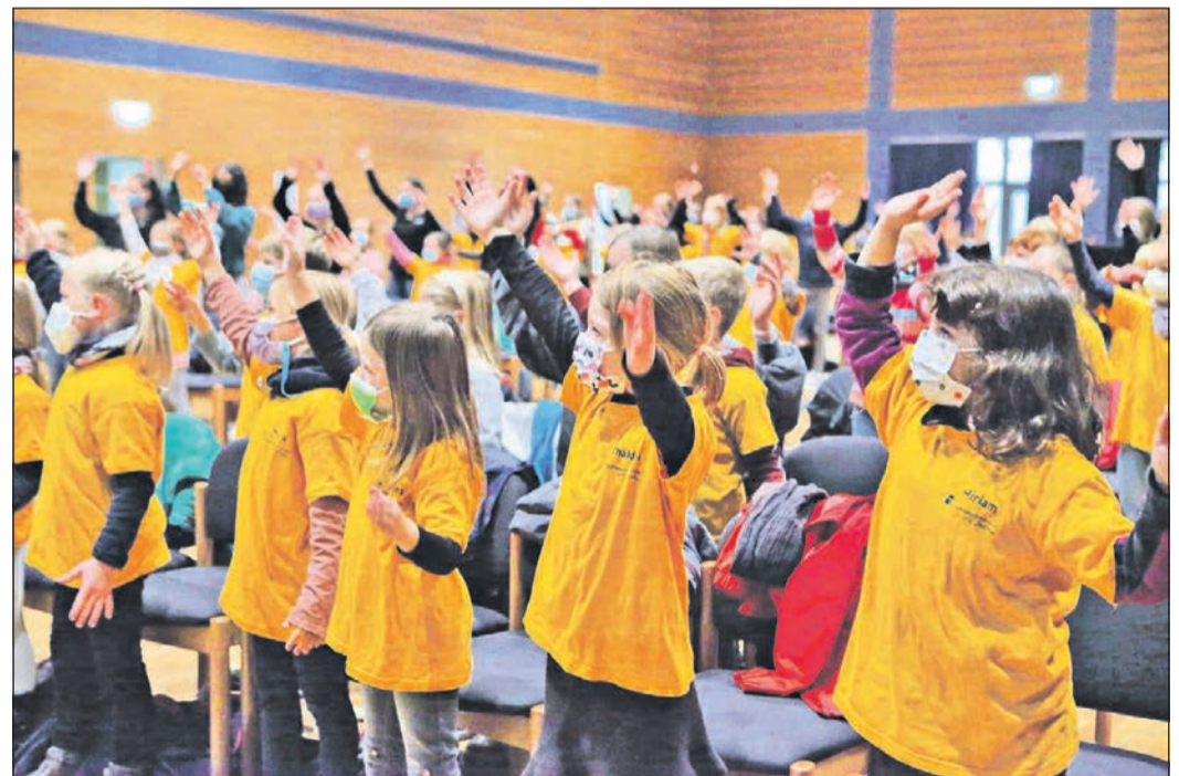
Mit Maske, Test und Abstand proben die Kinder der evangelischen Andreaskirche derzeit ein neues Musical, das im März gezeigt werden soll.

Das große gemeinsame Probenwochenende im Bürgerhaus Niederhöchstadt haben die Akteure schon hinter sich, nun steht als nächstes die Aufnahme für die CD an, die es für alle, die es wünschen, zum Musical gibt. Vier Stunden hat die Gemeinde dafür Ende Februar eingeplant, bevor es Anfang März, sofern es Corona zulässt, einen großen Probenstag mit Kostümen, Requisiten und Band geben soll. Klar, dass die Kleinsten diesem Ereignis schon entgegenfiebert und mit viel Leidenschaft ihre Rollen üben und proben. Derzeit sind die Aufführungen für den 26., 27., 28. März sowie für den 2. und 3. April geplant. Die Uhrzeiten und der Veranstaltungsort werden rechtzeitig bekannt gegeben.