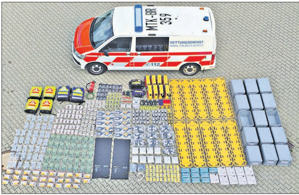
Der neue Rettungswagen beinhaltet eine Vielzahl von Gerätschaften für die Rettung mehrerer Personen gleichzeitig.