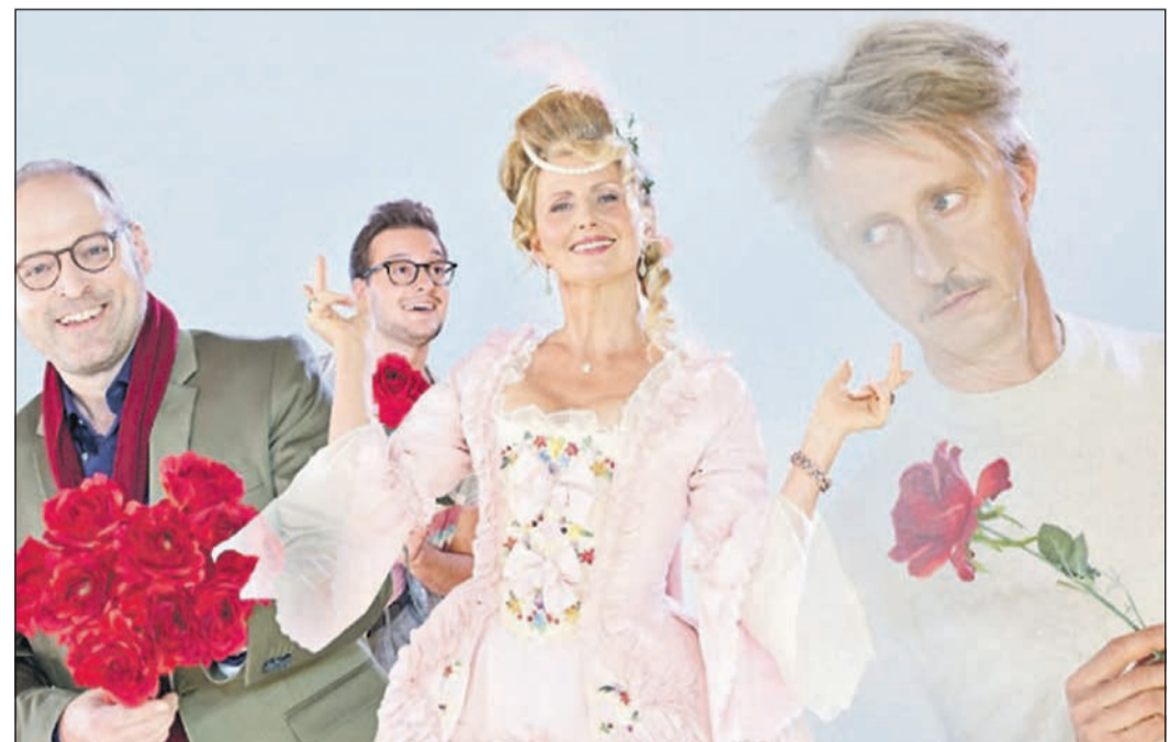
Die romantische Komödie „Noch einen Augenblick“ ist auf der Theaterbühne der Stadthalle zu sehen.