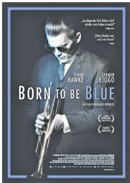
Das Eschborn K präsentiert am Wochenende eine Hommage an Chet Baker. Foto: Filmplakat des Eschborn K

Anzahl von Karten vergeben werden, um die geltenden Abstandsregeln zu gewährleisten. Zusätzlich gilt ab dem kommenden Wochenende die 2-G+-Regelung für den Zutritt zu den Veranstaltungen. Überall in den Innenräumen gilt Maskenpflicht.