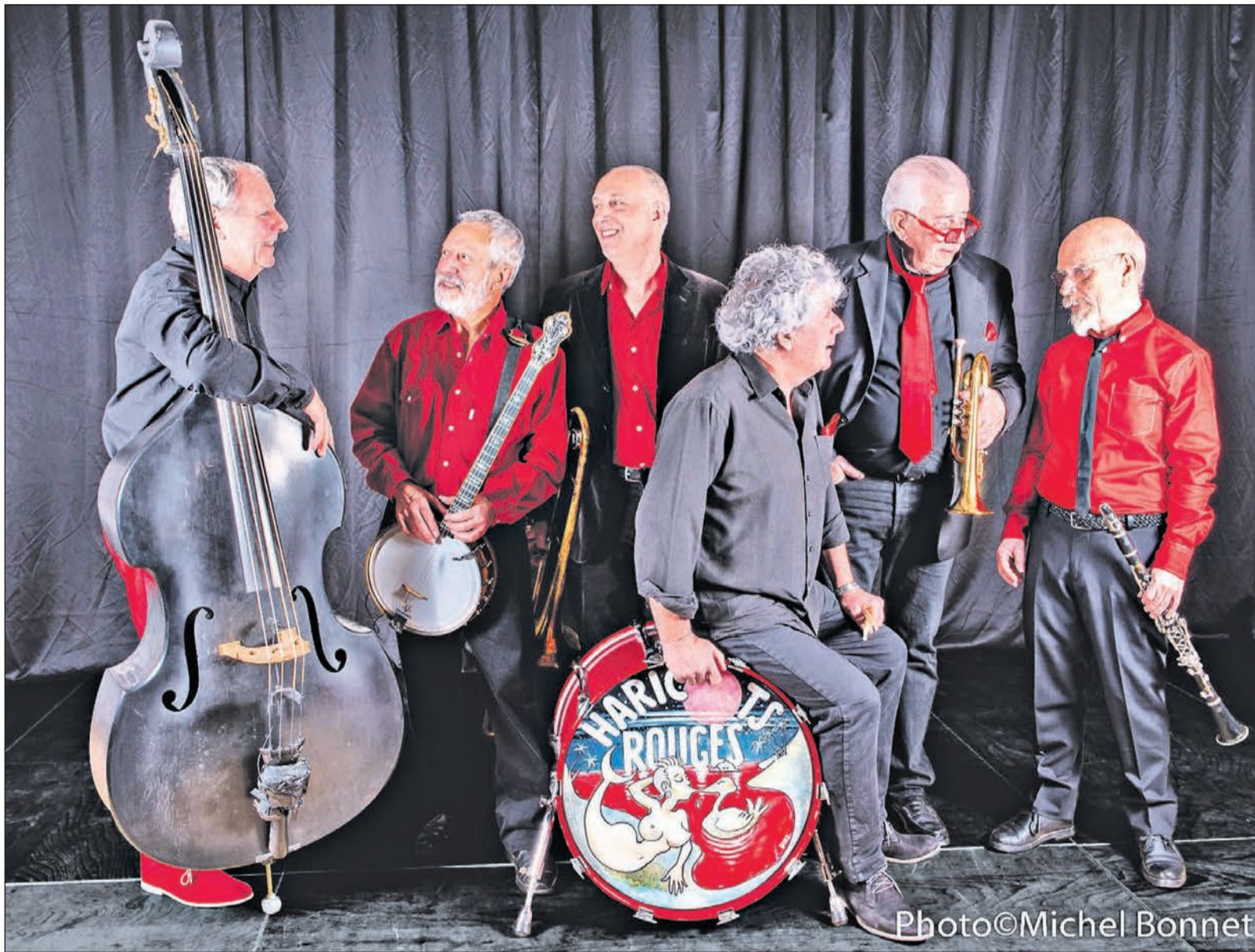
„Les Haricots Rouges“ bedeutet übersetzt „Die roten Bohnen“ und steht in diesem Fall für eine außergewöhnliche Jazz-Band, die zu Gast beim Kulturkreis ist.