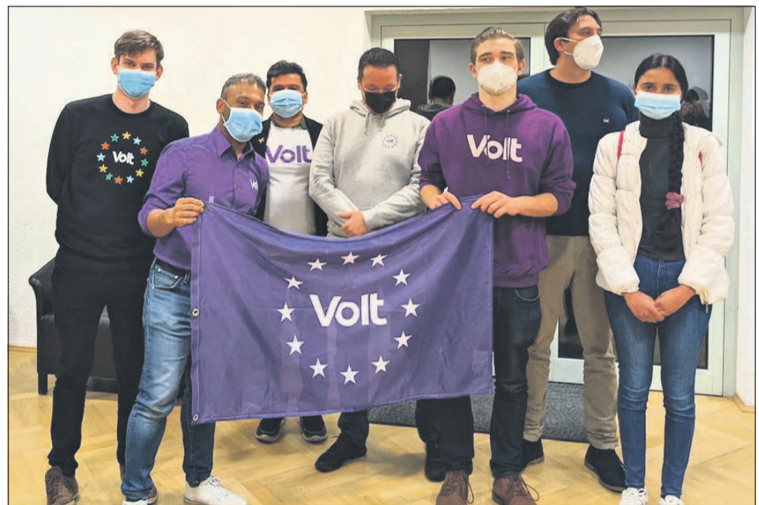
Der neue Vorstand der Volt-Partei nimmt nun seine Arbeit auf und betreut zunächst den Hoch- und Main-Taunus-Kreis, bis sich im Hochtaunuskreis ein eigener Vorstand gefunden hat.

Im Jahr 2017 gründeten eine Französin, ein Italiener und ein Deutscher die Partei Volt, als Reaktion auf den Brexit und den erstarkenden Rechtspopulismus in Europa. Ihr Ziel ist es, eine europaweite Partei aufzubauen, die allen Bürgern eine Stimme verleiht. Nach eigenen Angaben glaube Volt daran, dass globale Herausforderungen gesamteuropäische Lösungen erfordern. Seit Gründung ist die Bewegung auf Menschen aller Alters- und Berufsgruppen angewachsen. Die Partei ist mittlerweile in 30 Staaten Europas vertreten. In Frankfurt und Darmstadt ist Volt seit den Kommunalwahlen 2021 Teil der jeweiligen Koalitionen und stellt eigene Dezernenten.