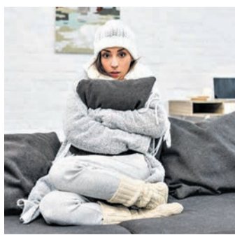
Wenn die Heizung bei winterlichen Minusgraden ausfällt, kann die schnelle Notfallhilfe teuer werden.

(djd). Gefühlt geschieht es immer am Abend, am Samstag oder Sonntag: Man sperrt sich aus der Wohnung oder dem Haus aus. Bei winterlichen Minusgraden versagt die Heizung ihren Dienst. Oder am Sonntag sind plötzlich Rohre oder die Toilette verstopft. Alle Ereignisse haben eines gemeinsam: Sie sind nicht nur ärgerlich, sondern ihre schnelle „Behandlung“ durch einen Experten kann richtig teuer werden. Das gilt für den Schlüsselnotdienst ebenso wie für den Heizungsservice. Die klassische Hausratversicherung kommt für solche Fälle nicht auf - als Ergänzung zur Hausratpolice kann deshalb ein sogenannter Wohnungs-Schutzbrief sinnvoll sein. Solche Schutzbriefe werden von vielen Versicherungsunternehmen unter verschiedenen Namen ange-