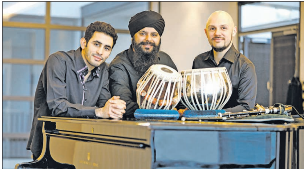
Das Weltmusik-Trio „Reveal“