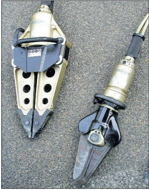
Rettungsspreizer und Rettungsschere

In der Nachbargemeinde Bad Soden-Altenhain wurde in der Nacht vom 5. auf den 6. Januar in das Feuerwehrgerätehaus eingebrochen. Unbekannte stiegen in das Gebäude der Feuerwehr ein und entwendeten dabei lebenswichtiges Rettungswerkzeug.