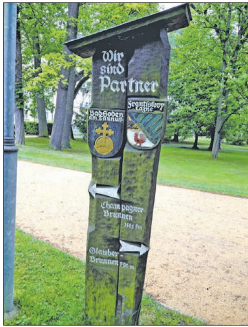
Holzstehle auf der „Bad Soden Promenade“ in Franzensbad.