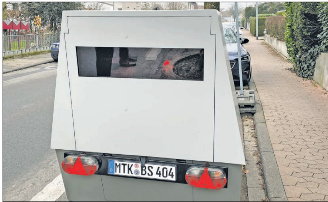
Der Enforcement Trailer dient der standortgebundenen Geschwindigkeitsmessung – kann aber an verschiedenen Orten eingesetzt werden.

Nach hessischem Recht wird der Enforcement Trailer jedoch als stationäres Geschwin-