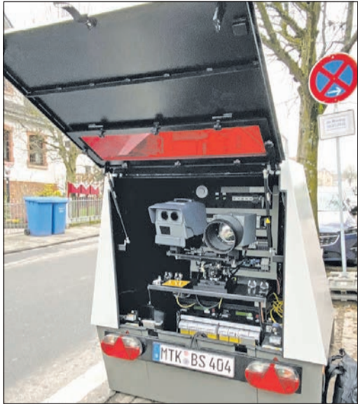
Diese Technik gibt Rasern keine Chance ...

Bad Soden (Sc) - Der erste öffentliche Presse-termin der Stadtverwaltung beschäftigte sich gleich mit einem wichtigen Thema – der Verkehrssicherheit. Ob „Falschparken“ oder „Rasen“, Verstöße gegen geltende Verkehrsregeln gibt es viele und manche gefährden zuweilen Menschenleben, weshalb sich die Stadt Bad Soden zu einer angepassten Verkehrsüberwachung entschlossen hat. Manche Bürgerinnen und Bürger mögen den Einsatz des nun neu im Einsatz befindlichen „Enforcement Trailers“ als „modernes Raubrittertum“ empfinden, die Erfahrungen der Stadt haben jedoch gezeigt, dass in Sachen Geschwindigkeitsüberschreitungen etwas passieren muss.