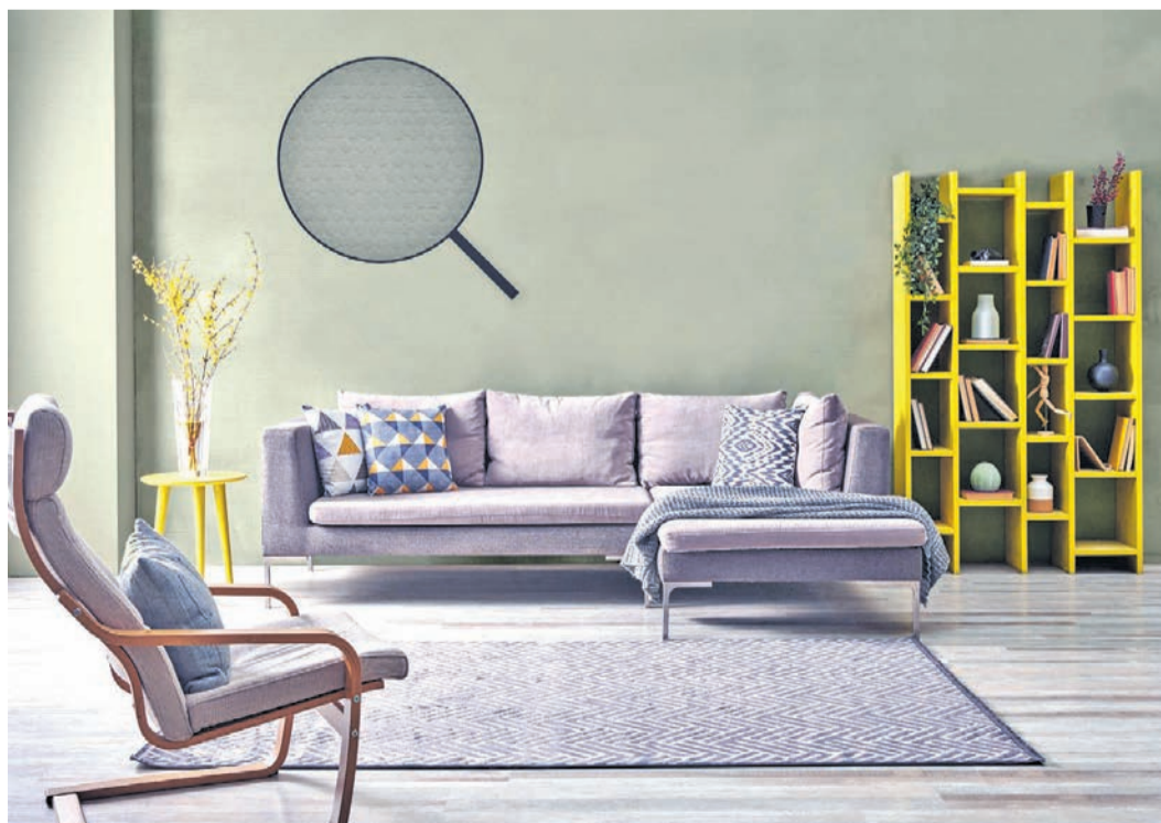
Kaum ein anderer Wandbelag ist optisch so flexibel wie die Erfurt-Tapeten. Nicht nur, dass das Sortiment zahlreiche unterschiedliche Strukturen – von grob bis fein – bietet. Die Tapeten können im Handumdrehen mit dem gewünschten farblichen Anstrich versehen werden.

bei der Wandgestaltung sind riesengroß und ebenfalls steht die Frage im Raum: Weiß ich heute schon, was mir morgen gefällt? Passt die Tapete in fünf Jahren noch zur neuen Einrichtung? Die Lösung für dieses Problem liefern überstreichbare Tapeten z. B. von Erfurt & Sohn. Sie bieten perfekte Voraussetzungen für eine schnelle Verwandlung, da sie ruck, zuck an die Wand gebracht werden können. Und egal ob Rauhfaser, geprägte Vliesfaser oder Glattvlies, es gibt für jeden Einrichtungsstil die passende Tapete, um dem Raum zu einer individuellen Ausstrahlung zu verhelfen. Zudem sind sie mehrfach überstreichbar und die Wandfarbe kann ohne viel Aufwand dem Wunschambiente angepasst werden. Ganz egal ob von Blau auf Grün oder von Gelb auf Rosé – alles ist möglich und die Wandgestaltung passt im Nu zu neuen Möbeln sowie Deko-Elementen wie Kissen, Gardinen & Co. Selbst Laien erreichen in kürzester Zeit und ohne viel Arbeit ein perfektes Tapezier-Ergebnis. Ein weiteres großes Plus: Die Tapeten sind nicht nur dekorativ und sehr nachhaltig, sondern unterstützen auch die Wohngesundheits. Frei von bedenklichen Inhaltsstoffen wie Weichmachern, PVC oder Lösungsmitteln begünstigen sie ein gesundes Raumklima. Mehr zu den überstreichbaren Tapeten gibt es unter www.erfurt.com .