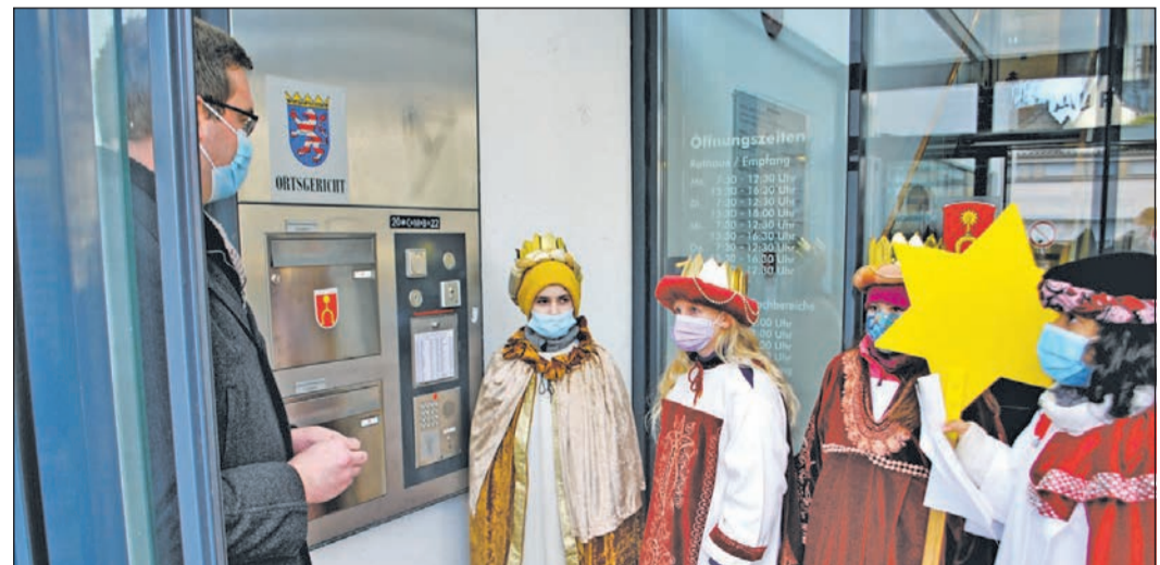
Die Sternsinger zu Gast im Sulzbacher Rathaus