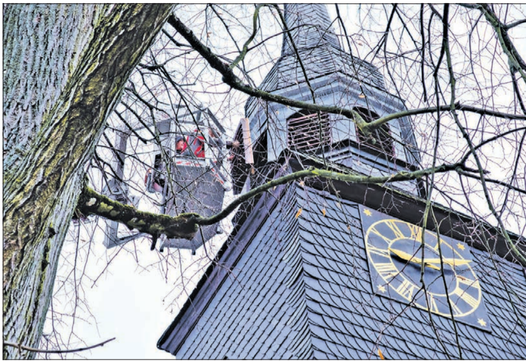
Schreiner Thomas Gerecht baut das neue Fenster im Turm der St.-Georgs-Kirche ein. Dazu muss er mit einem Hubwagen an seinen Arbeitsplatz gebracht werden.