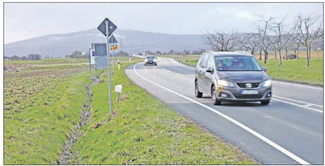
Hier darf ab sofort nicht mehr schnell gefahren werden. Am Ortseingang gilt auf der Kronberger Straße jetzt Tempo 70.