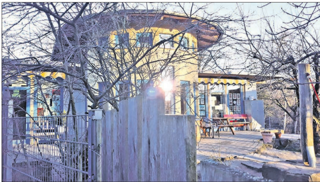
Das „Regenbogenland“, hier in der Frühsonne am Morgen, wird ebenso wie die anderen Kindertageseinrichtungen in städtischer Hand bleiben.