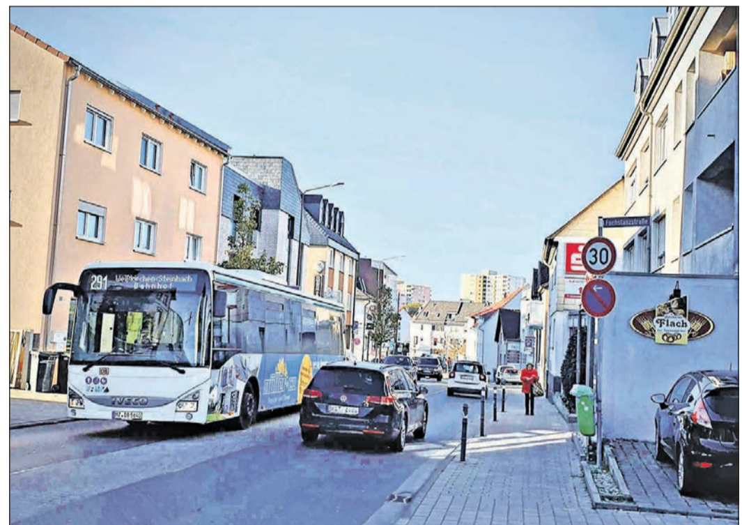
Mehr Sicherheit für Radfahrer und weniger Anfahrtslärm sind nur einige Argumente für eine einheitliche Temporegelung in der Bahnstraße.

Die CDU-Fraktion erklärte, sie vertraue auf die Kompetenzen der Straßenverkehrsbehörde und sehe dem Ergebnis der Überprüfung mit Interesse entgegen.