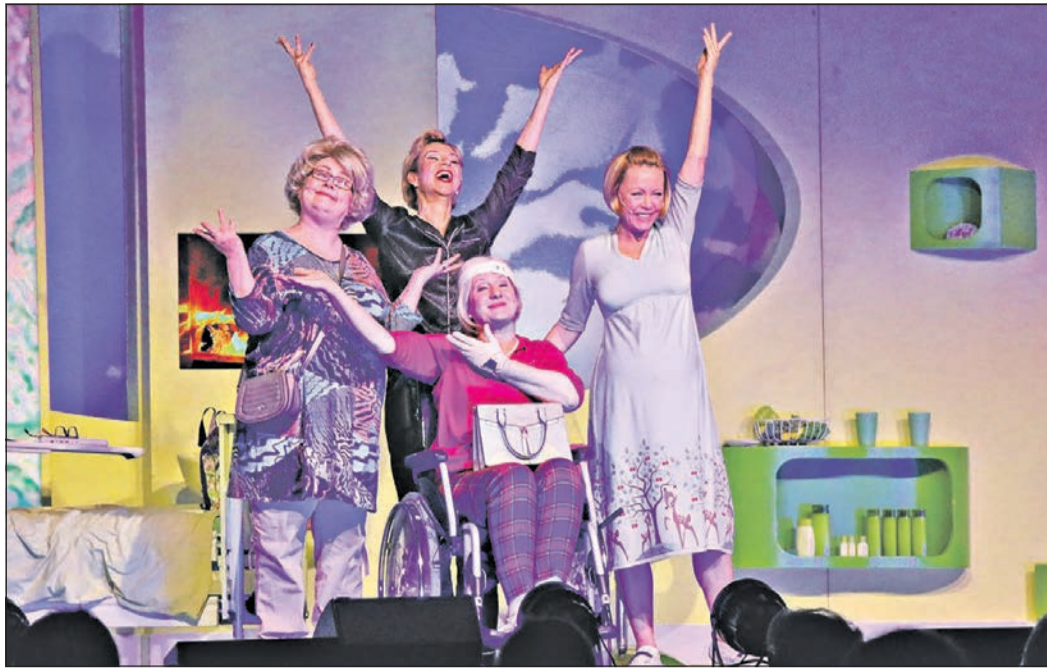
Die Probleme, die das Älterwerden so mit sich bringt, werden von den vier Ladies einfach musikalisch aufs Korn genommen. Was bleibt, sind „Himmlische Zeiten“.