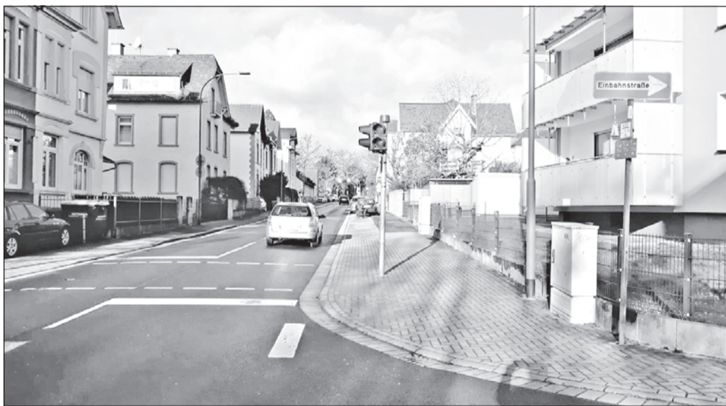
Bevor die notwendige Straßensanierung im unteren Bereich der Altkönigstraße angepackt wird, soll die Parkplatzfrage auf dem Seitenstreifen (rechts) geklärt werden.

Flickenteppich, die Sanierung könne aber noch aufgeschoben werden, so die einhellige Meinung. Denn um ans Fördergeld ranzukommen, müsste die Stadt bei der Planung ein wenig umdenken. Neue Richtlinien zum Mobilitätsfördergesetz, die ungefähr gleichzeitig mit dem Planungsantrag erlassen wurden, verlangen andere Voraussetzungen für einen positiven Bescheid. Gefördert werden sollen Projekte dann, wenn sie den Fuß- und Radverkehr in den Vordergrund stellen, beim Altkönigstraßenbeispiel müssten dann etwa Parkflächen im seitlichen Streifen wegfallen. Das kam im Ausschuss bei der Mehrheit gar nicht gut an, die Stadt wollte den etwa zwei Meter breiten Parkstreifen mit etwa 13 Stellplätzen erhalten und ihn durch drei Grüninseln gliedern. Auf der Prioritätenliste des BSO bei der Straßensanierung bleibt das Teilstück weit oben, Beginn ist aber erst später, das mögliche Fördergeld soll nicht leichtfertig verschenkt werden.