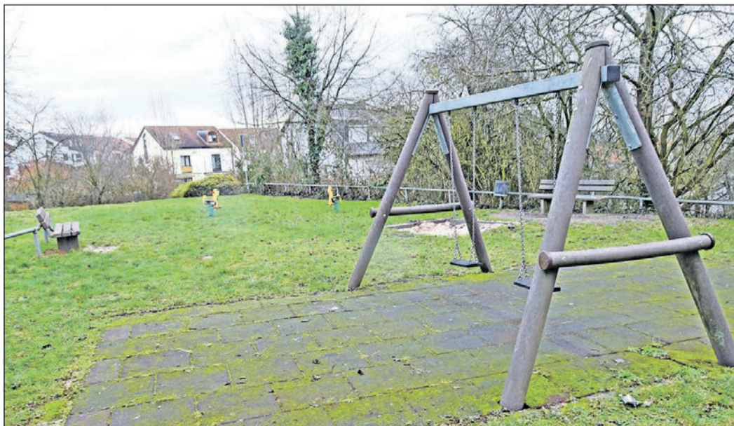
Aus dem unscheinbaren Gelände am „Teufelsberg“ soll einmal ein attraktiver Abenteuerspielplatz werden.

Bei der Gestaltung soll die Schülervertretung der Geschwister-Scholl-Schule auch ein Wörtchen mitreden. Die Klassensprecher haben bereits bei der Anlage des Spielplatzes an der Obergasse mitgewirkt. Ein Klettergerüst, das vom Hersteller eigens angefertigt wurde, war genauso ihre Idee, wie eine sogenannte „Super Nova“, eine äußerst wackelige Scheibe, die sich für Gleichgewichtsübungen eignet. Im kommenden Jahr soll der „Teufelsberg“ zur attraktiven Adresse gerade für ältere Kinder werden.