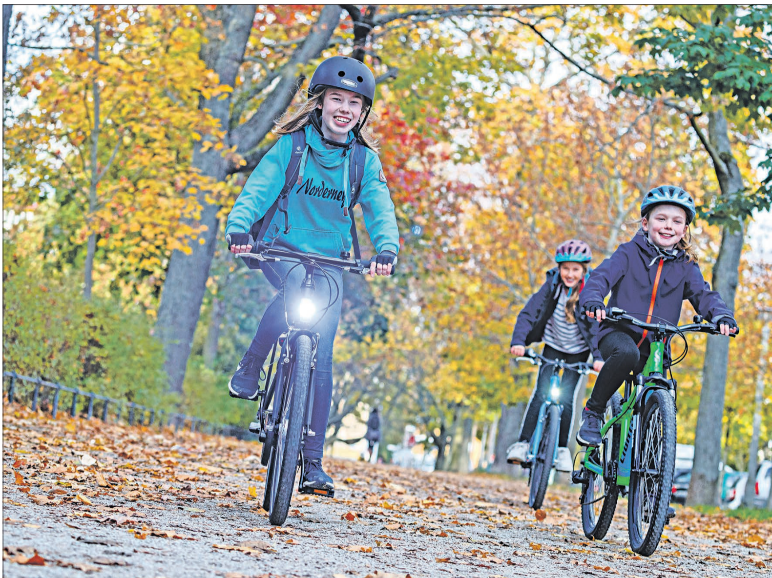
Auch für die Schüler, die täglich mit dem Fahrrad in die Schule pendeln, brächte das neue Radwegekonzept viele Vorteile. Nach Schätzung des Planungsbüros erhöht sich deren Zahl von 300 auf mehr als 500 pro Tag.