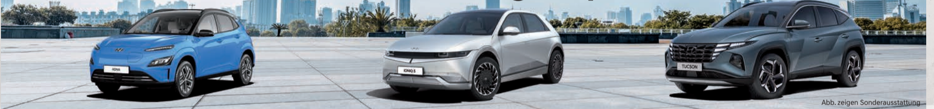
Abb. zeigen Sonderausstattung

Jetzt bei Nau mit voller e-nergie sparen!