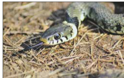
Auch die Ringelnatter ist im „Süßen Gründchen“ schon gesichtet worden.