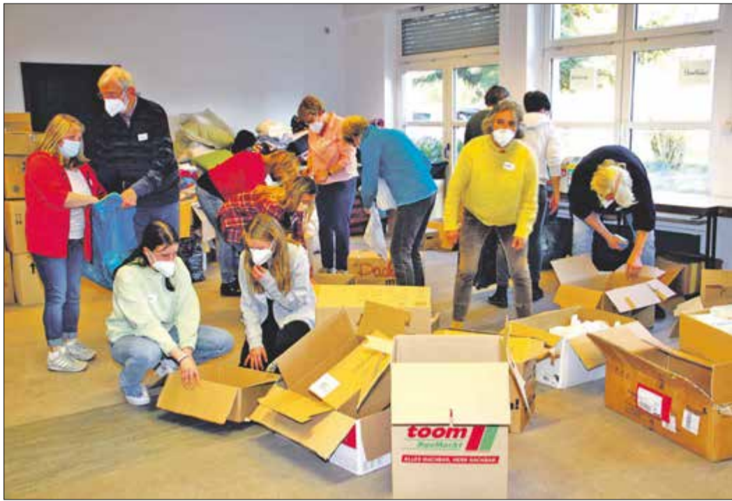
Insgesamt packten an beiden Tagen rund 70 Helferinnen und Helfer tatkräftig an, um die Spenden im Pfarrheim auszuwickeln, zu sortieren und transportgerecht in bereitstehenden Kartons zu verstauen.