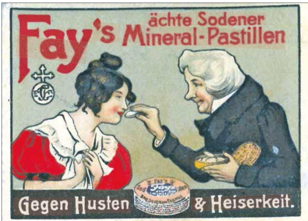
Die Briefmarke aus dem Jahr 1908 ist das Museumsstück im Monat März und kann im Stadtmuseum bewundert werden.