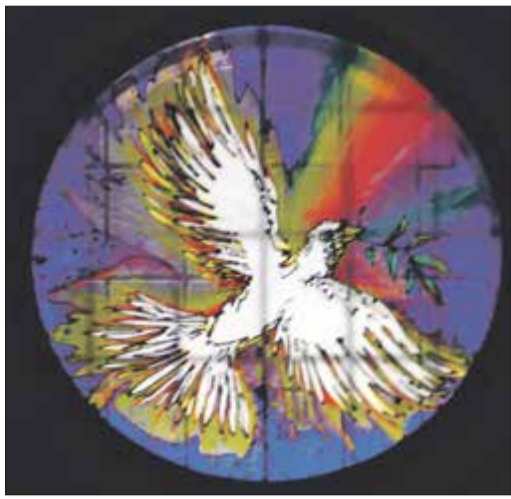
Die Friedenstaube ist zurück.