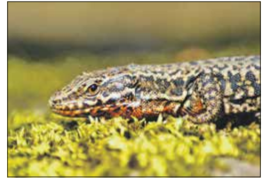
Blindschleichen gibt's auch ...

jedes „Dach über dem Kopf“. Vor dem Totholz befinden sich zwei Ansammlungen von großen Wackersteinen. Diese dienen Eidechsen und Amphibien – die durchaus von den feuchten Wiesen herüberwandern – als Rückzugsort. Reptilien brauchen darüber hinaus Sonnenplätze, um ihren Körper aufwärmen zu können. Gerne liegen sie bei Sonnenschein auf den großen Steinen und wärmen sich an den Sonnenstrahlen.