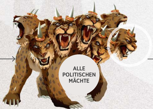
ALLE POLITISCHEN MÄCHTE

Es steht für alle politischen Mächte, die im Verlauf der Menschheitsgeschichte geherrscht haben. Die sieben Köpfe stehen für sieben Weltmächte, deren Handeln sich maßgeblich auf Gottes Volk ausgewirkt hat.