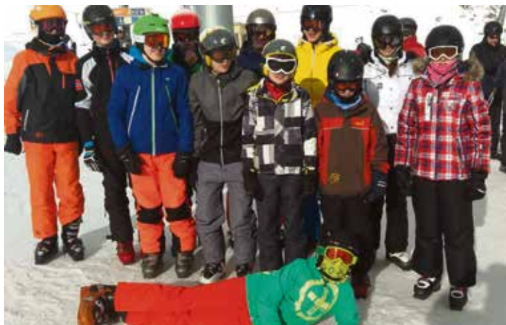
ssc-3103: Das Kids Camp des SSC, das am Stubaier Gletscher stattfindet, erfreut sich seit vielen Jahren bei Kindern und Jugendlichen großer Beliebtheit.

der auch im April noch hervorragende Schneebedingungen bietet. Im Rahmen des Kids-Camps können neue Techniken erlernt und das skifahrerische Können verbessert werden. Es gibt noch einige Restplätze! Weitere Infos und Anmeldung: www.ssc-taunusstein.de