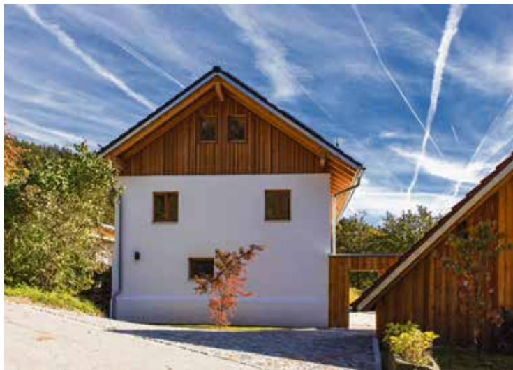
Der ursprüngliche Charakter des 1894 erbauten Hauses konnte dank der Sanierung mit Naturkalk erhalten werden.

Bauernhaus von 1894 erfüllt energetische Standards