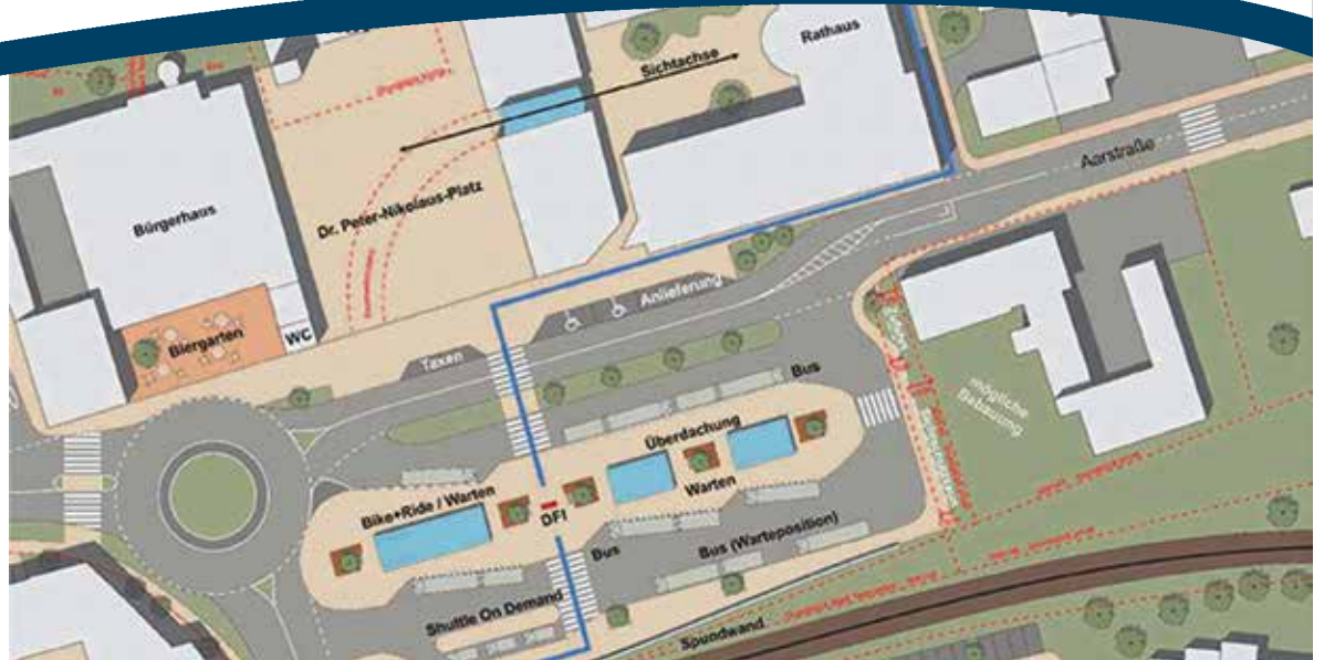
Konzeptskizze einer möglichen Neugestaltung des ZOB in Hahn.