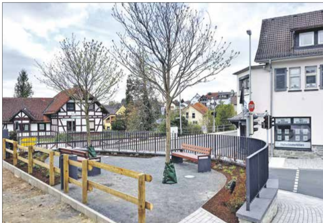
Die letzten Arbeiten am künftigen Karl-Thumser-Platz werden bis zum 10. Mai abgeschlossen sein.