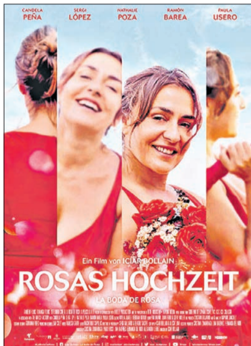
Der Film „Rosas Hochzeit“ wird am Freitag im Eschborn K gezeigt. Foto: Filmplakat

Weitere Informationen zu den Programmen des Eschborn K finden Interessierte ebenfalls im Internet unter www.eschborn-k.de .