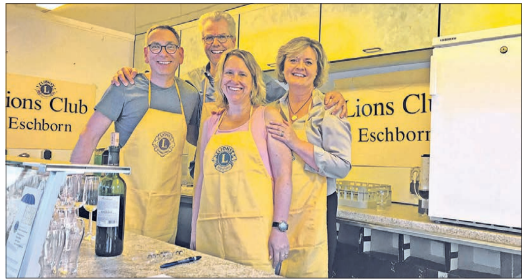
Der Lions Club Eschborn freut sich, am Stand beim in diesem Jahr wieder ausgerichteten Eschenfest dabei zu sein.

eine Option, die aber bei allen Beteiligten nicht sonderlich beliebt ist. Für die Lehrer stehen nun die Korrekturen der Prüfungsklausuren an. Danach werden die Klausuren noch einmal von einem Zweitkorrektor überprüft. Es kann sein, dass in einzelnen Fächern die Zweitkorrekturen an andere Schulen des Schulamtsbezirks gehen. Das ist in diesem Jahr im Fach Ethik der Fall. Oberstufenleiterin Firsching sitzt schon an der Vorbereitung der nächsten Prüfungsrunde. In der zweiten Junihälfte stehen die Prüfungen im vierten und fünften Prüfungsfach an. Im vierten Prüfungsfach können die Prüflinge wählen, ob sie eine mündliche oder eine Präsentationsprüfung absolvieren wollen, die fünfte Prüfung ist immer eine mündliche. Schüler, Prüfer und natürlich auch die Eltern, freuen sich auf die Abschlussfeier im Juli. Die Feierlichkeiten werden in diesem Jahr erstmalig zweigeteilt sein. Am 6. Juli findet mittags in der Schule eine akademische Feier mit Reden und der Zeugnisübergabe statt, und am 7. abends wird das Tanzbein auf dem Ball in der Stadthalle Hofheim geschwungen. Aber bis dahin gibt es für alle Beteiligten noch einiges zu tun.