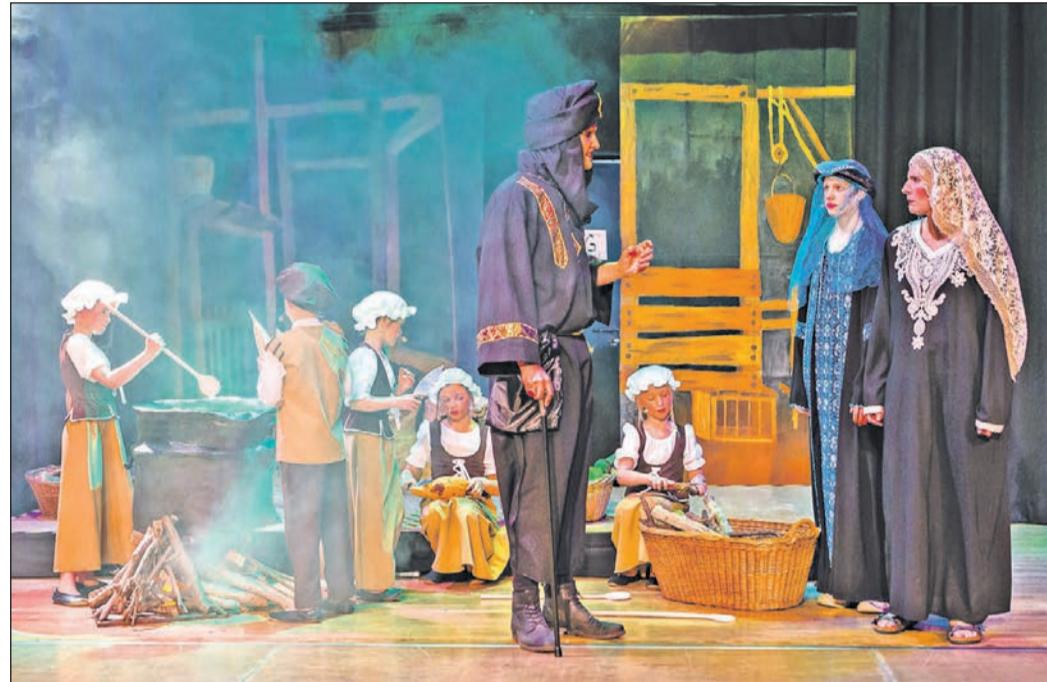
Die evangelische Andreaskirche lädt für 11. Juni zum etwas anderen Kindermusical-Projekt „Schuhhandel“ ein, das als Film gezeigt wird.

Wanderung , Turnverein Eschborn, Rundweg Mörfelden-Walldorf, Treffpunkt Bahnhof Eschborn-Mitte, 9 Uhr