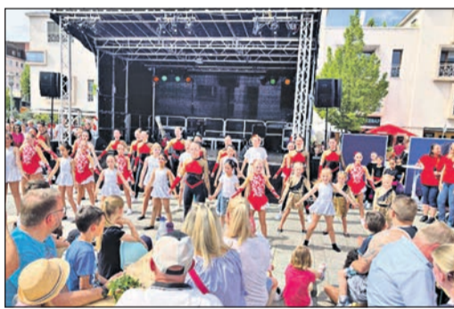
Auch die Vereine begeistern mit ihren gelungenen Aufführungen die Besucher beim Eschenfest.

Das attraktive Musikprogramm auf den beiden Bühnen auf dem Eschenplatz und dem Rathausplatz steuerte sein Übriges zur guten Stimmung bei: Nach der Eröffnung durch Bürgermeister Adnan Shaikh sorgte die „Taurus Bigband“ für beste Laune, und auf dem Rathausplatz gab die Band „Radau“ ein Rockkonzert für Kinder. Walk-Acts im gesamten Festbereich sorgten für gute Unterhaltung: Die Stelzenläufer mit ihren aufwändigen Kos-