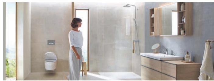
Dusch-WCs bringen den Clean Beauty-Trend zu schonend natürlicher Pflege auch auf die Toilette.

kann er sich schlecht vor äußeren Einflüssen schützen. Bei der Reinigung dieses Bereichs ist es daher besonders wichtig, milde und sanfte Methoden einzusetzen, auch nach dem Toilettengang. Hautärzte raten von allem ab, was die empfindliche Intimhaut reizen könnte. Das betrifft recyceltes oder bedrucktes Toilettenpapier, da es Chemikalien und Farbstoffe enthält, ebenso wie Reinigungsprodukte mit Duftstoffen, Seifenstoffen oder Konservierungsmitteln. Clean Beauty in seiner reinsten Form bieten Dusch-WCs wie das AquaClean Mera von Geberit. Der Po wird nach jedem Toilettengang mit einem sanften Wasserstrahl gereinigt, dessen Temperatur, Stärke und Position man individuell einstellen kann. Für die Trocknung danach haben manche Modelle einen integrierten Föhn. Unter www.geberit-aquaclean.de gibt es dazu weitere Infos und Unterstützung bei der Modellauswahl. Die Reinigung mit reinem Wasser schenkt ein nachhaltiges Frischegefühl und schont die Haut.