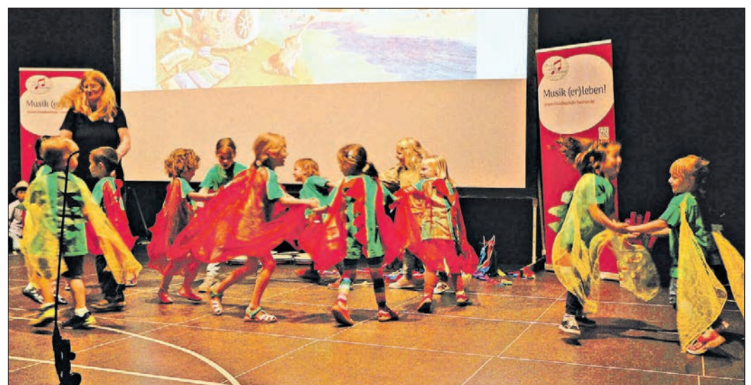
Mit Furzipups, dem Knatterdrachen, und den tanzenden Kinderdrachen begeistert die Musikschule Taunus das Publikum.