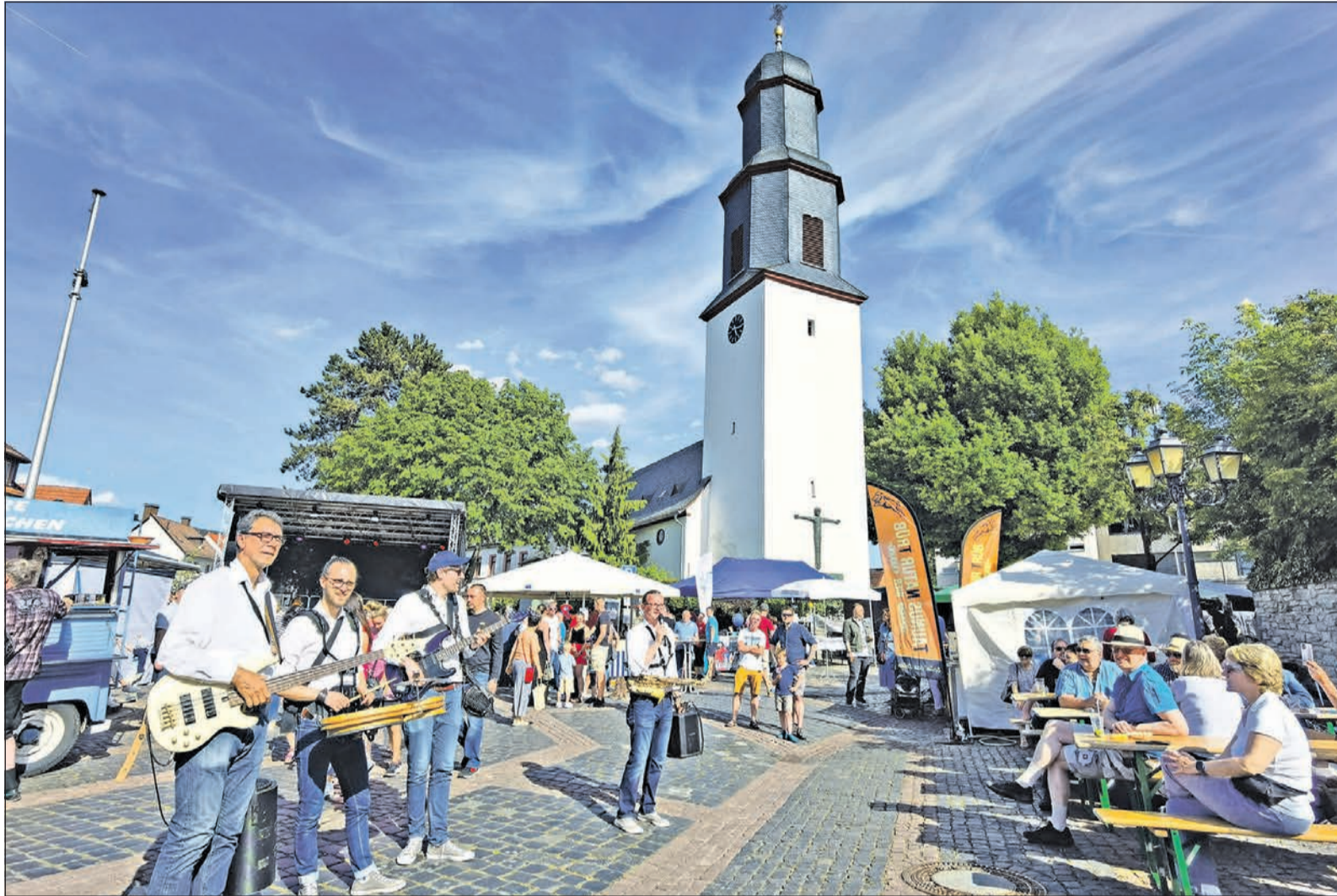
Beim Eschenfest feiern zahlreiche Besucher bei bestem Sommerwetter mit. Zahlreiche Attraktionen von Stelzenläufern und Musikbands bis hin zur Lasershow und zum Kinderprogramm begeistern Jung und Alt.

Engel & Völkers Kronberg Engel & Völkers Immobilien Deutschland GmbH Frankfurter Straße 13 · 61476 Kronberg Telefon +49 6173 60 10 70 taunus@engelvoelkers.com Immobilienmakler