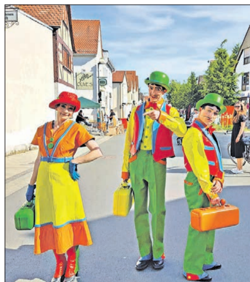
Walk-Acts im gesamten Festbereich bringen gute Laune.