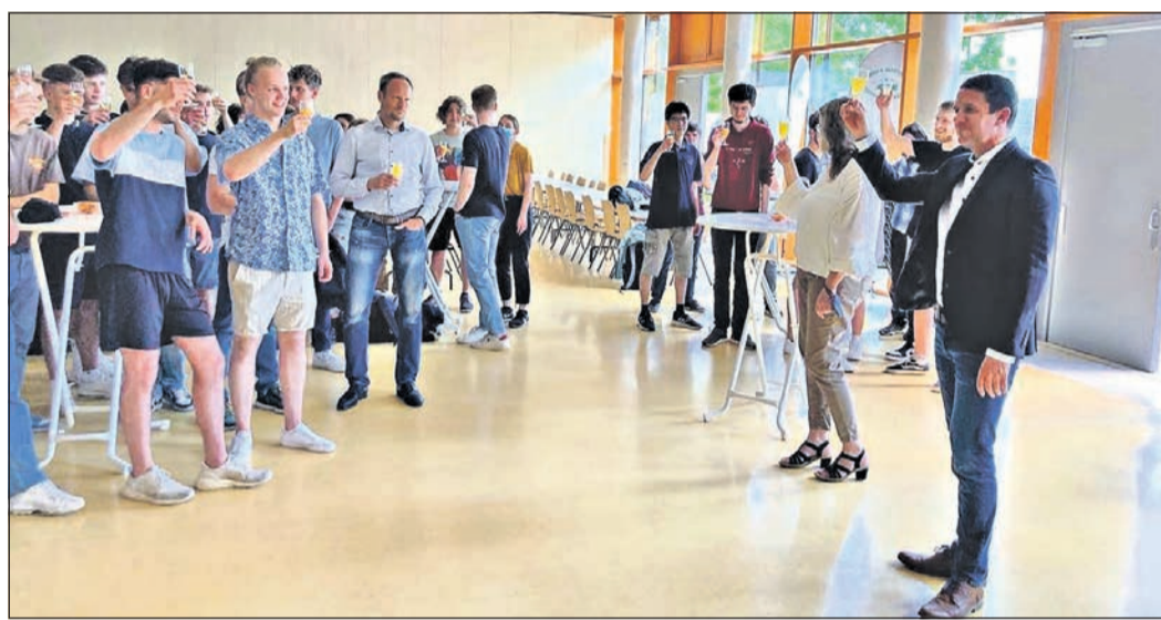
Mit einem Umtrunk wird an der Heinrich-von-Kleist-Schule das Ende der schriftlichen Abiturprüfungen begangen.

In diesem Jahr fand endlich wieder das Eschenfest statt. Die Lionsfreunde waren mit ihrem Stand und dem Glücksrad vertreten und freuten sich bei bestem Wetter über den guten Besuch und die vielen persönlichen Begegnungen. Der Reinerlös wird wie bisher für soziale und karitative Zwecke verwendet.