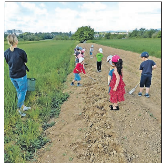
Die Kinder der Kita Schillerstraße setzen mit Spaten und Grabgabeln ausgerüstet die Kartoffeln von Hand.

Mehr zum Brauchtumsverein steht im Internet unter www.brauchtumsverein-ndh.de .