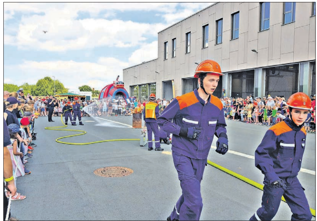
Eine Schauübung der Jugendfeuerwehr findet beim „Tag der offenen Tür“ statt und begeistert die Besucher.