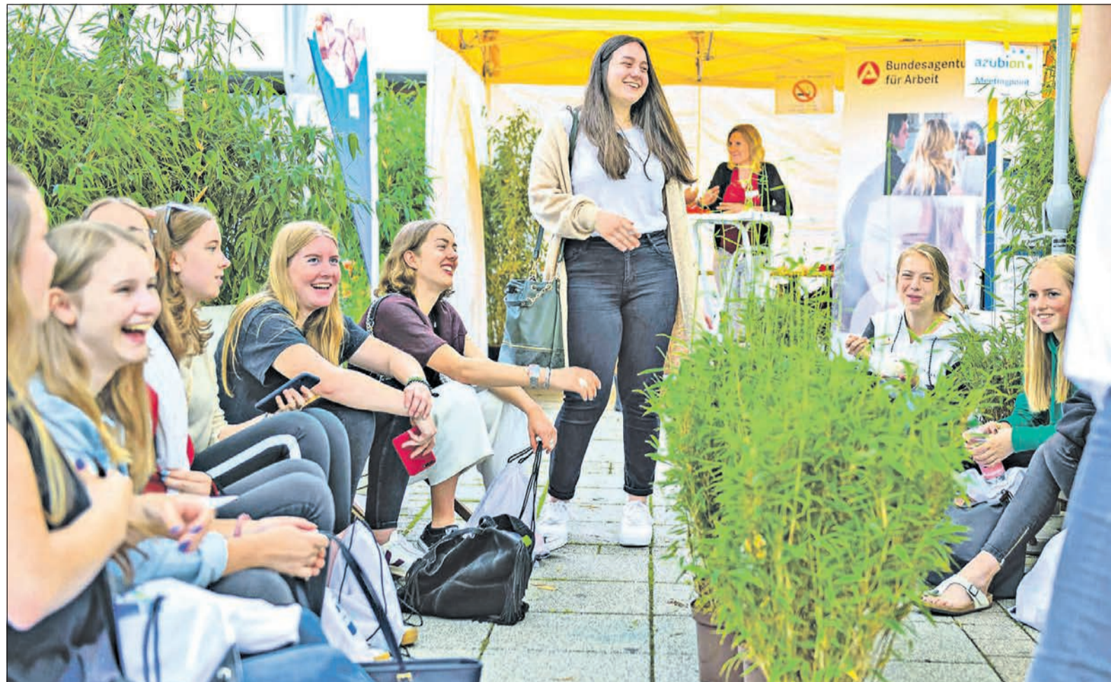
Bei der „azubion“-Erlebnistour fahren die Schüler den Tag über mit Bussen zu den einzelnen Firmenzentralen. Hier erhalten sie wertvolle Informationen zu möglichen Ausbildungen oder Studien.

Engel & Völkers Kronberg Engel & Völkers Immobilien Deutschland GmbH Frankfurter Straße 13 · 61476 Kronberg Telefon +49 6173 60 10 70 taunus@engelvoelkers.com Immobilienmakler