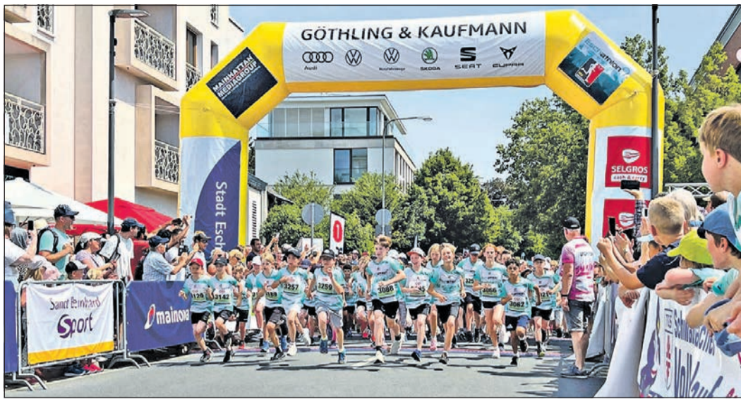
Über 500 Kinder starten mit vollem Einsatz den Lauf, hier sind unter anderem auch die tollen T-Shirts und die Medaillen klare Anreize.