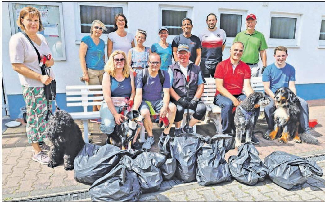
Bei bester Stimmung präsentieren sich die Helfer zusammen mit Bürgermeister Alexander Immisch (3. v. r.) – mehrere Säcke mit Müll und Abfall haben sie anlässlich des 20-jährigen Bestehens der Kampagne „Sauberhaftes Hessen“ zusammengetragen.